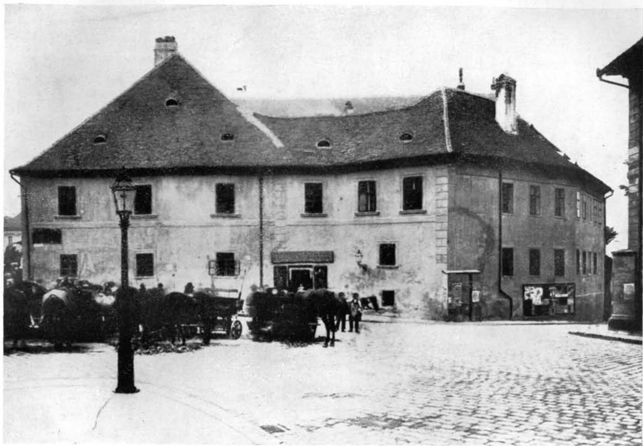
3. A Dísz-tér 1—2 számú házak a lebontás előtt (1900).