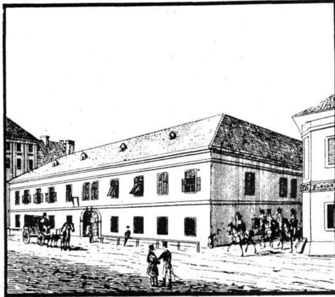
15. Pest-vármegyeháza a Granátéros útszában. (Vasquez)

A Gránátos-utca két megyeházat látott. Az első cseréptető, hosszú, egyemeletes ház volt, tágas zöld kapuval, tizenegy zsalugáteres ablakkal az emeleten ; a földszinten ilyenből volt nyolc. A ház előtt végig derékg erős fakorlát, nyilván, hogy amikor a megyehuszárok bejönnek a »megyére«, a lovaikat odakössék. A házfalon lógott egy bekeretezett tábla, amely figyelmeztette a kvártély-csináló tisztet, hogy az épület a katonaszállásolástól és katonaelelmezéstől mentes.