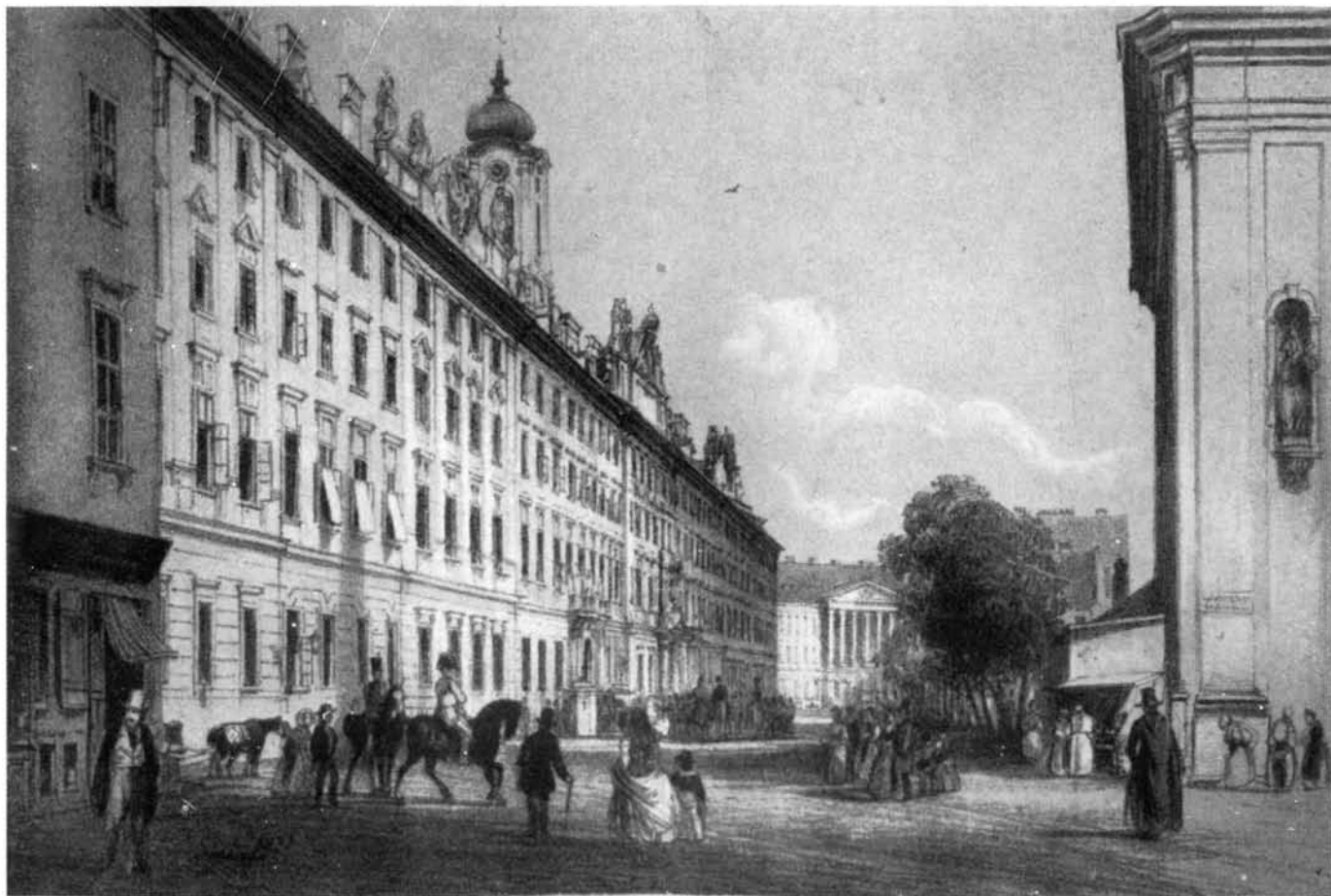
17. A Gránátos-utca a Szervita-tér felől nézve.