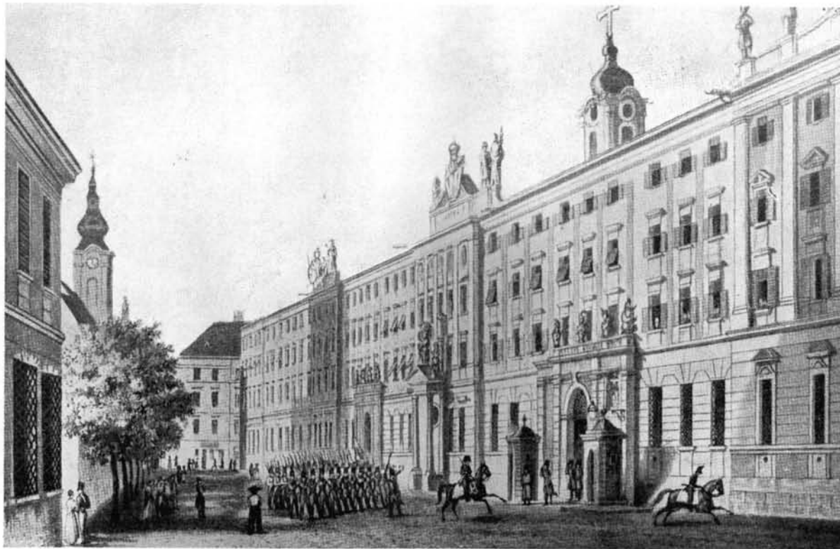
16. A Gránátos-utcának a Károly-kaszárnya előtti része.