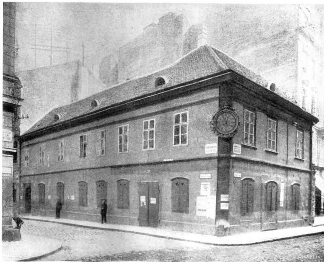
14. A »Zenélő Óra« és »Arany Ökör« háza.