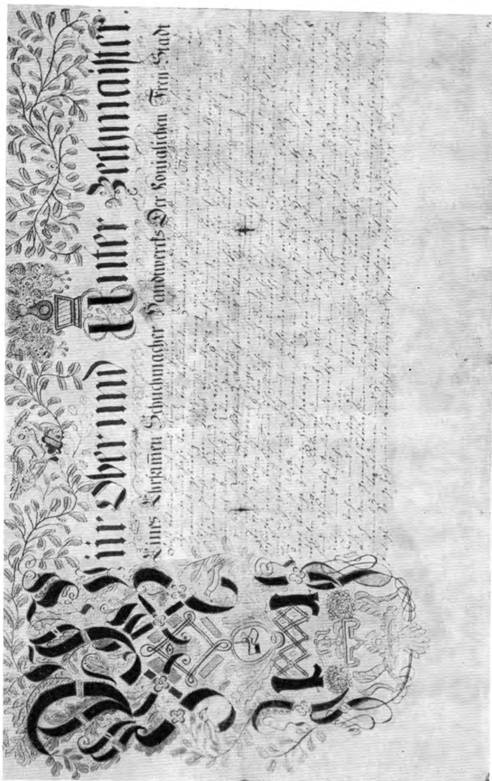
4. Pesti varga céh felszabadító levele. 1754. Kiscelli Múzeum