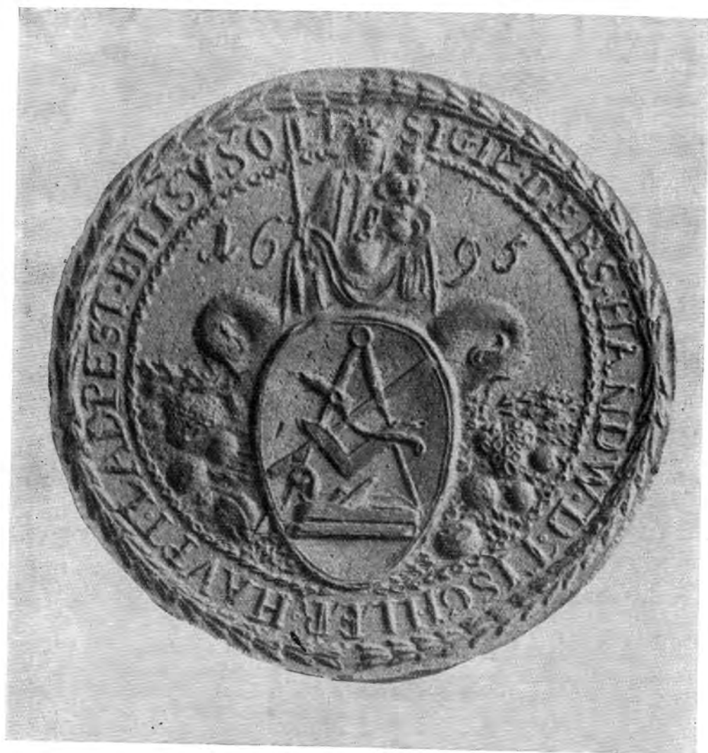
1. Pesti asztalosok céhpecsétje. 1695. Kiscelli Múzeum

pólium védelmének az inasok felvételénél tapasztalható jelenségei; a megszorítások, a magas felvételi taksák, az inaslétszám korlátozása, a rokonoknak biztosított kedvezmények, mind megvoltak.