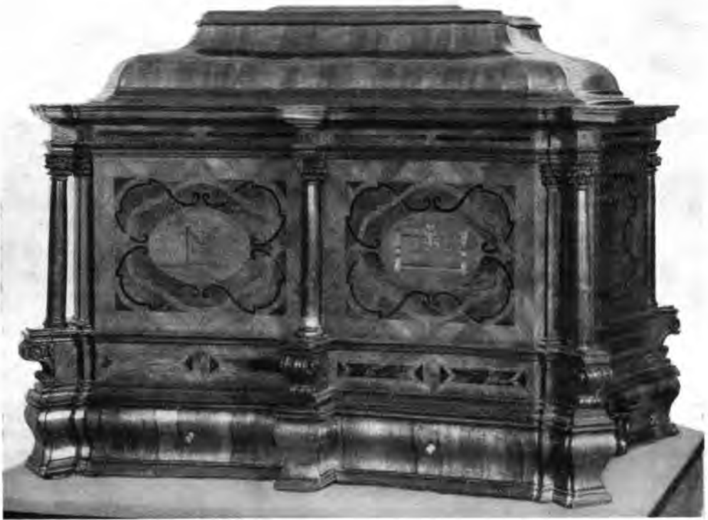
2. Pesti asztalosok céhládája. XVIII. sz. I. fele. Kiscelli Múzeum