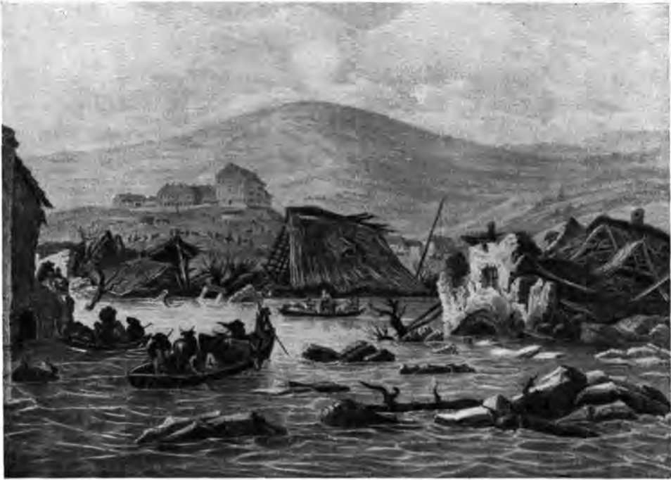
2. Egykorú ábrázolás az 1838-as árvízről.