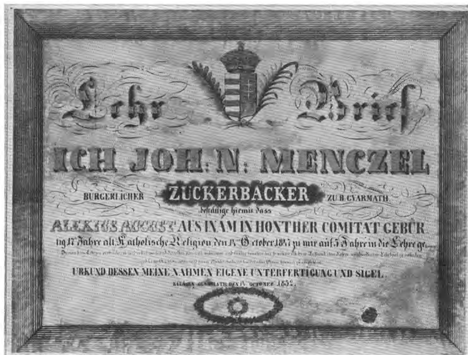
1. August Elek felszabadítólevele (1852)

született. Születési ideje vagy életkora, valamint szüleinek neve azonban bejegyezve nincs. A wagstadti plébánia közlése szerint a keresztelési anyakönyvben 1770-ig visszamenőleg Augustz Elek nem szerepel.