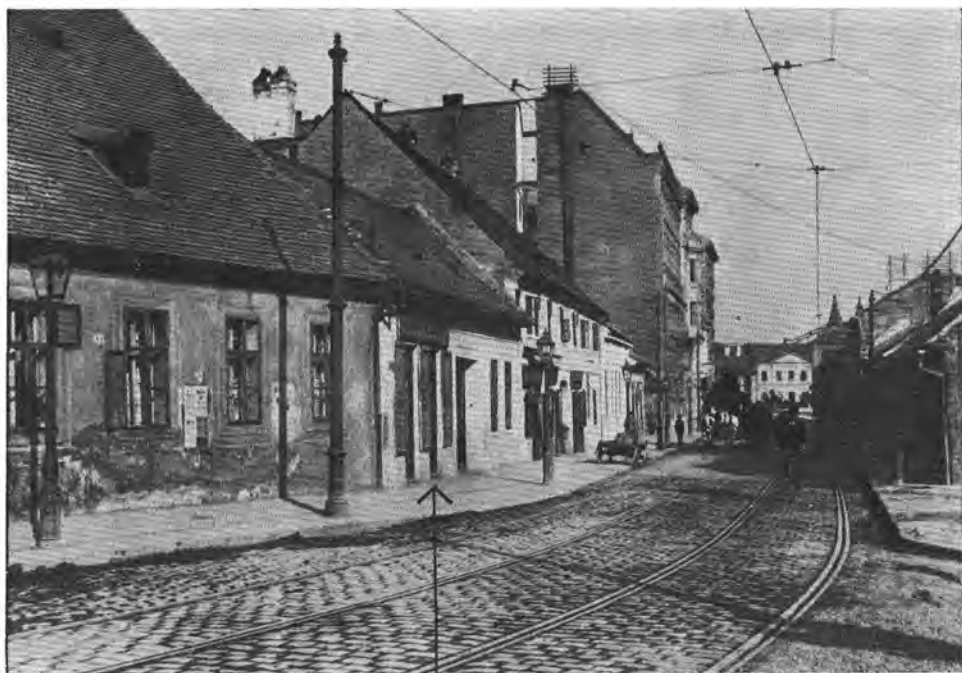
2. Az Auguszt cukrászda Attila körút 14. sz. alatti fióküzlete. (1908 és 1923 közötti felvétel.)