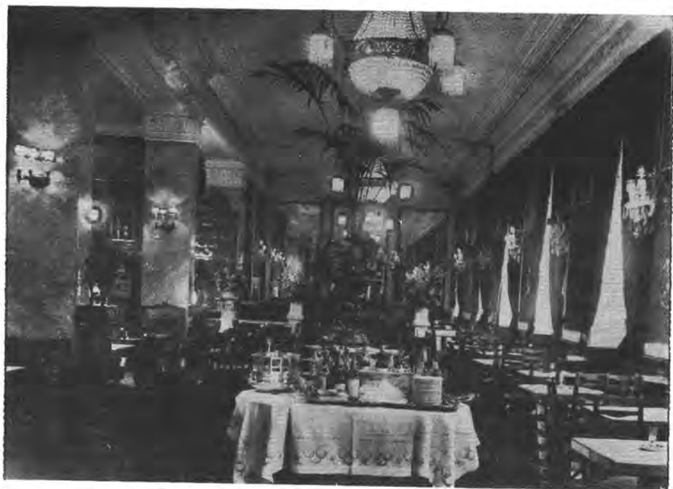
6. Részlet a Krisztina tér 3. sz. alatti cukrászdából (1930)

két — hatszögletű — kis alapterületű, magas vitrinben porcelán dísz tárgyak, üres bonbonos díszdobozok voltak.