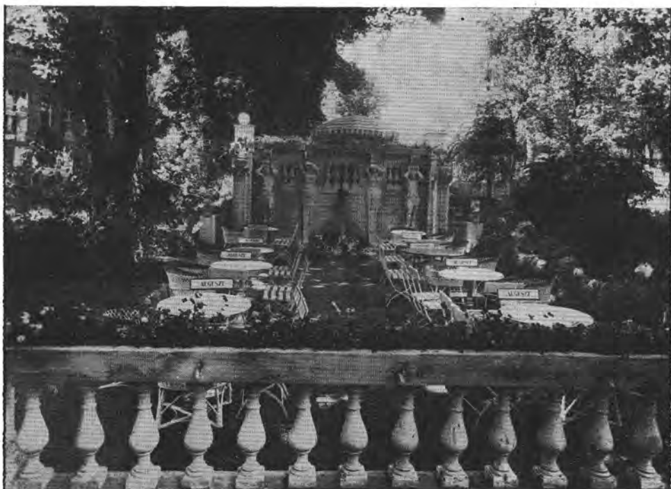
4. Részlet az Auguszt pavillon kertjéből (1930)

31-ig pedig Ugocsa utca 11. sz. alatt is tartott fenn fióküzletet. 103 Ezek egyszerűen berendezett egy-egy helyiséges üzletek voltak.