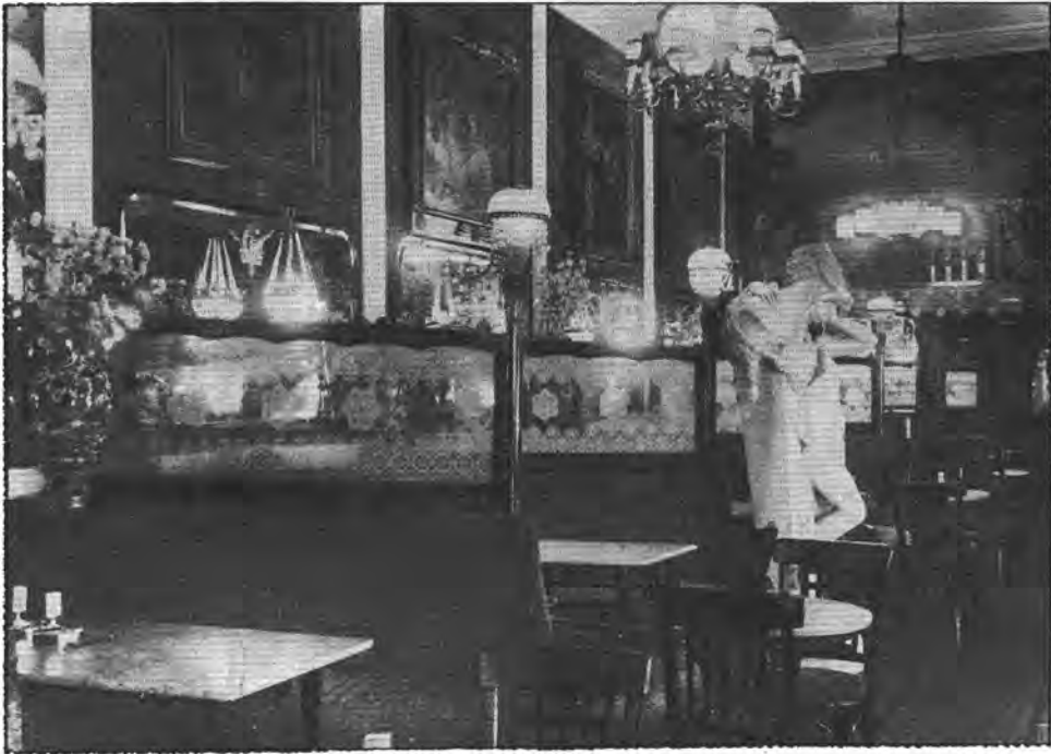
7. A páholsor a Krisztina tér 3. sz. alatti cukrászdában (1930)

tükör. E tükrös fal, valamint a Roham utcára néző két ablak előtti területet sárga márvány ballusztrád választotta el a helyiség többi részétől.