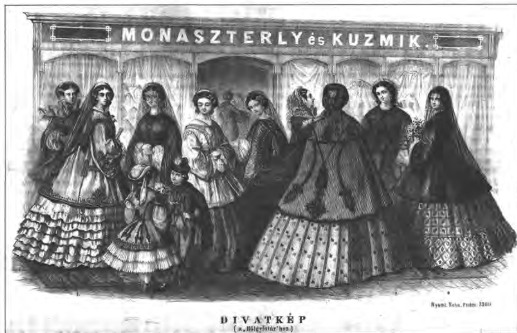
Rohn Alajos: A Monaszterly és Kuzmik cég hirdetése. Papír, könyomat, 350x553 mm. Hölgyfutár, 1860.