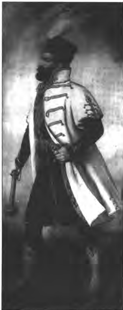
Barabás Miklós: Zrínyi Miklós. A Kostyál Ádám által tervezett jelmez felhasználásával.

1888-ban egy újabb igen színvonalas divatlap jelent meg, a Divatsalon 24 a bécsi Wiener Mode 25 társalapjaként. A kiadványok sikerét jelzi, hogy hamarosan újabb újságok is felbukkantak: a Bazár , a Budapesti Bazár és a Divatújság . Az előző kettő elég gyenge színvonalú volt, de a Divatújság 26 több figyelmet érdemel, mivel szerkesztője Csepreghyné Rákos Ida volt, a Népszínház igen kedvelt jelmeztervezője és szabója. Így tehát ez volt az első olyan divatlap, amelyet nem író, hanem ruhatervező adott ki, de minősége sajnos nem érte el a Magyar Bazár ét vagy a Divatsalon ét.