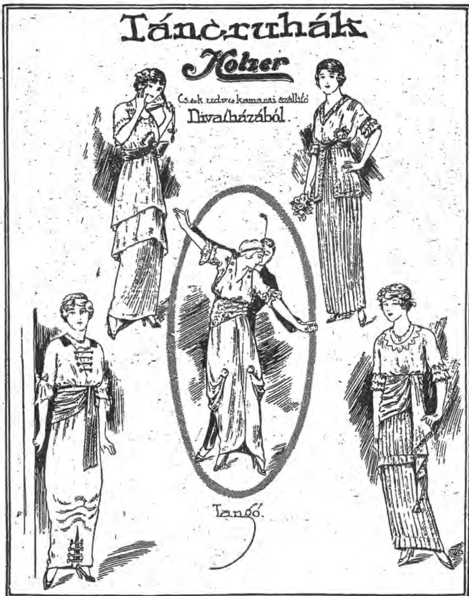
A Holzer Divatház hirdetése. Színházi Élet, 1913., II. 65.

1882-ben önállósította magát a Koronaherceg u. 1. szám alatt. Életének csúcspontja valószínűleg 1916-ban volt, amikor IV. Károly koronázására hat hét alatt 163 női díszruhát készített, köztük a királyné, Zita koronázási öltözékét is.