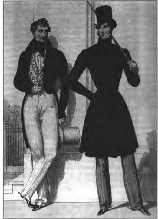
Franz Stöber: Divatkép. Színezett könyvomat, Wiener Theaterzeitung , 1831. XXVIII., 84. A jobb oldali figura kabátja és a Zrínyi-ruha rokonsága könnyen felismerhető.

Mindszenty János női szabó, rendszeresen megjelentette magyar ruhás divatrajzokat a Honderű -ben, Életképek -ben és a Pesti Divatlap -ban. Így tulajdonképpen ők alkották meg azt a nemzeti viseletet, amely a reformkorban, majd a kiegyezést megelőző esztendőkből hazafias érzelmek kifejezője volt, és hallatlan népszerűségnek örvendett.