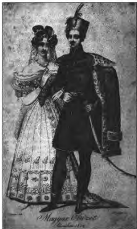
Vándza Mihály–Leinhardt Sámuel: Magyar öltözet Párizsban. Kostyál Ádám és Mindszenthly József terve után. Papír, könyvomat. Tudományos Gyűjtemény, 1829., 131–132.