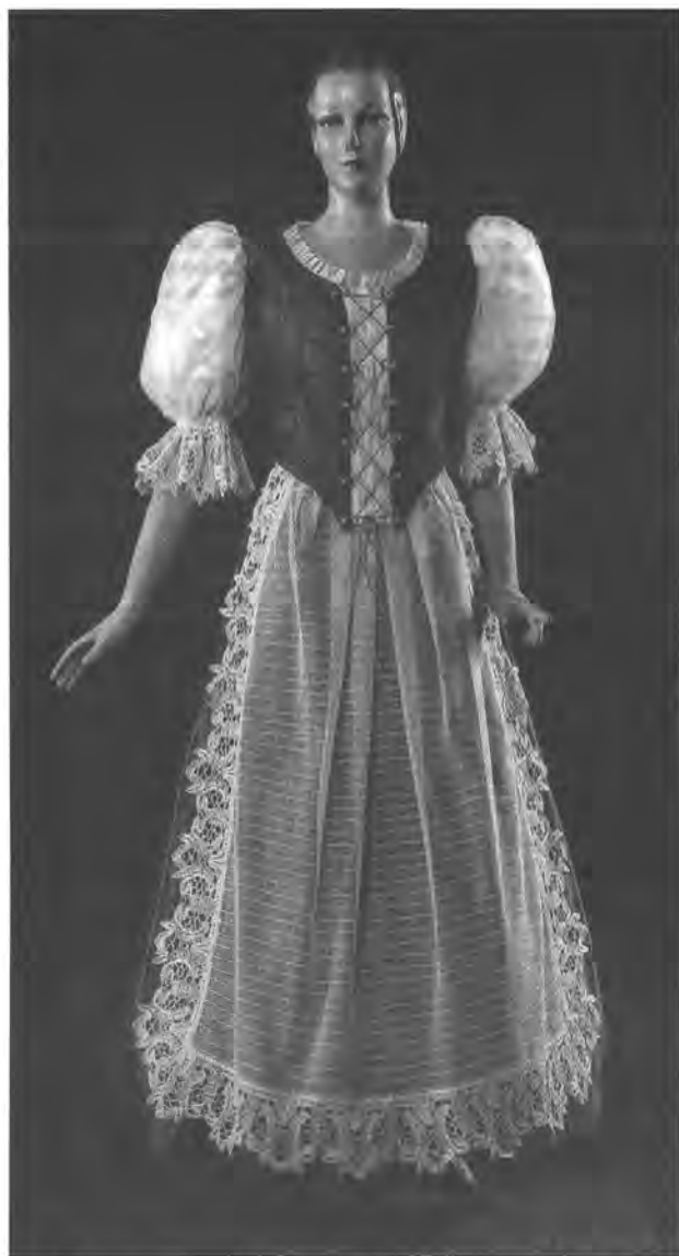
Tüdős Klára: Magyar női díszruha, a Corvin Áruház 1939-es kínálatából.

BTM Kiscelli Múzeum, Textilgyűjtemény, ltsz.: T.1995. 9.1. 1–3.