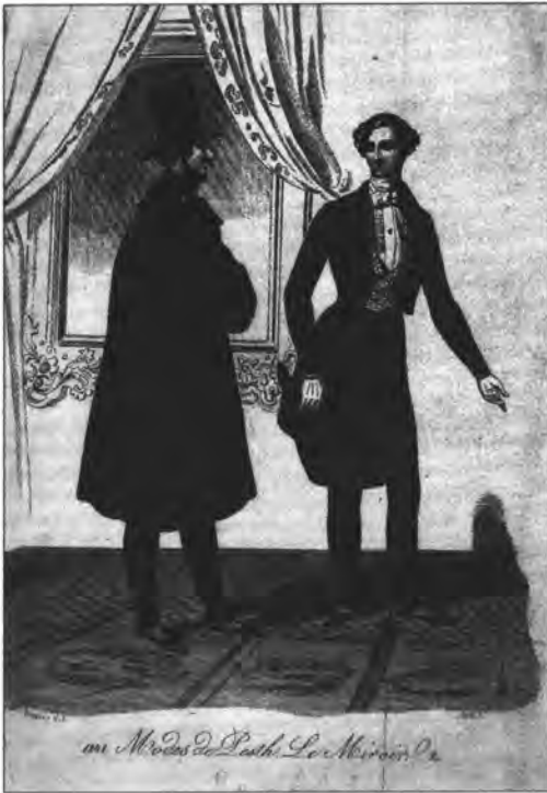
Barabás Miklós: Divatkép. Papír, színezett könyvomat, Der Spiegel , 1841., 2.