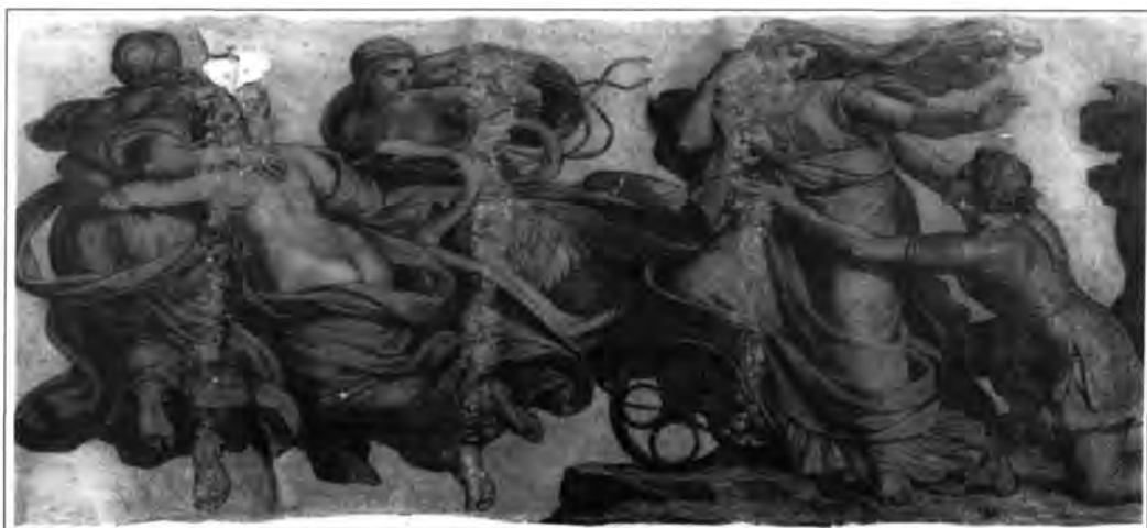
Lotz Károly: Tündér Ilona elhagyja Argirust, 1865. Karton a Vigadó díszlépcsőházának falfestményeihez. Karton, szén, 121x298 cm., j. n. MNG Grafikai Osztály 3547