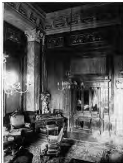
2.2.28. d. Ádám Károly palotájának szalonja, falképekkel és ornamensekkel, (részlet) 1876

nése a biedermeier kisszerűségéhez szokott Pest-Budán elementáris erővel hatott. A kortársak számára az Európa-szerte elfogadott esztétikai normák szerint a falkép a legmagasabb rangú képzőművészeti műfaj, a tudományok által is támogatott akadémizmus csúcsteljesítménye. Tekintélyét többek között az adja, hogy minden más művészeti médiumnál közéletibb, mivel a művek valóban a „köz”-nek készülnek, nem múzeumok zárt falai őrzik őket. Hisz múzeumba csak az megy, aki már eleve érdeklődik a műtárgyak iránt, de színházba, pályaudvarra, városházára, iskolákba, templomokba stb. mindenki jár, és akaratlanul is szembesül a kompozíciókkal. Így ezek az alkotások nagy hatással tárják a széles nyilvánosság – a polgárosodó közönség – elé az állami megrendelő üzeneteit, s közvetítik a hivatalos ideológiát, ízlésvilágot, eszményeket és morált, de kétségtelen, hogy magát a „művészetet” is. Az állami mecenatúra figyelmét mindez igen hamar a műfajra terelte, és egyre növekvő arányban vették igénybe reprezentációs és propagandisztikus lehetőségeit.