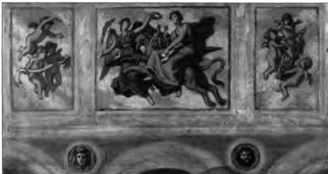
3.5.57. Than Mór: A Művészet megdicsőülése, 1882–83. Az Operaház díszlépcsőházának mennyezetéhez készült vázlat

zata (1894–1906). Mindenütt a magyar történelem képeivel reprezentálnak, a Mátyás-templom folytatja a Bakáts téri templomban megkezdett utat, falain a kor szelleméből fakadóan egyre jobban összemosódik a szakrális és a világi tartalom. A szentkép funkciót is felvállaló történelmi tablókön előszeretettel ábrázolják a magyar történelem európai kapcsolatokra utaló jeleneteit.