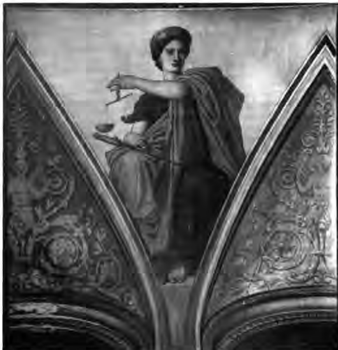
Lotz Károly: A Jog, 1875 k.

peket kísérő modern tartalmú allegóriák, amelyek a gőzenergiát, a távírdát, az újságírást, a fényképészetet stb. jelképezik. Az allegóriák ambivalens világa a kor különös művészi eszköze. Évezredek jelképek kelnek életre a legmodernebb tartalmak kifejezésekor, az ismeretlent a konvencionális művészi nyelv alkalmazása által teszik ismertté. A kor embere úgy érzi, az allegorikus megjelenítés által valamiféle emelkedettséget kölcsönöz az eddig sohasem létezett új fogalmaknak. Ezáltal az idő folyamatát véli megragadni és egész Európa múltját és jelenét egységbe fogni. Az antik allegóriák felelevenítésével, modern nagyvárosi tartalommal való megtöltésével – az új és új allegóriák képzésének ókori gyakorlatát felújítva – a világtörténelem folyamatosságát szeret-