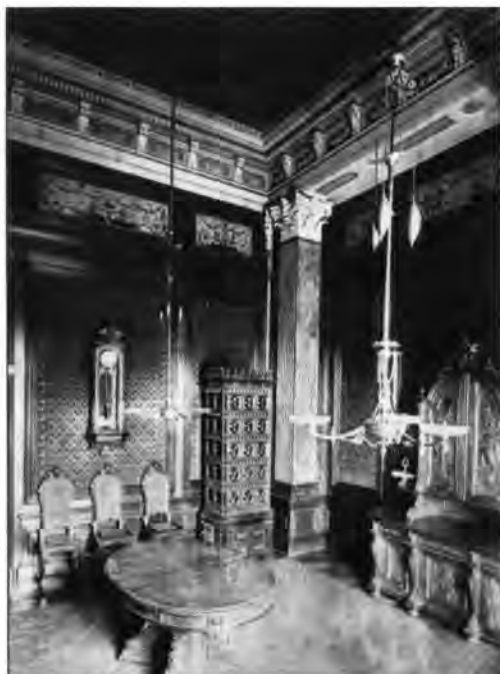
2.2.28. c. Ádám Károly palotájának szalonja, falképekkel és ornamensekkel, (részlet) 1876