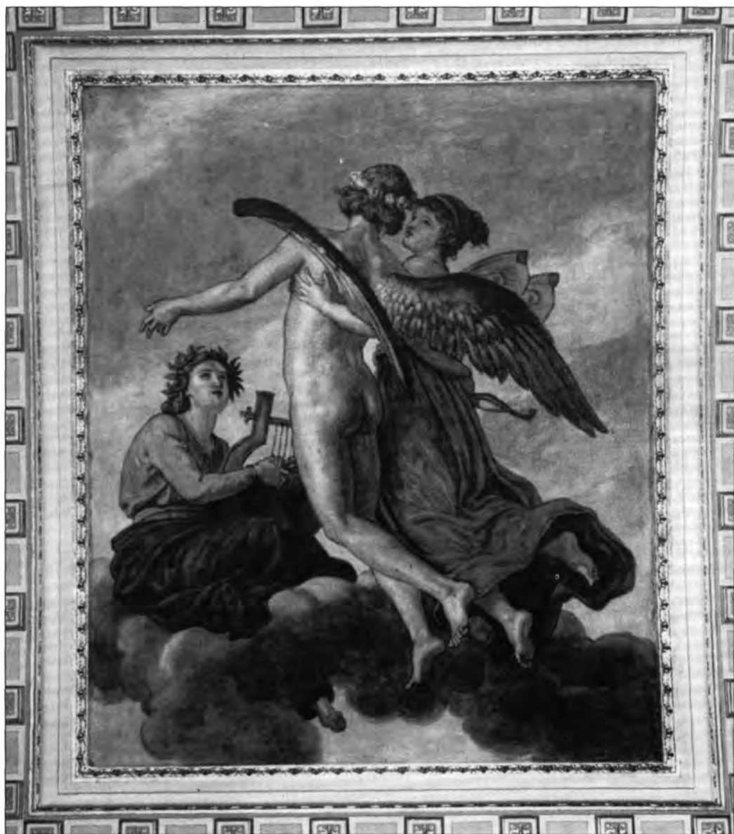
Than Mór: Erosz és Pszühé ihleti a Költészetet, 1884. Falkép az Operaház királyi fogadótermének falán

A figurális kompozíciókat gazdagon kísérő absztrakt díszítés kezdetben az összeurópai formakincs ékítményeit alkalmazza. A reneszánsz groteszkek az ókor vizuális asszociációit, fantáziavilágát közvetítik. Az összefonódó emberi, növényi és állati formák egyre bonyolultabb és fantasztikusabb szövevényeket alkotnak. Erre ellenhatásképp szaporodik a hideg, józan arabeszk, ami csak forma, már semmit nem ábrázol. Az ornamentika a korszak egyik központi problémája, de virágzása végül nem vezet sehová, fő törekvései elhalnak. Ám Scholtz műhelye gyakran kísérletezik magyar népi motívumok felhasználásával, és csírájában megjelenik az a növényidíszítmény-