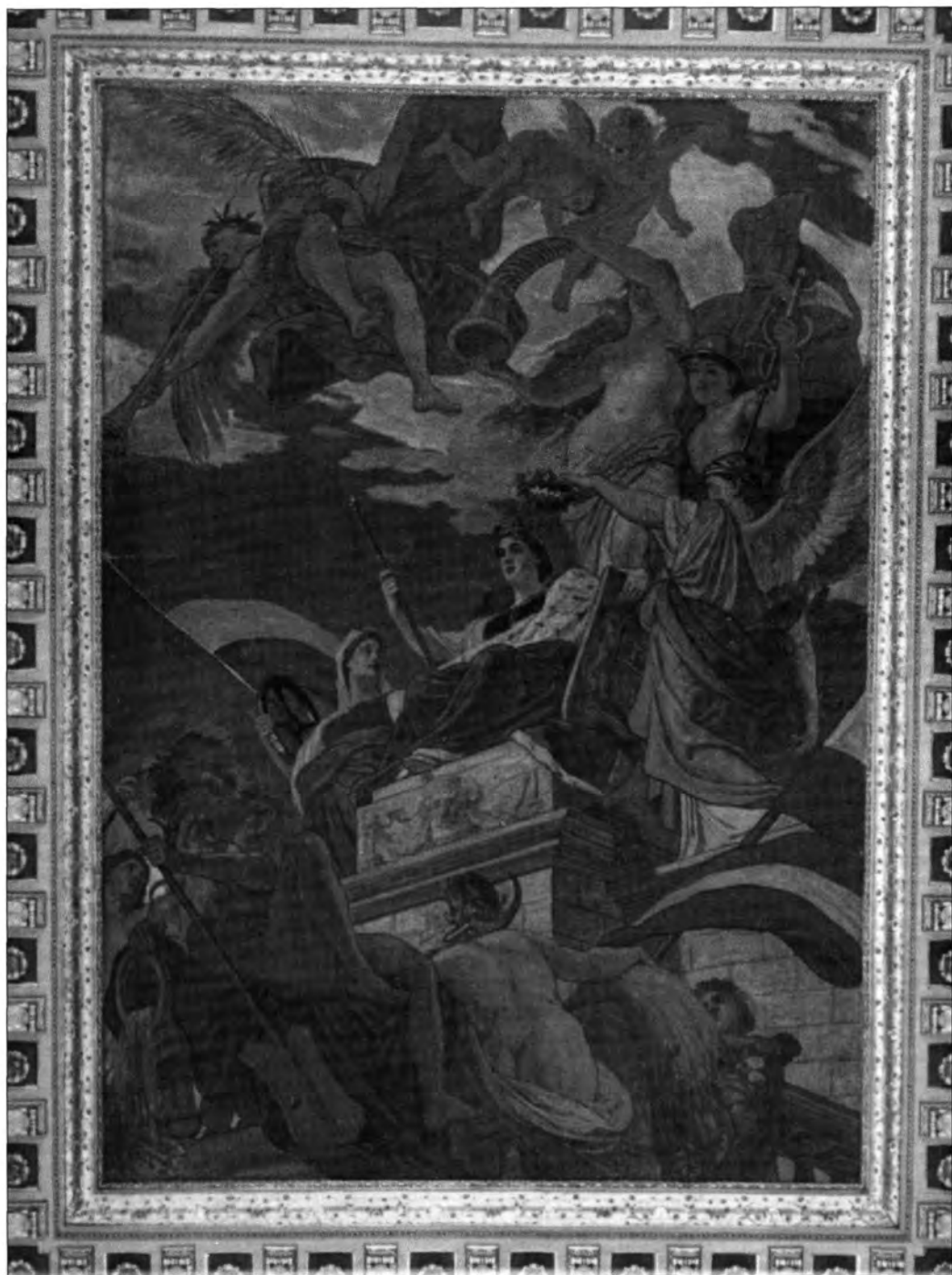
Lotz Károly: Budapest apoteózisa. Falkép a volt Terézvárosi Kaszinó (ma Divatcsarnok) falán