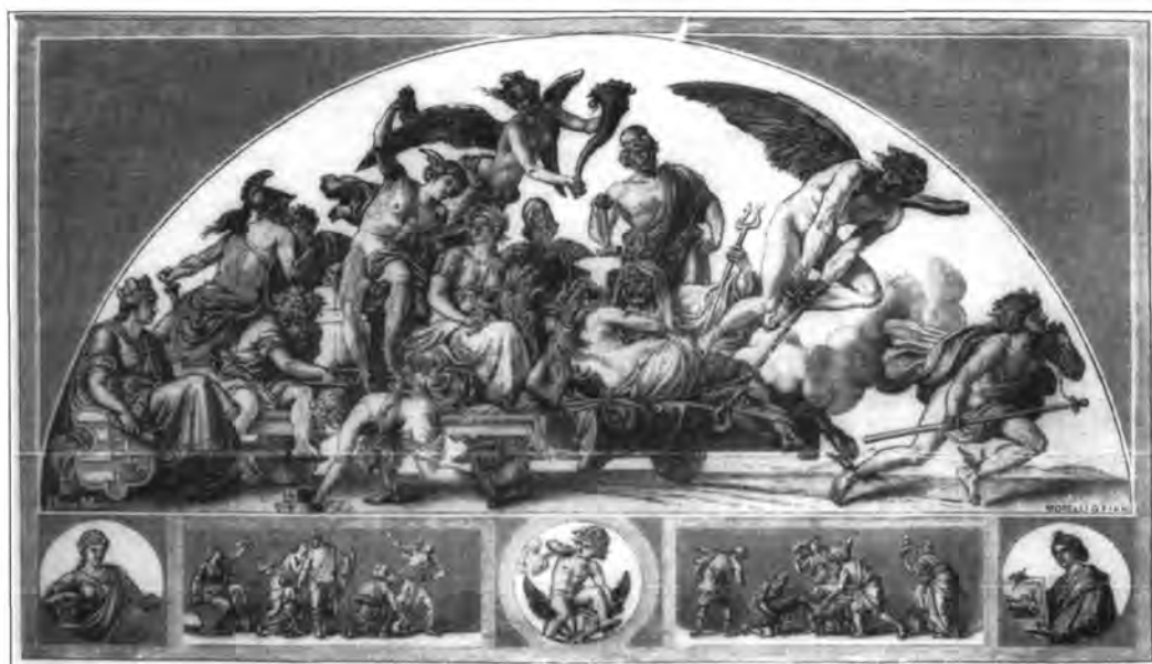
Than Mór: A Közlekedés allegóriája, 1883. A magyar Királyi Államvasutak Indóházának (Keleti Pályaudvar) előcsarnokában levő falképről készült fametszet. Vasárnapi Újság, 1899. 188.