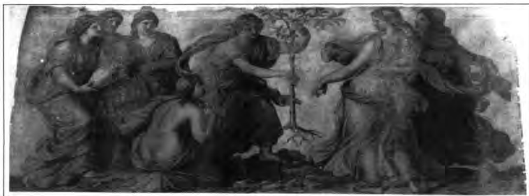
Lotz Károly: Tündér Ilona elülteti az aranyalmafát, 1865. Karton a Vigadó lépcsőházának falfestményeihez. Karton, szén, 122x240 cm, j. n. MNG Grafikai Osztály 3543.

E nagyszabású indíttatás után készült el a műfaj hazai történetének kiemelkedő együttese a Magyar Nemzeti Múzeum évek óta üresen álló falaira (1873–76). A múzeumi díszlépcsőházat ékesítő képsorozat a magyar történelemből meríti tárgyát, és a múzeum funkciójával összefüggés-