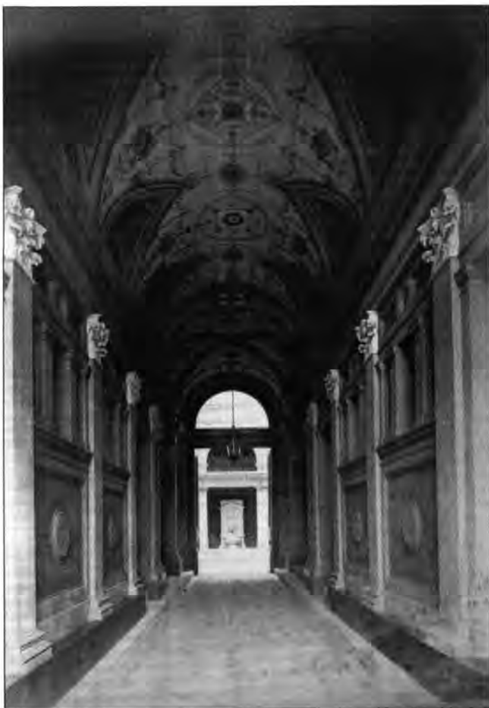
2.2.28. b. Ádám Károly palotájának bejárati folyosója, Scholtz Róbert díszítőfestésével, 1876

A tárgyunkat képező falképfestés műfaja elsősorban középületek díszítésére szolgál. A mind tartalmi, mind formai vonatkozásban nagyszabású akadémizmus hirtelen, robbanásszerű megjele-