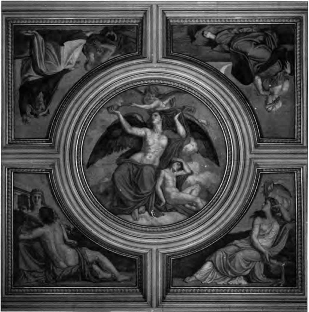
Lotz Károly: A Nemzeti Múzeum díszlépcsőházának mennyezetképe, 1874.

A legendáris jelenetek mellett – vagy azok helyében – sorozatban lépnek színre a figurális ké-