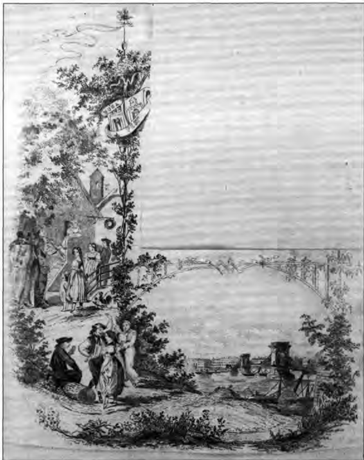
1. kép. Ismeretlen mester: Levélpapír-keretelés, litográfia, 1870-es évek

Az azóta eltelt idő is mindinkább táblaképszeret osztott a valaha alkalminak szánt lapoknak. Bizonyos okmányfajtákat – például diplomákat, kitüntetőlapokat, emléklapokat, okleveleket – már kibocsátásuk pillanatában keretezendő, falra akasztandó képnek szántak, más nyomtatvá-