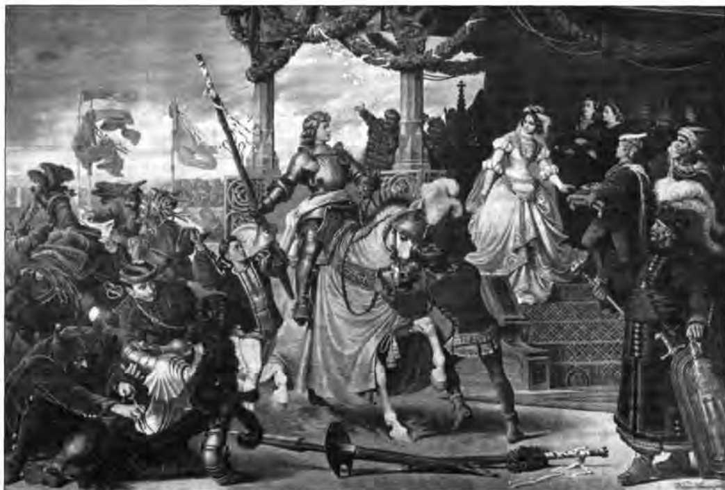
Wagner Sándor: (18..18..): Mátyás győzelme Holubár felett. A Vigadó csemegetárának elpusztult falképe, 1865.

ben művelődéstörténeti fogantatású. A kifestés programja a magyar művészetben újdonság, filozofikus felfogású eszmei konstrukció. A kor vezéreszméjét absztrakt allegóriák és konkrét történelmi jelenetek által, bonyolult rendszerbe építve, ikonológiai összefüggések sorozatán keresztül fejezi ki. A képek ismét Európának szánt üzenetet közvetítenek: a magyarság Ázsiából való kiözönlése óta, a nemesség vezetésével, a kereszténység felvétele által szakadatlanul civilizálódik.