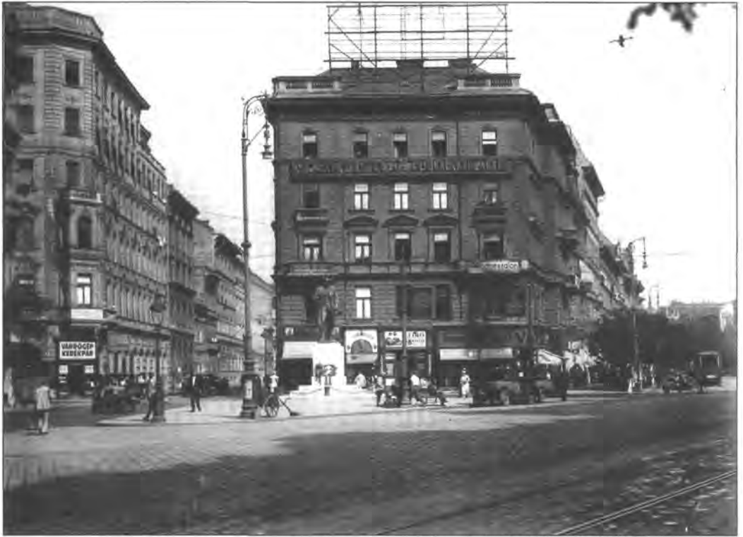
5. kép. Rákosi Jenő szobra az Erzsébet körúton, 1930-as évek

példaképektől merőben idegenül, mégis ezen a helyszínen, a Nagykörút és a Kerepesi (Rákóczi) út találkozásánál kézenfekvőnek nevezhető módon született meg a magyar bulvársajtó. A Budapesti Hírlap kiadóhivatali vállalkozásaként indult meg 1896-ban az Esti Ujság , az első utcai árusításra szánt, csakis rikkancsokkal terjesztett olcsó hírlap.