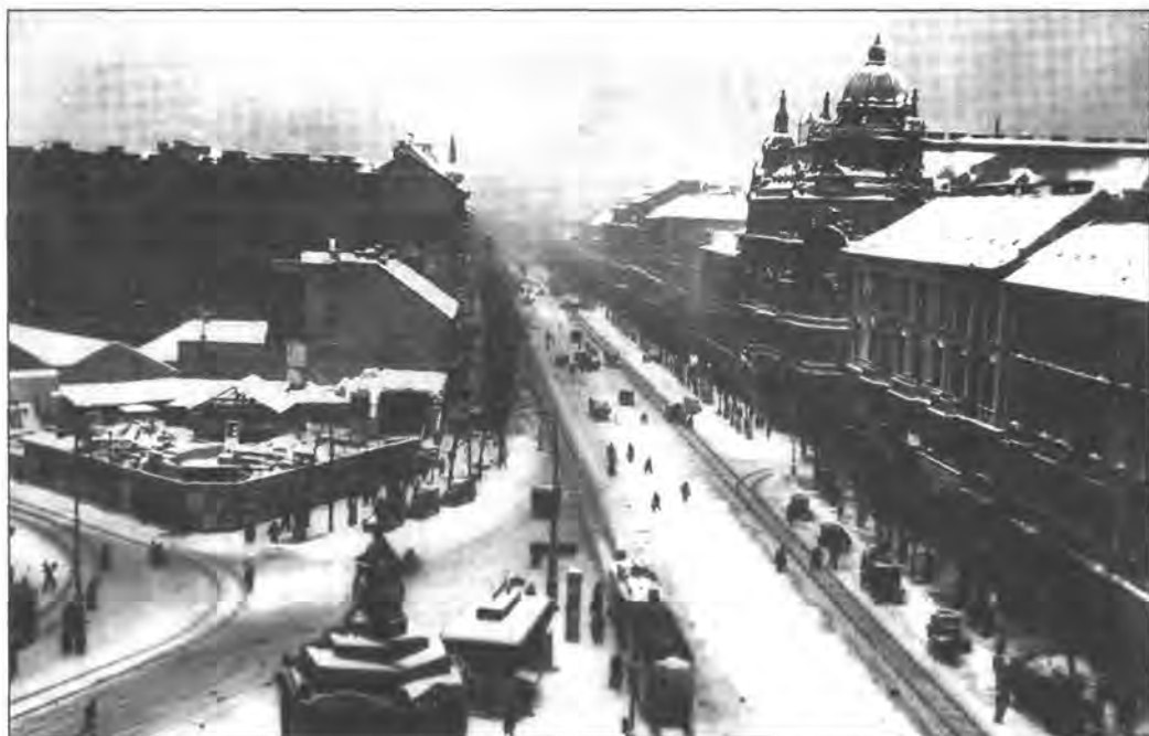
3. kép. A Vilmos császár (mai Bajcsy-Zsilinszky) út a Nyugati tér felől; jobbra kimagaslik a Pesti Hírlap újságpalotája (1937. januári felvétel,)