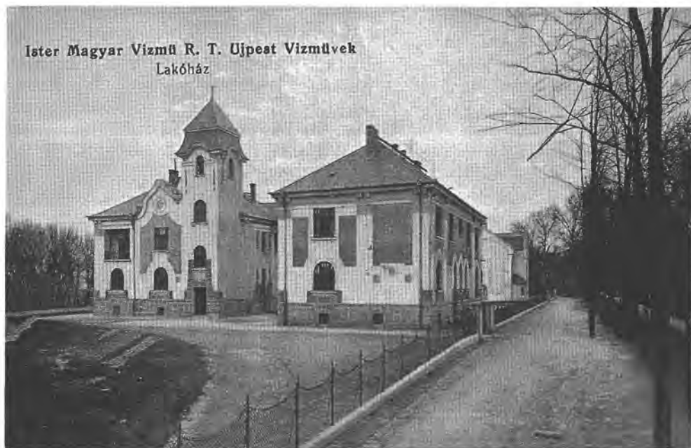
A belga alapítású Ister Magyar Vízmu R. T. újpesti lakótelepe az 1920-as években

Nagytétény növekedése mérsékeltebb, fejlődése „szerveesebb” volt, a foglalkozási szerkezetük azonban egyértelműen urbánus.