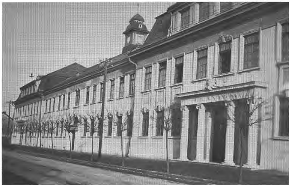
A volt Községi gr. Klebelsberg Kunó Polgári Leányiskola épülete Rákospalotán

vekedési üteme meghaladta Budapestét, mind a népességyarapodás, mind a gazdaság fejlődése terén.