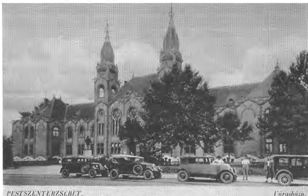
A Városháza Pesterzsébeten Képeslap, 1920-as évek

számlálás adatközlése már használta Nagy-Budapest fogalmát (a később Budapest-hez csatolt községek közül Soroksár nem szerepelt a statisztikai hivatal listáján, ott található viszont Alag). 1937-ben a Fővárosi Közmunkák Tanácsának hatáskörét 22 Budapest-környéki településre terjesztették ki (Újpest, Rákospalota, Pestszent-erzsébet, Pestszentlőrinc, Kispest, Budafok városok, valamint Alag, Pestújhely, Rákosszentmihály, Sashalom, Cinkota, Mátyásföld, Rákoscsaba, Rákosliget, Rákoskeresztúr, Rákoshegy, Csepel, Nagytétény, Budatétény, Albertfalva, Pesthidegkút, Békásmegyér); ez az övezet szerepelt egyébként a Közmunkatanács Nagy-Budapest-re vonatkozó elképzeléseiben is. 1942-ben a főváros részletes tanulmányt készített Nagy-Budapest kialakításának lehetőségeiről. Nemcsak Budapest kísérletezett városegysítéssel; az elővárosok körében is felmerültek különböző „integrációs” elképzelések; pl. Újpest Rákospalotával és Pestújhellyel közösen törvényhatósági jogú város kialakítására tett kísérletet; Kispest Pestszentlőrinc cel tervezett fűziót; Pest megye Pest-környék zavaros középfokú igazgatását reformálandó kívánta létrehozni Rákosszentmihályból, Sashalomból, Mátyásföldből és Cinkotából Pestújvárost . E tö-