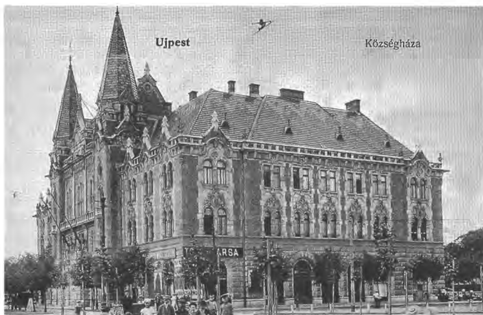
Az újpesti község-, majd városháza 1907-ben

lóhoz jutott; a korábbi agrárfalu kezdetben a fővárosi piacokra való termelésből gyarapodott, majd a kézművesek száma nőtt meg, aztán Újpest műhelyeibe, majd Pest gyáraiba jártak dolgozni a palotaiak, idetelepült a MÁV egyik járműjavítója, az elővárosi közlekedés kiépülte után alkalmazottak, tisztviselők, nyugdíjasok, vasutasok költöztek a községbe, amely kertvárosi jelleget öltött; területéből kivált a járműjavító körül kialakult telep, Pestújhely . Már a századfordulón az ipar-forgalmi keresők voltak többségben; az 1870-ben 3 ezres lélekszámú község lakóinak száma 1910-re (a belőle kivált Pestújhellyel együtt) 30 ezerre nőtt. Jóval később érte el az „urbanizáció” Csepelt ; a falut szigetbéli fekvése elszigetelte Pesttől (közvetlen összeköttetése csak 1912-ben teremtődött meg). A községbe települt gyáróriás – a Weiss Manfréd Művek – munkáslétszámának példátlanul gyors növekedése (1900: 915 alkalmazott, 1913: 5000 munkás, az első világháború éveiben kb. 30 ezer (!) munkavállaló) nyomán hatalmas tömeg indult a községbe; a sok ezer betelepülő nem is jutott lakáshoz; albérlőként, hevenyészve felépített barakkokban, viskókban éltek a gyár körül. A falu őslakossága a beáramló tömeg ellátásával foglalkozott: szállásadókká, kereskedőkké, kocsmárosokká váltak. A keresők háromnegyede ipari munkás volt. Budafok és