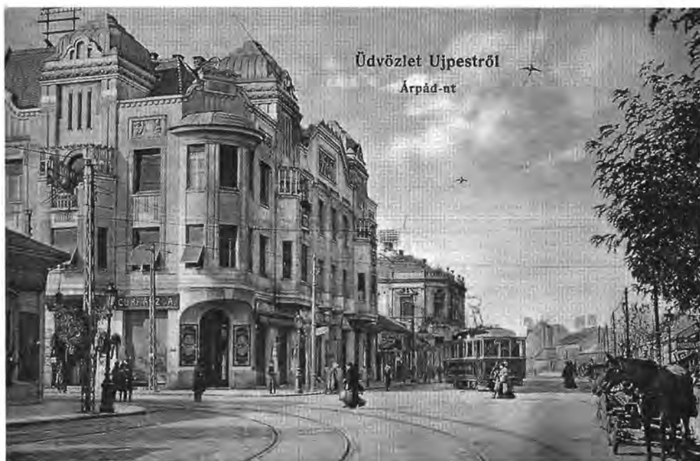
Újpest, az Árpád út és az István út sarka az 1910-es években FSZEK Budapest Gyűjtemény

Rákoshegy) – továbbra is bizonyos „rezisztenciát” mutatott a fővárosi hatásokkal szemben; Rákosszabab, Rákosszentmihály népességgyarapodása továbbra is mérsékelt.