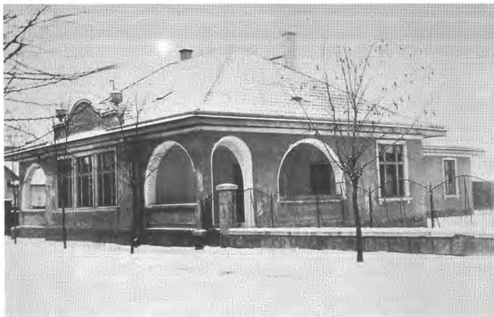
A volt Állami Kisdedővő épülete Rákospalotán, a Madách téren BTM Kiscelli Múzeum Fényképtár

Budapest helyzete felemásan alakult: nemzetközi presztízse csökkent; gazdasági háttérének összezsugorítása erőteljesen fékezte gazdaságának növekedését; egyes iparágak (főleg az élelmiszeripari üzemek) kapacitása kihasználatlanul állt, a közintézmény-építkezés szinte teljesen szünetelt. Budapest lakosságszámának gyarapodása lelassult (1930-ra érte el az 1 milliót), az elővárosoké töretlenül folytatódott.