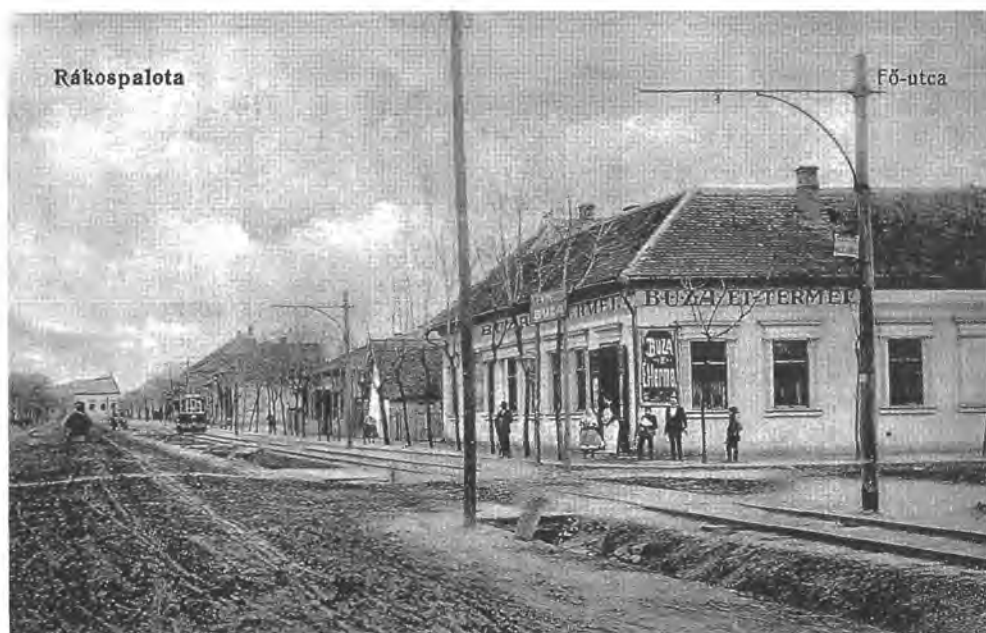
A rákospalotai Fő utca a Búza-féle vendéglővel, 1916

A társadalmi szerkezet következményei sokrétűek: a középosztály igényeit kielégítő intézmények, pl. a középiskolák későn és kis számban alakultak ki, a kereskedelem évtizedeken át a kis jövedelműek igényéhez alkalmazkodó szatócskereskedelem maradt. A századforduló után a községek – később városok – vezetésében a baloldali politikai erők, mindenekelőtt a szociáldemokraták jelentős szerepet kaptak. A társadalmat, a településeket az ideiglenesség, az állandó változás, a zsúfoltság, a rohamosan növekvő lakosság szükségleteit soha utol nem érő ellátás-szolgáltatás és infrastruktúra jellemezte; burkolatlan utcák, sártenger, a csatorna és vízvezeték hiánya, gyér közvilágítás és így tovább.