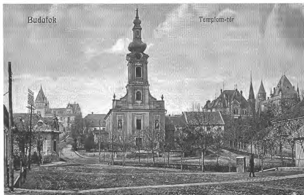
A budafoki Templom tér (ma Savoyai Jenő tér és Szent István tér) az 1910-es években FSZEK Budapest Gyűjtemény

Kispest keresőinek fele Budapesten dolgozott.) Egyre nagyobb arányúvá vált a keresztingázás is (pl. Rákospalotáról Újpestre, Erzsébetfalváról Csepelre).