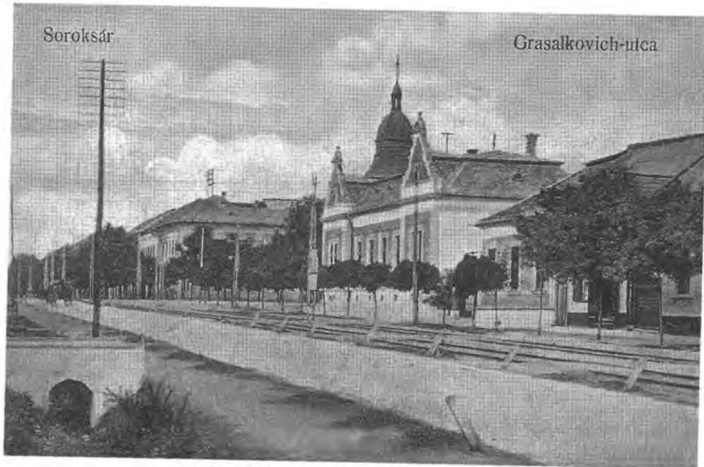
Soroksár község főutcája, a Grassalkovich utca

Csepel keresőinek 75%-át már az ipar foglalkoztatta. Végül Budafok élelmiszeripara érdemel említést a századforduló éveiben. Egyre több munkaalkalmat kínált a MÁV is a peremkerületekben élőknek, elsősorban a Rákos-mente falvainak.