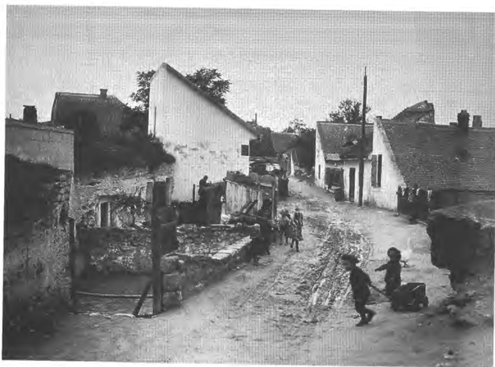
Utca Budafokon, 1920-as évek

alkalmazottak, sőt szabadfoglalkozásúak is (Rákos-mente, Békásmegyér, Pesthidegkút, Alag, Alsó- és Felsőgöd, Pestszentlőrinc). Más telepekre továbbra is a megtelepedés olcsósága vonzotta a lakókat (Pestszentimre, a csepeli Királyerdő, a Pacsirtatelep, Gyálliget stb.). E telepeken, községekben kiépítetlenek voltak a közművek, nem léteztek építési előírások, kicsiny, olcsó telkekhez is hozzá lehetett jutni. Új jelenség volt, hogy egyes régebbi elővárosokból, telepekről is sokan áthúzódtak az újonnan keletkező, olcsóbb telepekre. Az autóbuszközlekedés megjelenése nyomán a Budai-hegység községei – Pesthidegkút, Budakeszi, Budaörs, Solymár, Üröm stb. – is közelebb kerültek a fővároshoz; itt is megindult néhány színvonalas kertvárosi telep kialakulása (Budaliget, Máriaremete, Remetekertváros).