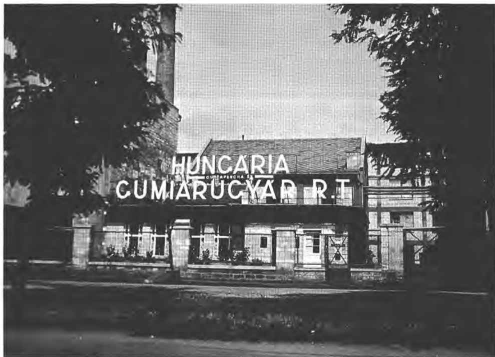
A Hungária Gumiárúgyár Rt. telepe Budafokon, 1940-es évek

meghaladta a 100 ezer főt, s az övezetben már több mint félmillióan éltek. Az ország népességgyarapodásából a későbbi Nagy-Budapest 40–41%-kal részesedett, ezen belül az elővárosi övezet 18%-kal. Az egyes peremtelepülések népességgyarapodásában természetesen továbbra is lényeges különbségek mutatkoztak; a két világháború között leggyorsabban néhány viszonylag fiatal telep – Sashalom, Rákoshegy –, az agglomerálódásba frissen bekapcsolódó település – Pestszentlőrinc, Békásmegyér, Pesthidegkút – gyarapította lakosai számát.