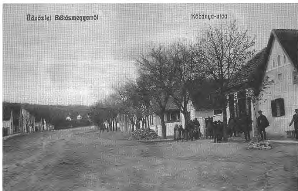
A Kőbánya utca Békásmegyeren az 1920-as évek elején

állandó volt az elmaradás az igényekhez képest, felemások voltak az eredmények (pl. a 400 ezer lakosú „övezetben” nem működött kórház, a dél-pesti elővárosi konglomerátumnak – Pesterzsébet, Csepel, Soroksár, Pestszentlőrinc – nem volt gimnáziuma stb.). Ennek ellenére már az első világháború előtt felvetődött Nagy-Budapest kialakításának gondolata, igénye; a kor neves várospolitikusai, Bárczy István és Harrer Ferenc már 1908-ban a „szomszédos községek” Budapesthez való csatolásáról értekeztek.