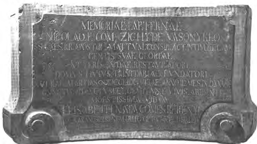
A megtalált talapzat

A fordítással 28 kapcsolatban sok fejtörést okozott, hogy milyen legyen a fordítás „technikája”. Véleményünk szerint ugyanis legalább kétféle fordítás lehetséges, azon túlmenően, hogy mindkét esetben magától értetődő követelmény az egyes szavak nyelvileg pontos fordítása. Az egyik változat az ún. tükörfordítás, amikor az eredeti szöveg és a fordítás minden sora, majdnem szó szerint fedi egymást. A másik változat nem törekszik teljes formai egyezésre, elsősorban a fordítás gördülékenysége, a szabatos magyar nyelvhasználat a fontos, ami másképpen tagol(hat)ja a szöveget.