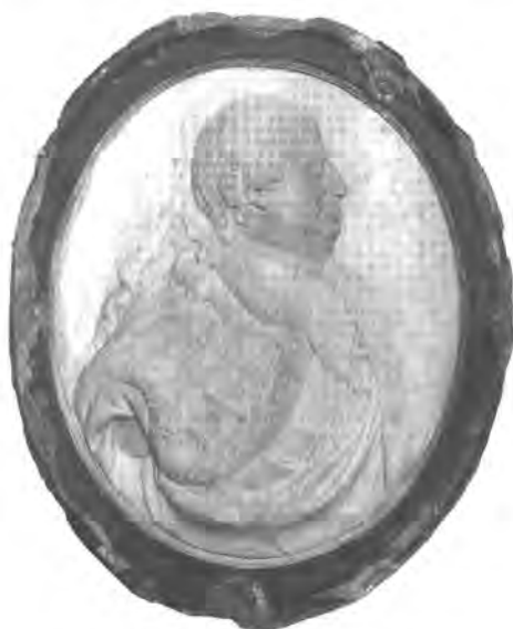
Zichy Miklós gróf dombormű mellképe, BTM ltsz. 20.305