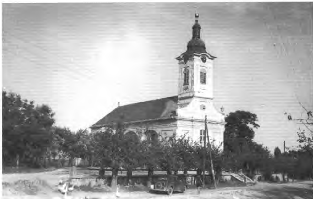
A rácalmási római katolikus templom, 1937