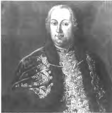
Zichy Miklós gróf, ism. művész, olaj, 1755–1758, BTM ltsz. 901