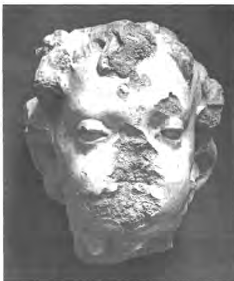
Sérült puttófej a halotti emlékműről, BTM ltsz. KM 87.4.8

Egyéni megítélés kérdése, hogy melyik a helyes (vagy helyesebb) eljárás, mi az elsőt választottuk, abból a megfontolásból, hogy itt nem irodalmi, hanem dokumentum értékű történeti szövegről van szó.