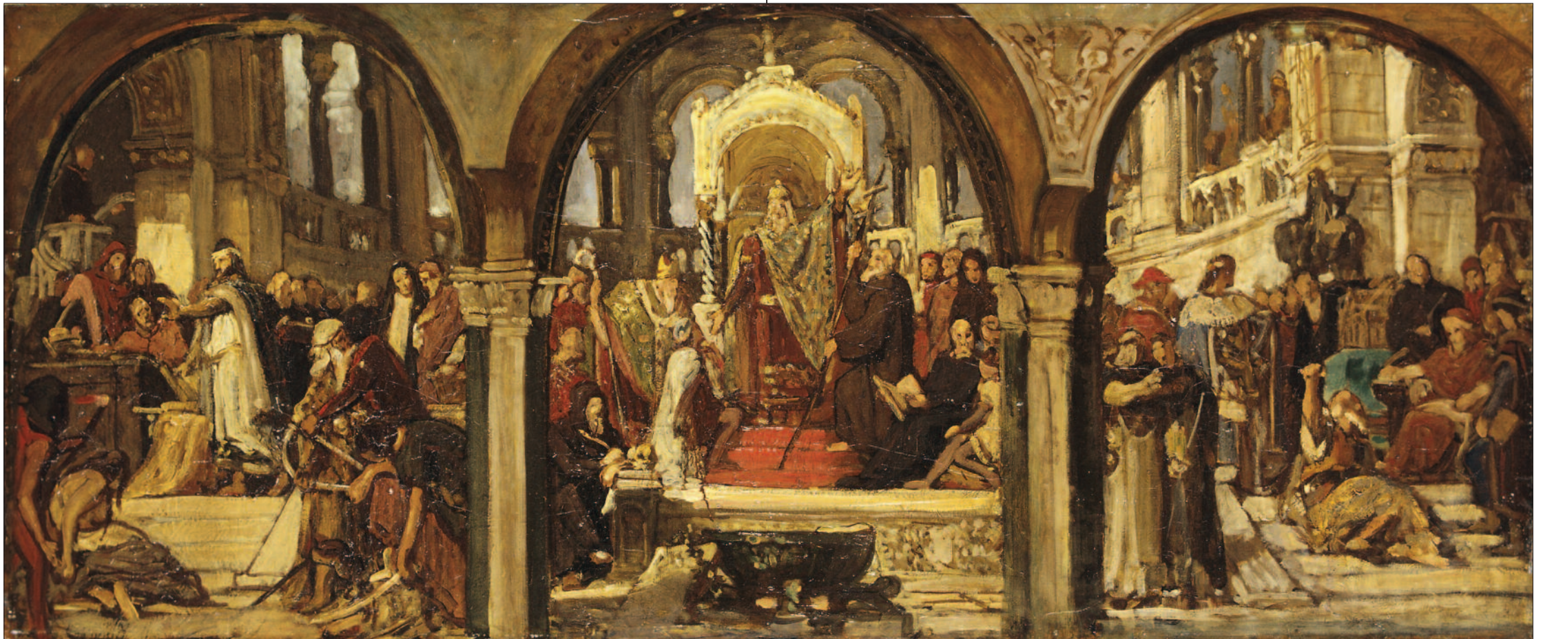
Lotz Károly: Vázlat a középkort ábrázoló hármasképhez. Papír, olaj. 127x271 cm, MNG lt. sz.: 3481

ló Iktinoszt, Apellészt és Pheidiaszt két oldalt az ókortól a 19. századig terjedő időszak mintegy hatvanhat leghíresebb művésze veszi körül. 90 Carl Rahlnek az Athéni Egyetem számára tervezett frízén a téma a tudományok fejlődése volt görög földön, így középen a tudományok perszifikációit trónja köré gyűjtő Ottó királyt két oldalt a görög kultúrtörténet legfontosabb alakjai veszik körül a mitikus időktől egészen a kereszténység megjelenéséig. 91 Nagyhatású példája volt az ábrázolási típusnak Wilhelm von Kaulbachnak a berlini Neues Museum lépcsőházába 1847 és 1865 között készített fríze, amely hat jelenetben (A Babel-torony lerombolása, Görögország virágzása, Jeruzsálem lerombolása Titus által, A hunok elleni csata, Bouillon Gottfried bevonulása Jeruzsálembe, A reformáció kora) mutatja be a világtörténelem nagy fordulópontjait – a ciklust kísérő allegóriák révén – a német nemzet történelmére való utalásokkal. A ciklus utolsó falképe A reformáció kora, ahol a központi alak – a német nyelvű Bibliában megtestesülő Igét magasba emelő Luther – körül csoportokba rendezve a különböző korok mintegy hetvenkét művésze, tudósa,