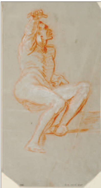
Lotz Károly: Vázlat a Néphagyomány alakjához Halványkék papíron vörös és fehér kréta. 290x140 mm, MNG Grafikai Osztály, lt. sz.: 1905–1226