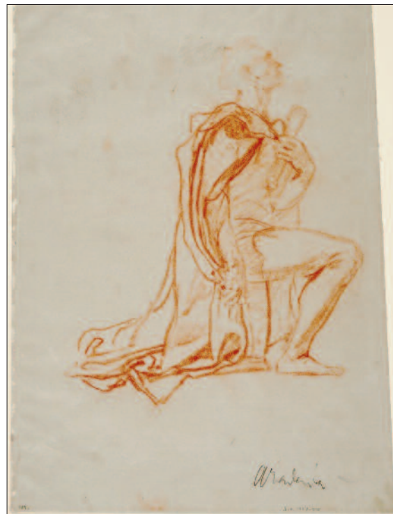
Lotz Károly: Szent Imre alakjához készült vázlat. Halványkék papíron vörös kréta. 338x250mm, MNG Grafikai Osztály, lt. sz.: 1905–1227

jük, a könyvtárpalcokon pedig takaros rendben, fektetve sorakoznak a könyvek úgy, ahogy a király híres könyvtárában őrizték őket egykor. Noha nincs arra egyértelmű bizonyíték, hogy Lotz mélyreható kutatásokat végzett volna a témával kapcsolatban, de a fenti példák azt mutatják, hogy legalábbis rugalmasan próbált alkalmazkodni a bizottság történeti hűséggel kapcsolatos elvárásaihoz. Az ábrázoltak között finom eszközökkel létesített kapcsolatot, így Gyöngyösi Istvánt csak tekintete kapcsolja össze úrnőjével, Széchy Máriával, Pázmány pedig elfordul a protestáns írótól. Az elkészült seccók döntően az Ipolyi-féle programon alapulnak, ugyanakkor Lotz egyéni koncepcióját is tükrözi. Nagyon fontos azonban hangsúlyozni, hogy ezt a koncepciót az erre kijelölt bizottság hagyta jóvá, és az is biztos, hogy a festő előzetesen konzultált valakivel, vagy valakikkel. Erre vonatkozóan azonban nem rendelkezünk adatokkal. Ez korántsem szokatlan jelenség a korszakban. Ha Lotz beszélt is Ipolyival az akadémiai falképekről, erre már nem sok ideje lehetett, hiszen a program alkotója 1886. december 2-án elhunyt.