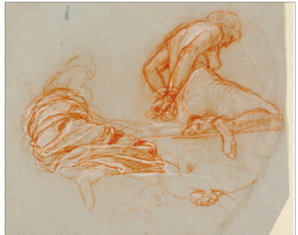
Lotz Károly: Tanulmányok a boszorkány alakjához.

A csoportosítás mint kompozíciós elv továbbá a 19. századi, úgynevezett lángelme-gyülekezeteken is feltűnik, melyek közé sorolhatjuk a Magyar Tudományos Akadémia falképeit is. Az ábrázolási típus érdekes példáját adják a Bonni Egyetem fakultásképei, melyekre Peter von Cornelius kapott megbízást az 1820-as években, de a század első felét teljesen igénybe vevő kivitelezést tanítványai végezték. A négy falképen a közepén trónoló női alakok testesítik meg a tudományágakat, mellettük két oldalt pedig a tudományág képviselői jelennek meg. Kortárs alakok nem szerepelnek közöttük. A perszonifikációkat az első három freskón géniuszok kísérik, akik feliratos táblákat tartva a fakultások két irányát jelölik. 89 Paul Delaroche 1837 és 41 között a párizsi École des Beaux-Arts díszterme számára festett félkörívén a közepén tróno-