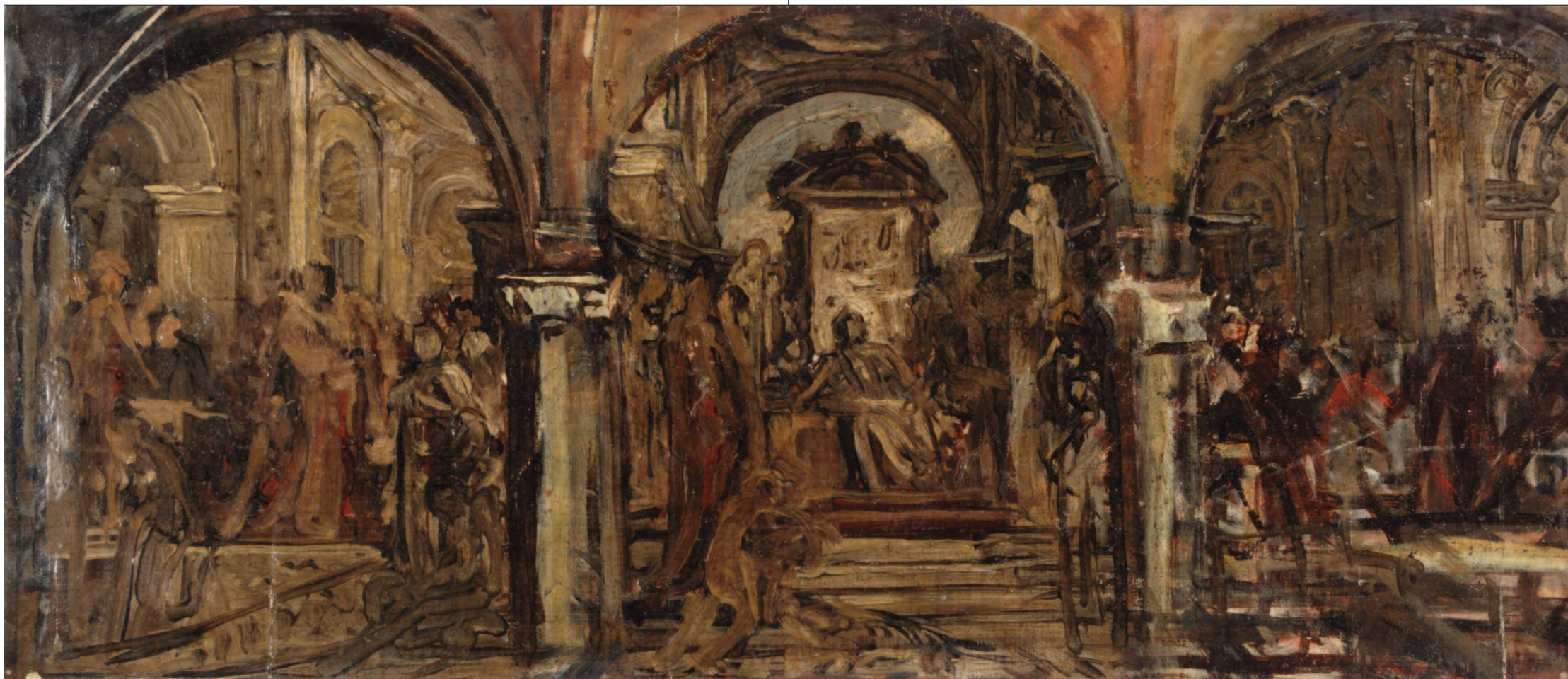
Lotz Károly: A reneszánsz és a reformáció korát ábrázoló triptichon vázlata. Vászon, olaj. 320x830 mm, MNG Grafikai Osztály, lt. sz.: 1905-388

Szenczi Molnár Albertet, Károli Gáspárt, Káldi Györgyöt, Apáczai Csere Jánost stb. A történetírók: Istvánffy Miklós, Verancsics Antal, Forgách Ferenc és az erdélyiek. A jogtudósok: Werbőczy István, Decsi János. A természettudósok: Beythe István, Méliusz Juhász Péter, stb. A költők: Rimay János, Zrínyi Miklós, Gyöngyösi Itván, stb.