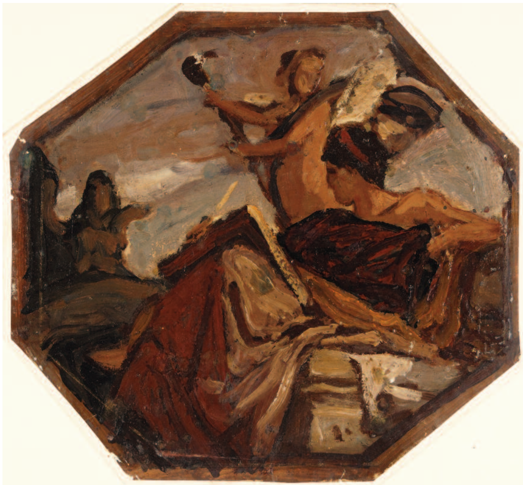
Lotz Károly: A Tudomány vázlata. Karton, olaj. 259x309 mm, MNG Grafikai Osztály, lt. sz.: 1905–360

„...hogy Munkácsy egyéb teendői miatt végül nem tudott eleget tenni a felkérésnek, ráadásul...” egy ecsetvonást sem tett az ügyben, Benczúr a témának olyan megfogalmazását nyújtotta, ami kevésbé lehetett vonzó a megbízó számára. A festményen ugyanis inkább az apa-fiú kapcsolatra helyeződik a hangsúly, és István megtört öregemberként, nem diadalmas, életerős királyként jelenik meg.