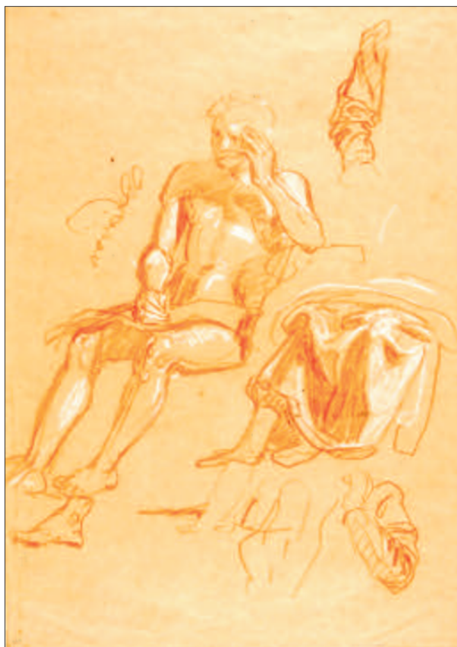
Vázlat Károlí Gáspár alakjához és drapéria tanulmányok. Barna papíron vörös és fehér kréta. 450x308 mm, MNG Grafikai Osztály, lt. sz.: 1905–1160

Az Igazgató Tanács elfogadta az új programot, és egy új, kilenctagú, harmadik bizottságot is kineveztek a munkálatok vezetésére. 19 A megvalósítás azonban tovább húzódott, mivel az adakozás terén a kezdeti lelkesedés hamar alábbhagyott, így nem sikerült elegendő pénzt összegyűjteni. 20 Csak 1881-ben elevenítették fel újra a díszterem kifestésének ügyét. Gr. Lónyay Menyhért akadémiai elnök ez év októberében egy új – sorrendben negyedik – bizottságot küldött ki a részletek kidolgozása céljából, 21 majd egy kimutatás is elkészült a rendelkezésre álló anyagi eszközökről. 22 Az új bizottság elfogadta az 1873-as programot, és Ipolyi Arnold tájékoztatta a bizottsági tagokat arról, hogy Munkácsy Mihályt, Liezen-Mayer Sándort és Benczúr Gyulát