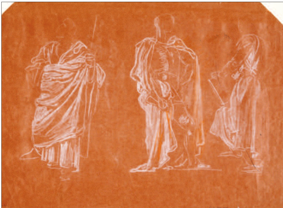
Lotz Károly: Nagy Lajos alakjához készült vázlatok. Barna papíron fehér kréta. 306x438 mm, MNG Grafikai Osztály, lt. sz.: 1905–799

tiszteletdíjért elvállalta a megbízást. Így nem tekinthetjük megalapozottnak Divald azon kijelentését, hogy a mezőket Lotz ingyen festette ki, 45 viszont igazolhatjuk Széphelyi sejtését, miszerint a festő nem egyedül dolgozta ki ezeknek a mezőknek a programját, hanem ezt is meghatározták számára. 46 A díszítőfestési munkálatok 1888 áprilisára befejeződtek, 47 így az Akadémia az 1888. május 6-i közülest már ebben a reprezentatív térben tarthatta meg.