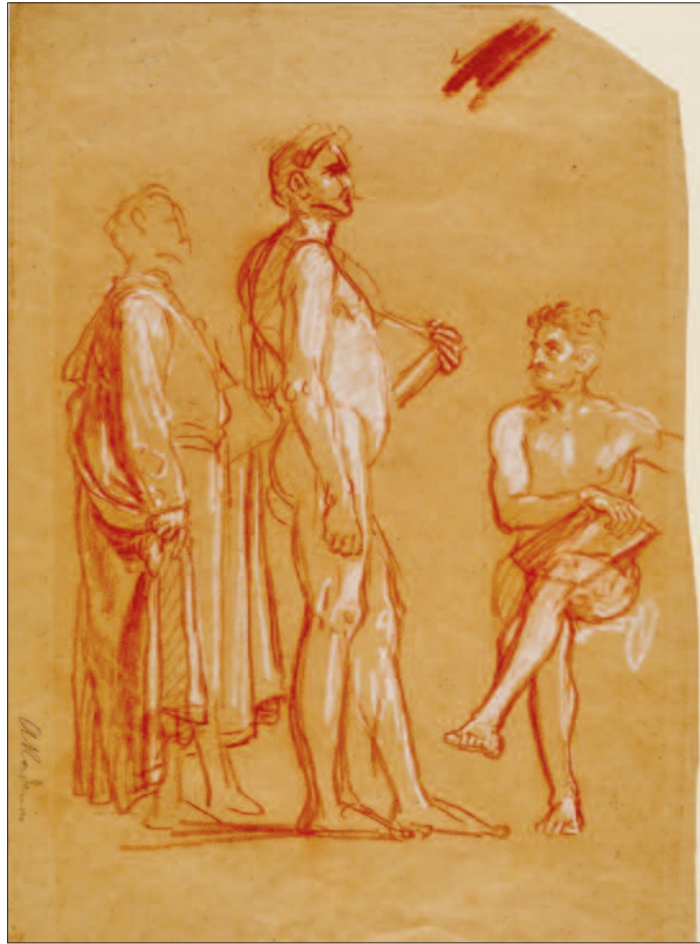
Lotz Károly: Werbőczy István és Forgách Ferenc.

Barna papíron vörös és fehér kréta. 453x315 mm, MNG Grafikai Osztály, lt. sz.: 1905-1333