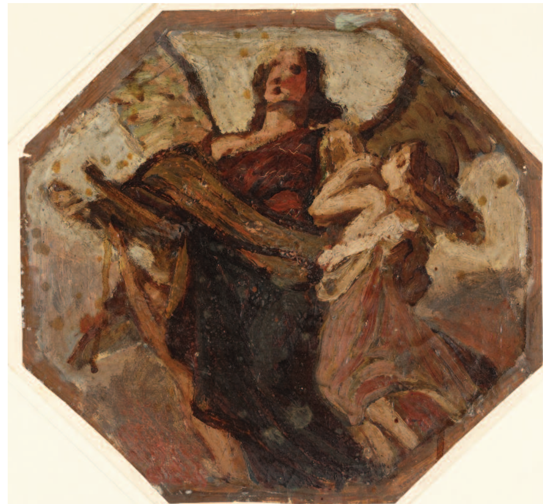
Lotz Károly: A Költészet vázlata. Karton, olaj. 255x295 mm, MNG Grafikai Osztály, lt. sz.: 1905–359

Ezen a ponton érdemes utalni arra, hogy az Ipolyi-féle program elfogadása valószínűleg nem ment zökkenőmentesen. Már 1881-ben, sőt feltehetően később is felmerülhettek más ötletek. Ezt igazolja, hogy a Vasárnapi Ujság 1883-ban arról ír, hogy Benczúr Gyula a díszterem mennyezetét festi majd ki, ahol a közepén elhelyezkedő Prométheusz alakját 28 a Költészet és a Tudomány allegóriái kísérik majd, körben a mennyezet szegélyein pedig a leláncolt természeti nyers erő allegóriái lesznek láthatók. 29 Az akadémiai iratokban és az Akadémiai Értesítő ben nyomát sem találjuk ilyen terv létezésének, de ha volt is ilyen elképzelés, azt elvetették, feltehetően az