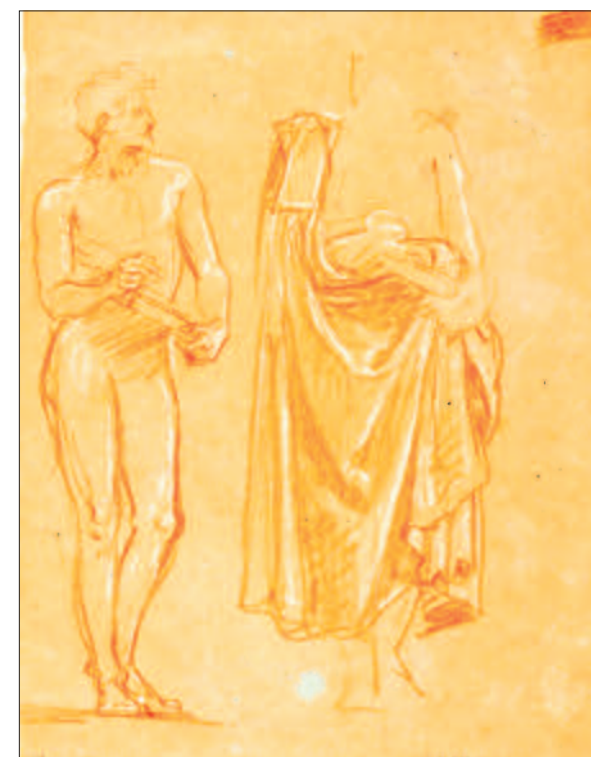
Lotz Károly: Gyöngyösi István alakjához készült vázlatok. Barna papíron vörös és fehér kréta. 312x237 mm, MNG Grafikai Osztály, lt. sz.: 1905–1225

Ha a kész falképeket összevetjük az Ipolyi-féle programmal, akkor megállapíthatjuk, hogy Lotz nem követte az abban meghatározott időrendet, a szereplők nem egymást követve, hanem István és Mátyás mint centrumok körül rendeződnek el. Az újkort nem egy, hanem két falképen jelenítette meg a művész, és e részleteken ismét centrumokat képezett. Pázmány Péter köré csoportosította a korszak jelentős katolikus egyházi személyiségeit és történetíróit, illetve Bethlen Gábor protestáns írói körét, míg Zrínyi Miklóst elsősorban újkori költők és néhány író veszi körül. Látva azt, hogy a program egyes korszakokhoz több, másokhoz kevesebb személyt sorol fel, átcsoportosította a mellékalakokat, így gyakran egymáshoz képest 150–200 évvel előbb vagy később élt személyek kerültek egymás mellé. 56 Kiválasztásukkor a művész ragaszkodott a programhoz, de a kompozíciós egyensúly és az egyes korszakok hangulatának minél tökéletesebb jellemzése érdekében beiktatott más alakokat is. 57 A mellékszereplők többségénél karakterfejekről van szó, de a főalakok esetében – ahol lehetett – a festő törekedett történelmileg hiteles fiziognómia kialakítására. Zrínyi Miklósnak például a fennmaradt vázlat tanúsága szerint eredetileg szokatlan, képzelet szülte vonásokat készített, 58 de a kész falképen már a jól ismert Zrínyi-arcot láthatjuk. Mátyás és Pázmány esetében is szembevetendő az ismert arcképek alkalmazása, továbbá Mátyás mögött az Erdődy-féle trónkárpit pontos másolatát lát-