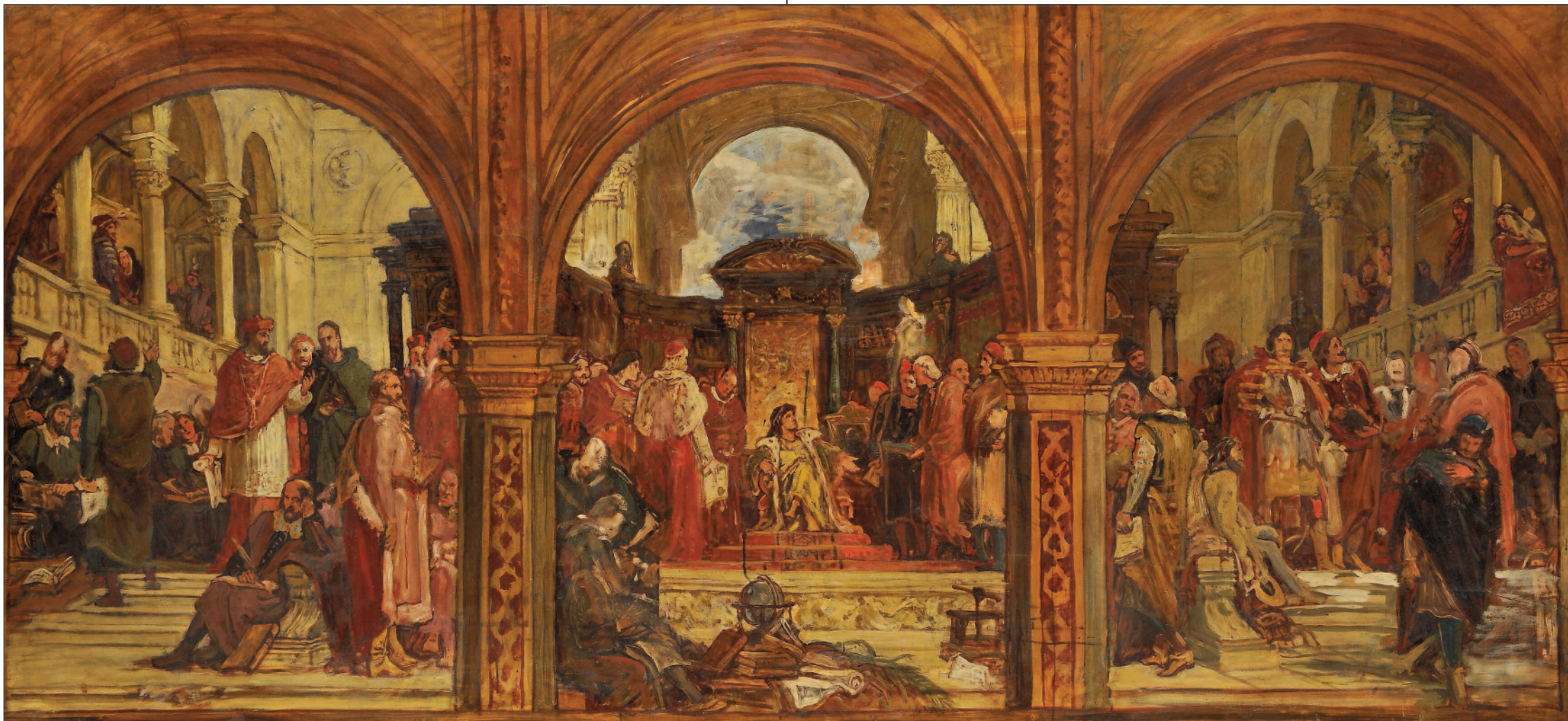
Lotz Károly: Vázlat a reneszánsz és a reformáció korát ábrázoló hármasképhez.

Papír vászonra húzva, olaj. 66,5x162 cm, MNG lt. sz.: 3480