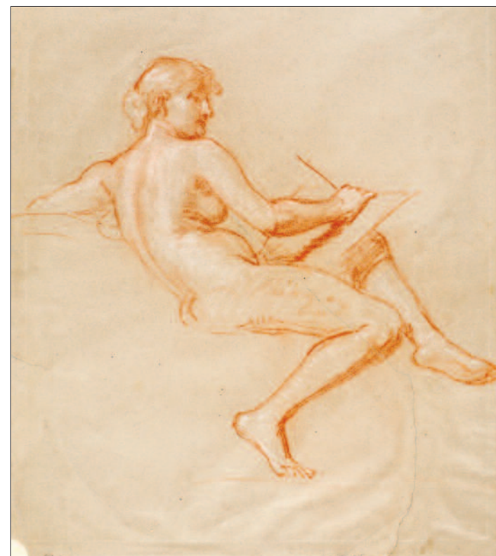
Lotz Károly: A Természettudomány alakjához készült vázlat. Szürke papíron vörös és fehér kréta. 417x359 mm, MNG Grafikai Osztály, lt. sz.: 1905–785