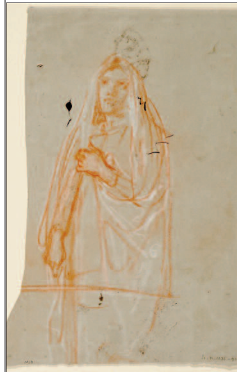
Lotz Károly: Vázlat Szent Margit alakjához. Halványkék papíron vörös és fehér kréta. 235x180 mm, MNG Grafikai Osztály, lt. sz.: 1905–1275