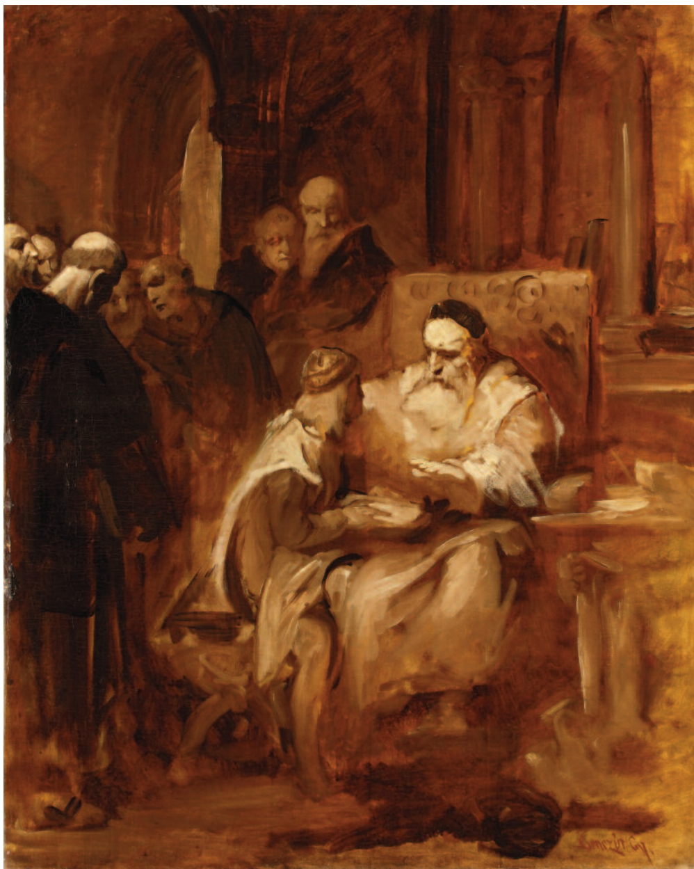
Benczúr Gyula: Szent István oktatja fiát, Imrét. Vászon, olaj. 92x73 cm, MNG lt. sz.: 78.29 T

ár 27-én egy új, második bizottság állt fel Lónyay Menyhért gróf elnöklete alatt, 9 illetve Horváth Mihályt felkérték arra, hogy jelöltesse ki a falképek tárgyát az Akadémia Történettudományi Osztályával. 10 Új koncepció meghatározására azért volt szükség, mert Ipolyi Arnold lebeszélte a bizottság tagjait a művelődéstörténeti programról. 11 A