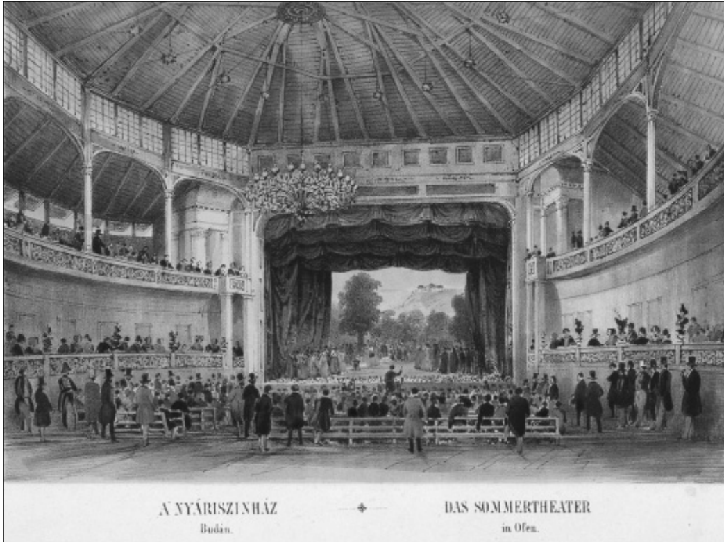
3. kép. Bellini Norma című operájának jelenete a Budai Nyári Színkörben. Rudolf von Alt rajza, Sandmann színezett linómetszete. 1843

szikusnak nevezett vándorszínészet korszakában zajlott és szoktatta az „első közönséget”, a színházzal első alkalommal találkozó nézőt a színház művi-művészi valóságának értéséhez és értelmezéséhez mind vizuális, mind nyelvi szempontból.