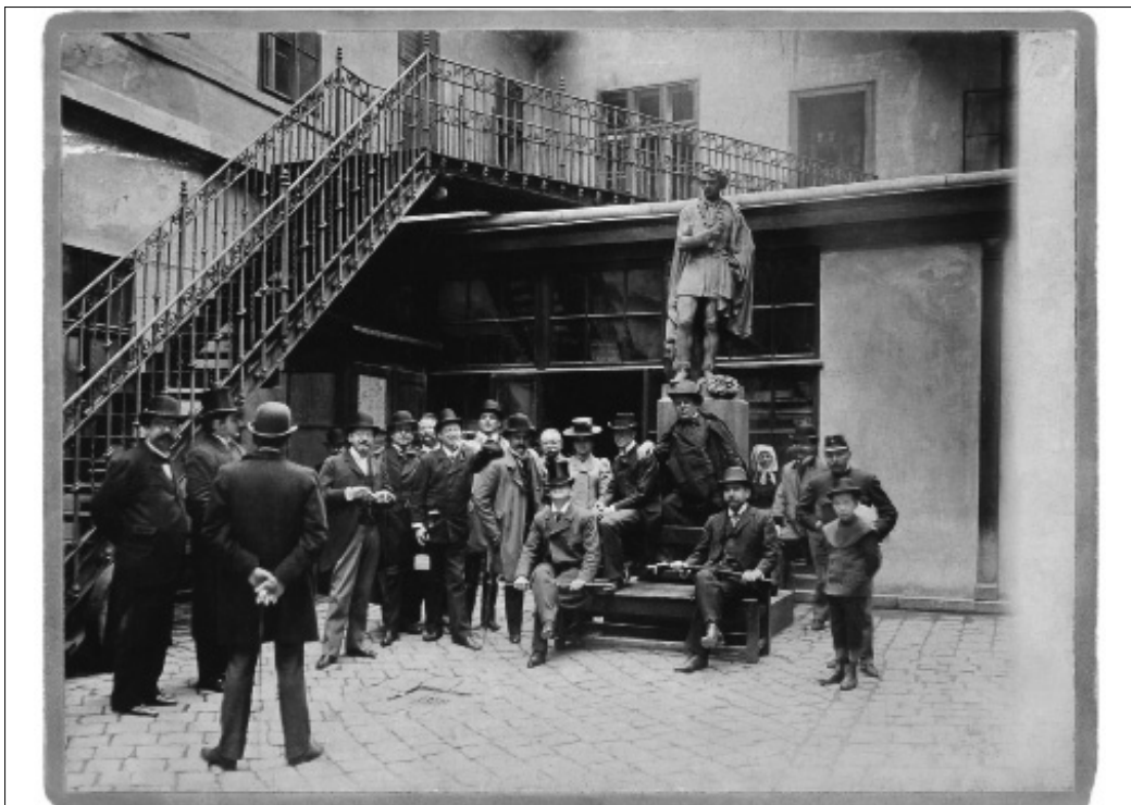
16. kép. Festetics Andor és a Nemzeti Színház tagjai a Nemzeti bérházának udvarán a Lendvay-szoborral az 1890-es évek végén