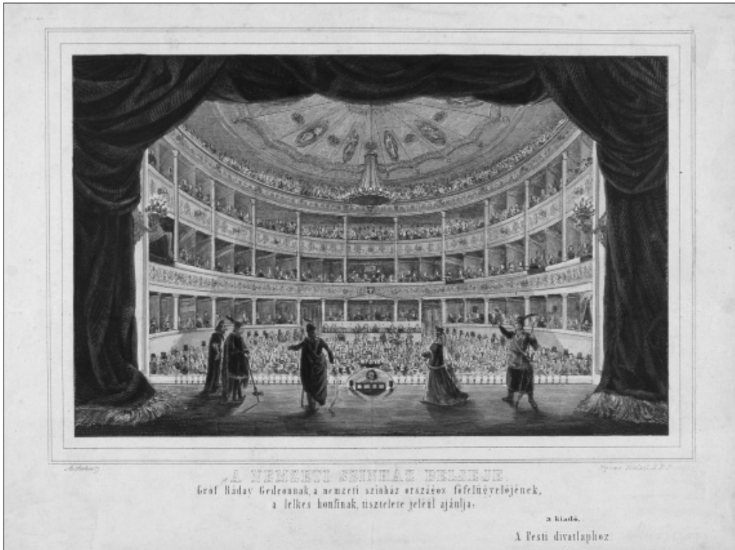
4. kép. A Nemzeti Színház belseje. Rohn Alajos színezett litográfiája, 1846