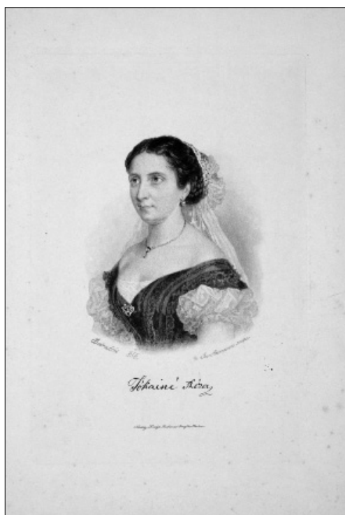
19. kép. Jókainé Laborfalvi Róza Pataky nyomatan, 1864

kezésére, hogy a portré civil arcot-alakot mutat-e vagy szerepben ábrázolja alanyát, illetve hogy műtermi vagy később színpadi felvételen látunk-e színházi tárgyú képet.