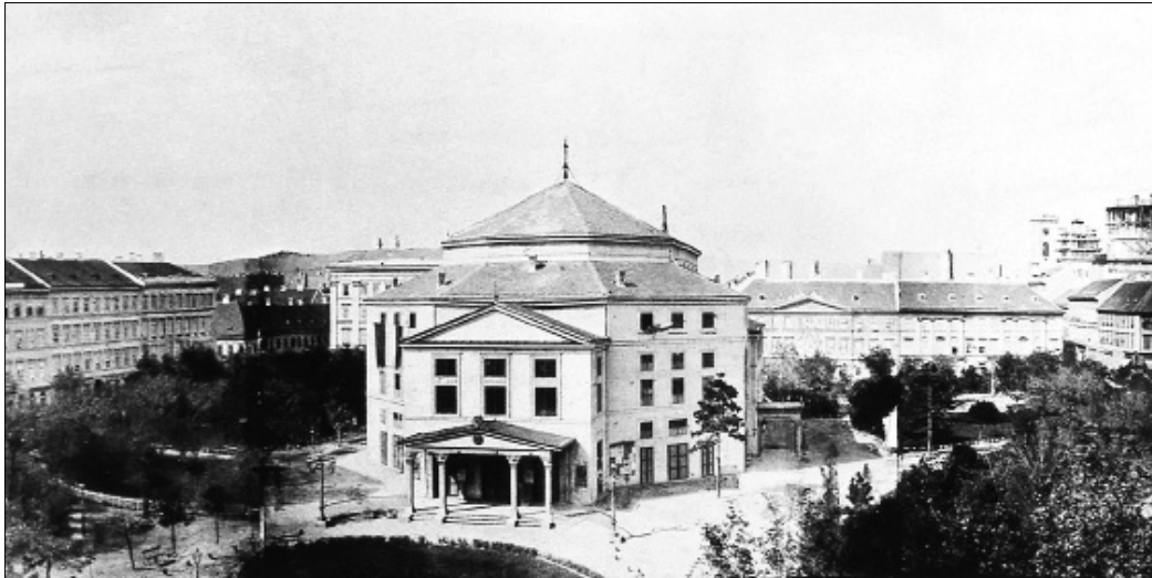
6. kép. A Nottheater. Ismeretlen fényképész panoráma-felvétele, 1860-as évek

illusztratív szerepűnek tekinti, semmint önálló képi műalkotásnak. (Ennek a kérdésnek néhány további részletére később visszatérünk.) A színházi élmények emlékidézése ily módon már tömegkommunikációs funkcióba helyezi a képes színház- és színjáték-ábrázolásokat, amelyek az (olvasó)közönség közös élményalapjának, ismereteinek és utalásrendszerének részévé válnak. Ebben a szerepben kiemelkedő példák a 19. század legvégétől egészen az 1980-as évekig divatban volt ún. sztárfotók.