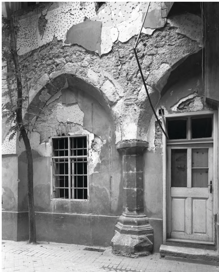
5. Udvari árkádok: Országház utca 2. fotó: Petrás István 1946. BTM Fotoarchívum

Néhány budai polgárház hátsó, udvari traktusába nagyszabású árkádíveket építettek (5. kép). 73 Az ívek fölött mindig lakóhelyiségek találhatók egy vagy két emelet magasan. A szépen kidolgozott pillérekön nyugvó árkádívek lehetséges, hogy áruátvitelre készültek, de az sem kizárható, hogy a ház ura nyári ünnepségek, lakomák alkalmával is használta az alatta levő teret.