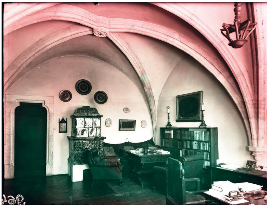
3. Bolthelyiség bordás keresztboltozattal: Országház utca 13.

tűnik, hogy a jogkönyv leírása valójában egy átvett szöveg felhasználása, nem pedig a korabeli valóságot tükrözi. Bizonyára voltak már a 14. században is téglaboltozattal fedett helyiségek, de nagy tömegben inkább a 15. században váltak elterjedtté.