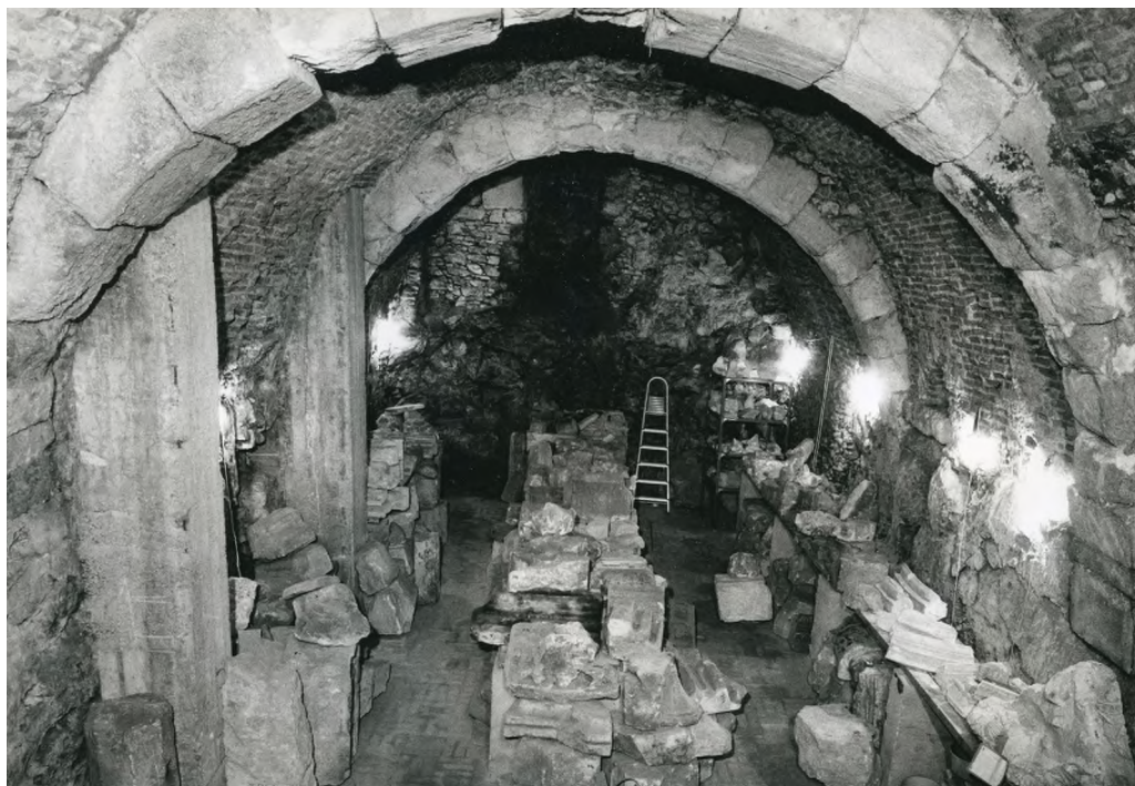
4. Raktárpince: Űri utca 4.

A kereskedők házainak pincéi áru- és borrháztározásra szolgáltak. A pincékbe többnyire az utcáról lehetett lejutni egy rövid lépcsőn keresztül, amely csak a pincefal belső síkjáig tartott. Innen valószínűleg falépcsőkön tudtak továbbmenni. A lejáratot a fal külső síkjára épített ajtó zárta le, amelynek kőkerete sok esetben megmaradt. A