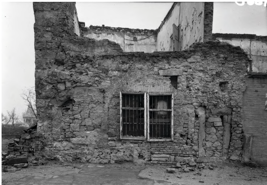
2. Patika homlokzata boltablakkal és boltajtóval: Tárnok utca 13. fotó: Petrás István 1947. BTM Fotoarchívum

A piactereken álló kalmárboltok, mészárszékek és kenyérszékek boltablakaihoz hasonló, nagyméretű, félköríves vagy szegmensíves záródású boltablakot polgárházakon csak a patikasoron és a posztókereskedőknél találunk ( 2. kép ). 63 A Jogkönyv leírása szerint (70. és 174. cikkelyek) a kereskedőnek nem szabad „nyitott boltból” árusítania, csakis boltozatosból. A nyitottság ebben az esetben azt jelenti, hogy az utcai homlokzatba