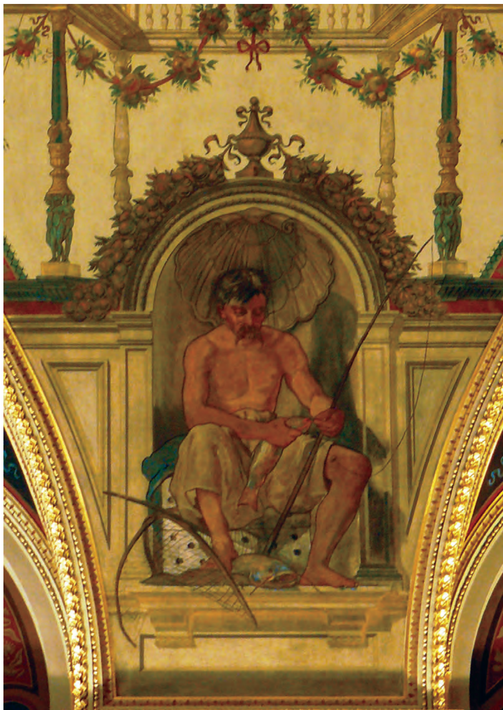
Feszty Árpád – A Halászmesterség allegóriája