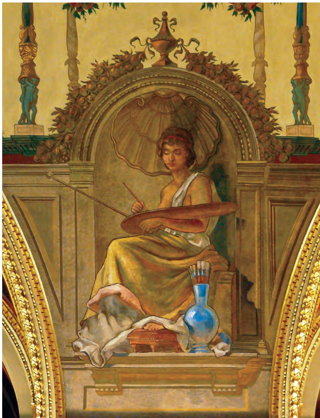
Feszty Árpád – A Festőművészet allegóriája