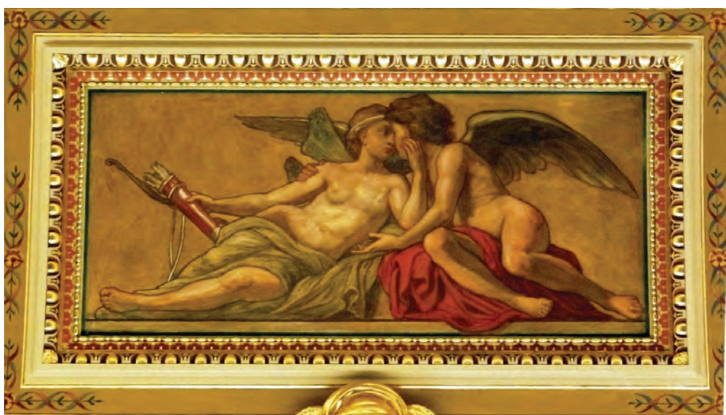
Lotz Károly: A Szerelem allegóriája

a szereplők elhelyezkedése pontos, világos és könnyen áttekinthető módon szerkesztett. Három, egymással szorosan összekapcsolódó, festőileg elrendezett csoportot különíthetünk el. A tiszteletet parancsoló, trónoló Budapest-allegória és a mellette álló két alak adja a kép középsíkban elhelyezkedő, piramidális rendezettségű bázisát. A