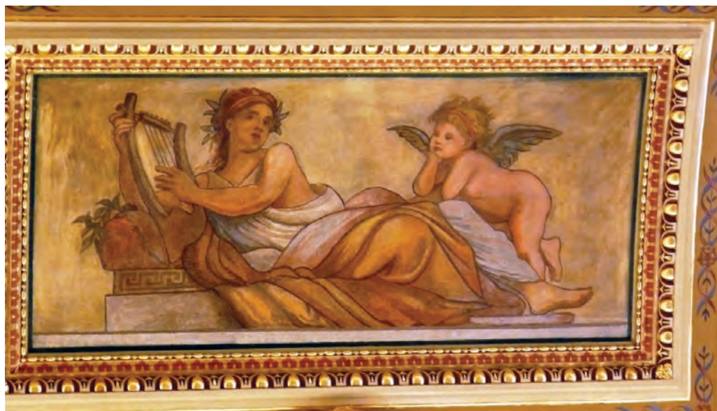
Lotz Károly: A Művészet allegóriája