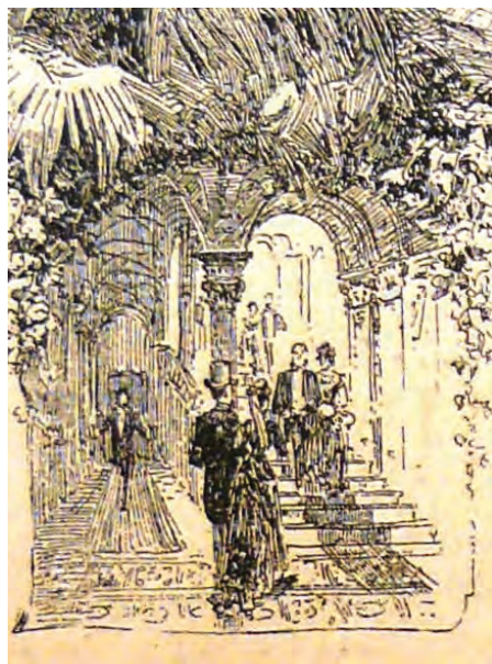
A Terézvárosi Kaszinó lépcsőházi fordulója Kahn, Joseph - Budapesti Útmutató, Emlék a főváros látogatóinak, Budapest 1891. 14.

Az épületről mindössze négy fényképet ismerünk, ezeket Hermann Oscar Rückwardt (1845–1919) porosz királyi és bajor királyi udvari fényképész készítette 1889 folyamán. A képek 1890-ben jelentek meg Berlinben