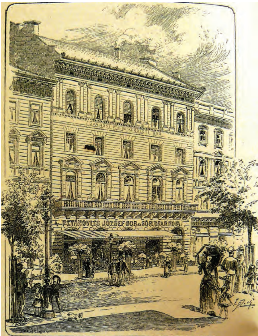
A Terézvárosi Kaszinó.

Kahn, Joseph: Budapesti Útmutató, Emlék a főváros látogatóinak, Budapest 1891. 51.