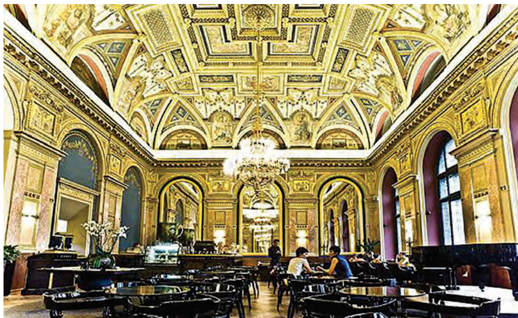
A Lotz terem mai képe

A Lotz-terem gazdag plasztikus kiképzésének részét képezi még az oldalfalakon látható, négyzet alakú, aranyalapon levő gipszstukkók sorozata. Ezek mesterét nem ismerjük, lehetséges, hogy az Operaháznál is közreműködő Fink Péter műhelyéből származnak. 49 A jelenetek nem egyediek – mindegyikből kettő lett kivitelezve, ráadásul némelyiken egyes figurák is ismétlődnek, így feltehető, hogy sablonnal készültek. A stukkók alakjai a görög-római mitológia szereplői közül lettek kiválasztva: a kentaurók és a bacchánsnök Bacchus kísérői, a borral, mámorral állnak kapcsolatban. A táncoló, zenélő, éneklő puttók ábrázolásának hangvétele szintén vidám, így a domborművek a helyiség bálteremként, mulatóhelyként betöltött szerepére utalnak.