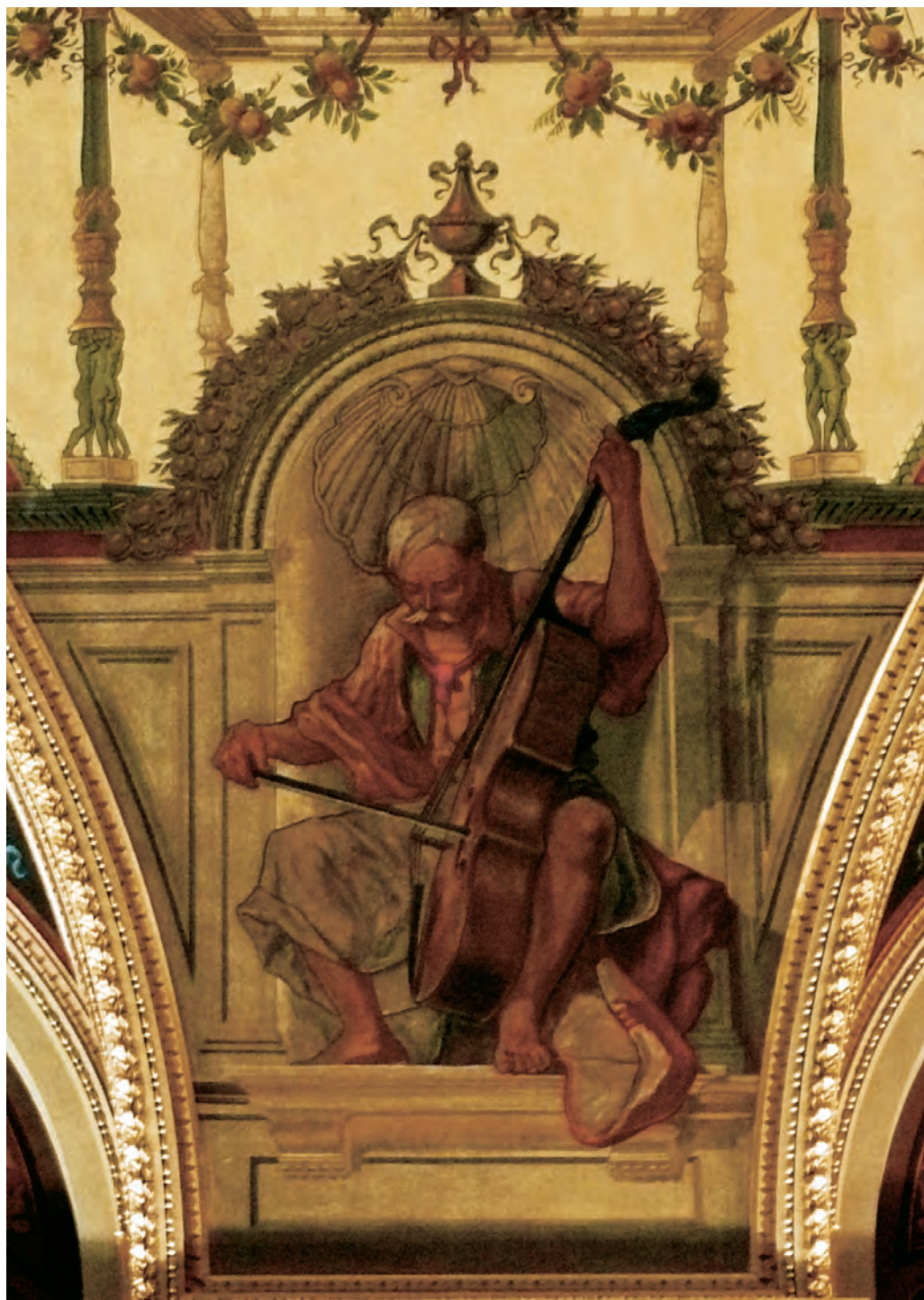
Feszty Árpád – A Zeneművészet allegóriája