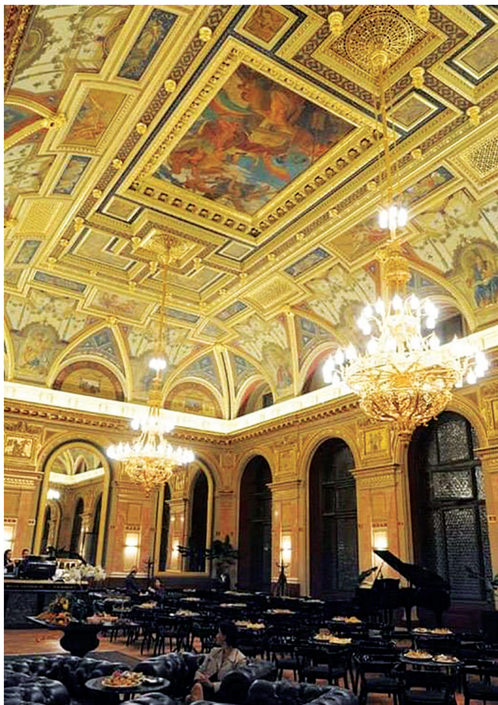
A Lotz terem mai képe