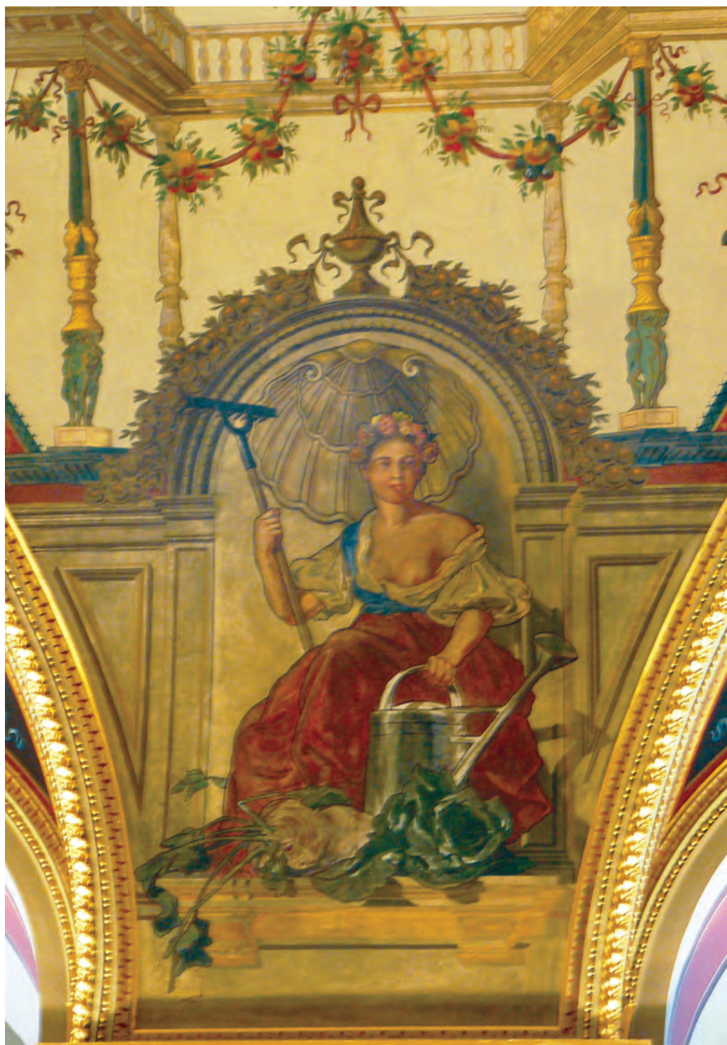
Feszty Árpád – A Kertművesség allegóriája