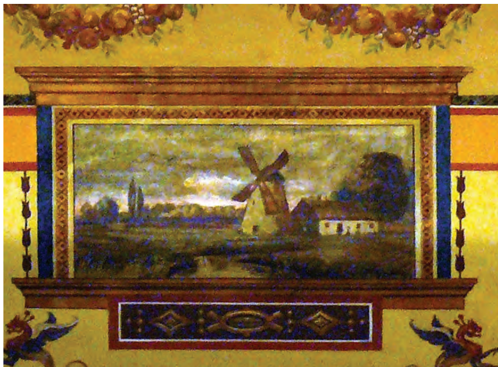
Feszty Árpád falképe – Az ógyallai malom

utóbbiakhoz mindig az alattuk elhelyezkedő alak kisméretű attribútumai vannak kötve. A jelképek, történetekre, személyekre utaló tárgyak összekötése, amely a groteszk ornamentika eszköztárának része, előfordult már a reneszánszban is, és érdekes játékot jelentett a művelt elmék számára.