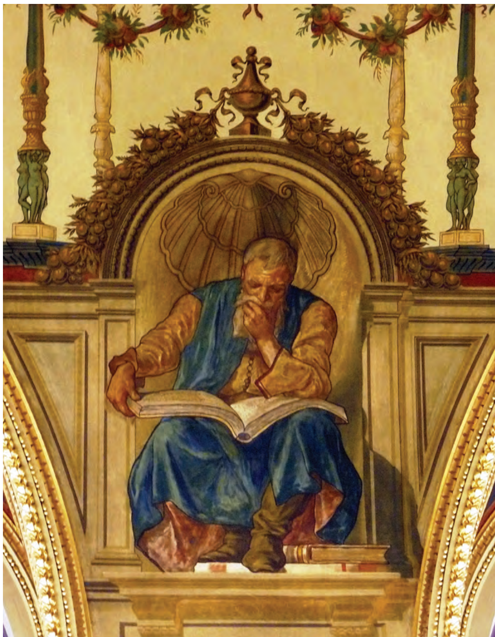
Feszty Árpád – A Tudomány allegóriája