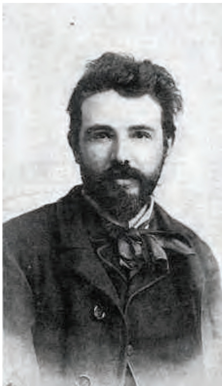
Feszty Árpád arcképe Vasárnapi Ujság , XXXIV. évf. 4. sz. 1887., I. 23. 53.

a Teréz körút 24. szám alatti Stern-bérházban levő mellszobra. Ezek, illetve a Vasárnapi Ujság egy 1890-es számában található, az építésszt ábrázoló portrérész összevetése a freskón szereplő alakkal is azt támasztja alá, hogy az allegória a terem tervezőjének arcvonásait viseli. 112