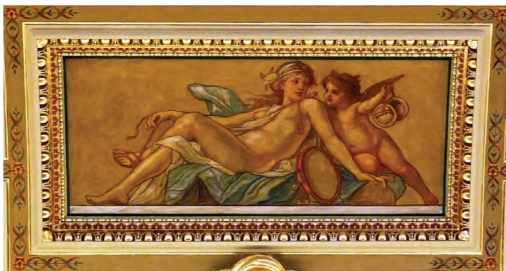
Lotz Károly: A Mámor allegóriája

vaskos kőpárkány alatt levő figurák alkotják a másik csoportot, a főváros allegóriája felett lebegők pedig a harmadikat.