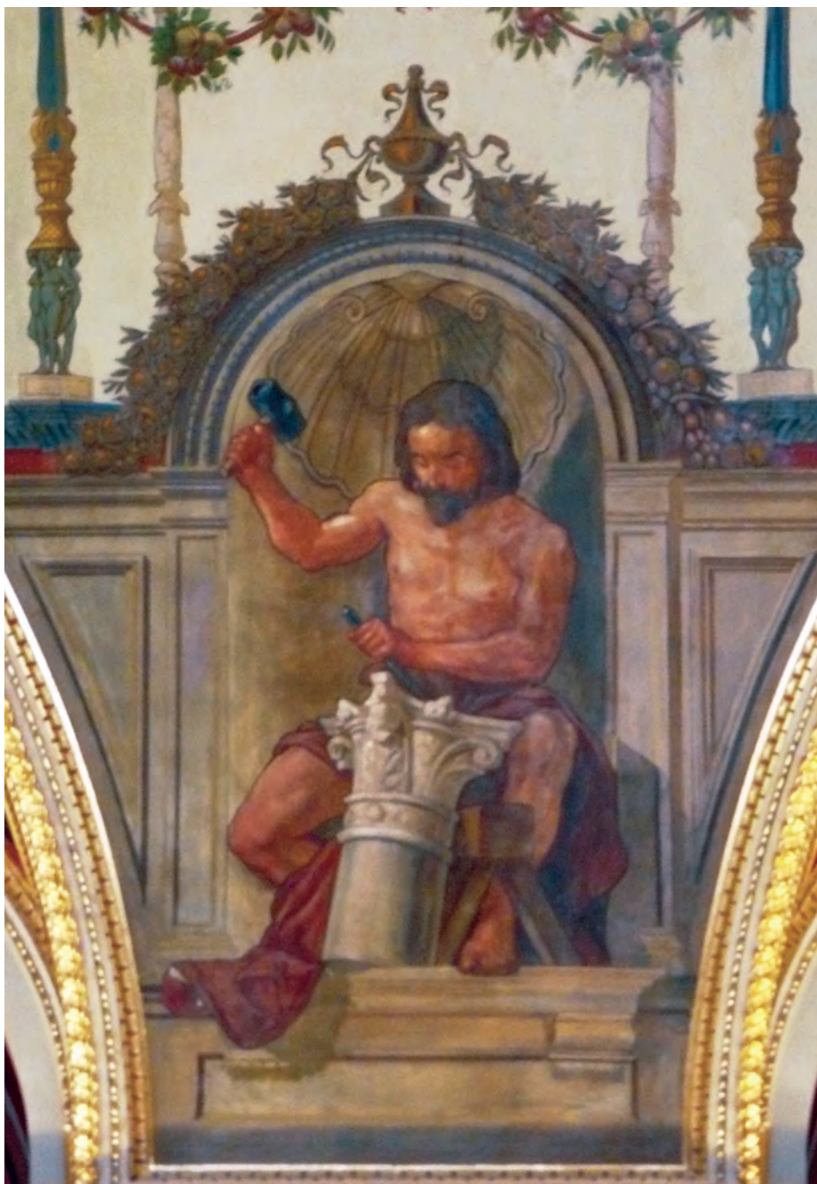
Feszty Árpád – A Szobrászúvészet allegóriája