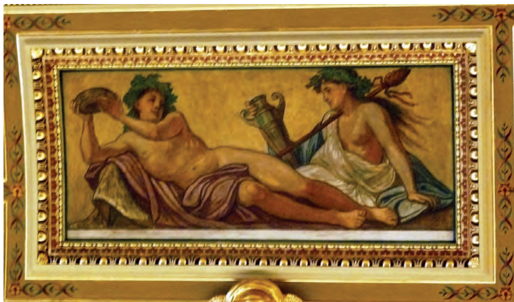
Lotz Károly: Az Élvezet allegóriája