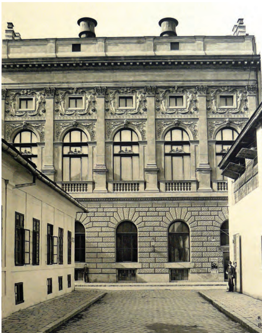
A Terézvárosi Kaszinó hátsó homlokzata, 1890

A korabeli útikönyvek csupán rajzokat közöltek az kaszinóról, és mint a főváros legelőkelőbb bálozóhelyét és legjobb éttermet magába foglaló intézményét, illetve mint VI. és VII. kerület jómódú polgárainak talál-kozóhelyét említik. 20 A kiadványokban ismétlődő három ábrázolás közül a homlokzatot és a dísztermet megjelenítők nem nyújtanak több információt a fotókhoz képest, viszont a díszlépcső részletét ábrázoló