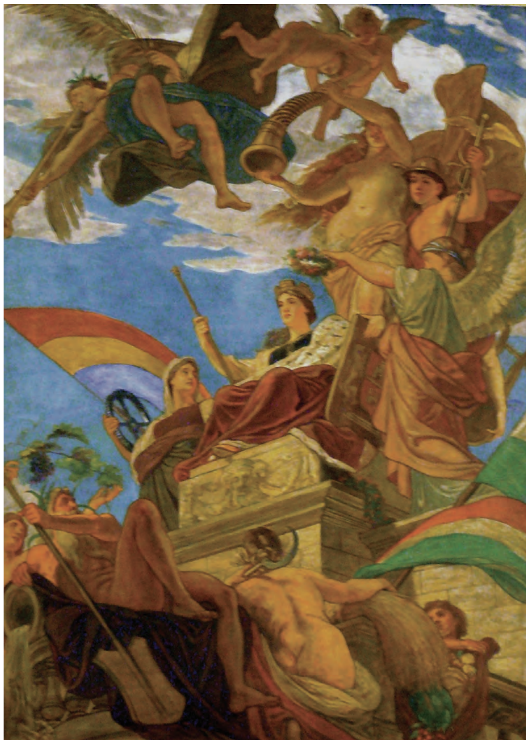
Lotz Károly: Budapest apoteózisa. Falkép a Lotz terem mennyezetén, 1883