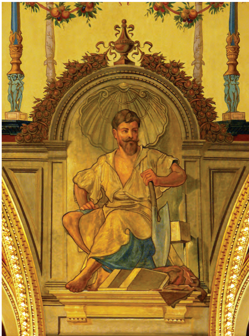
Feszty Árpád – Az Ácsmesterség allegóriája