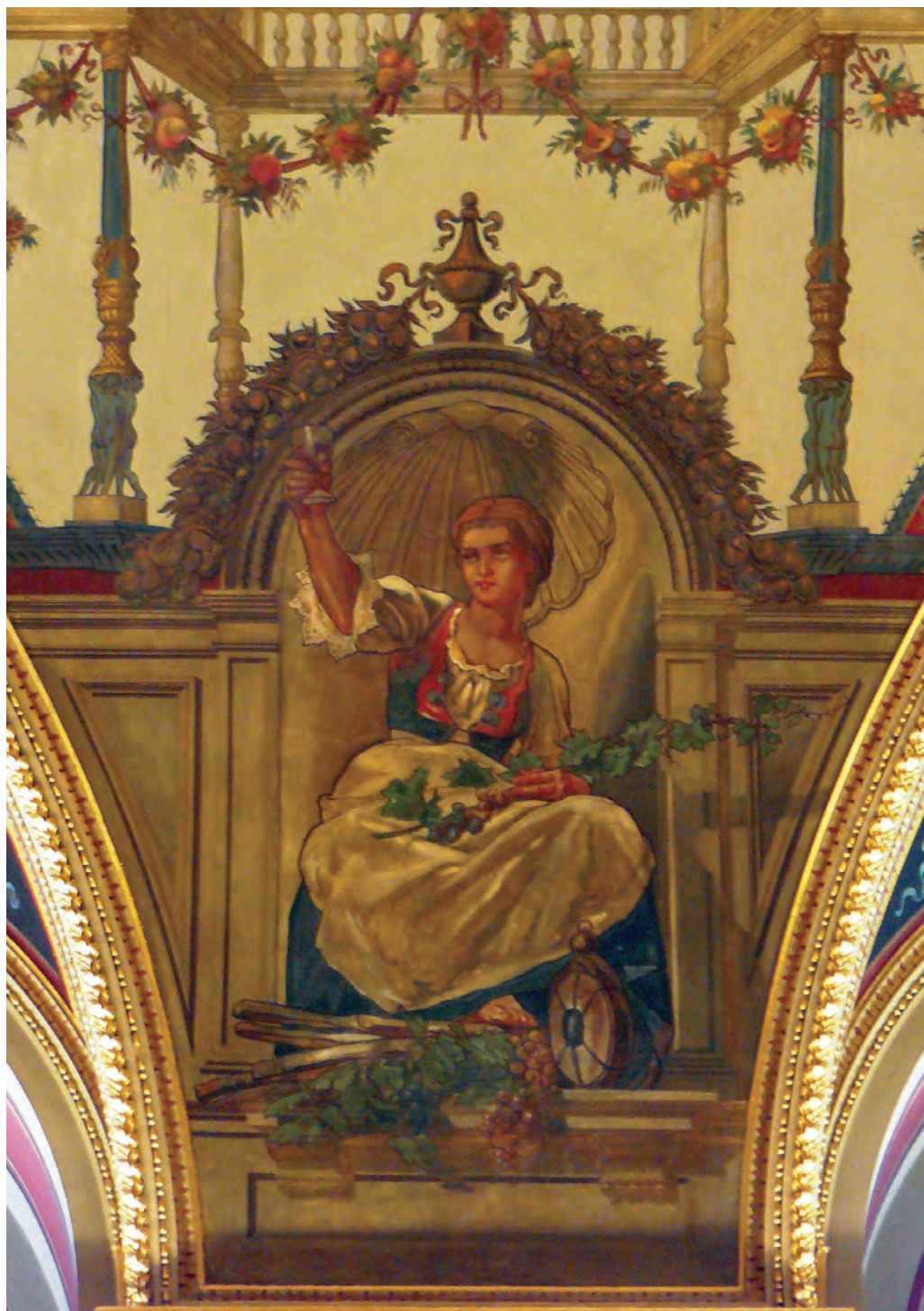
Feszty Árpád – A Szőlőművesség allegóriája