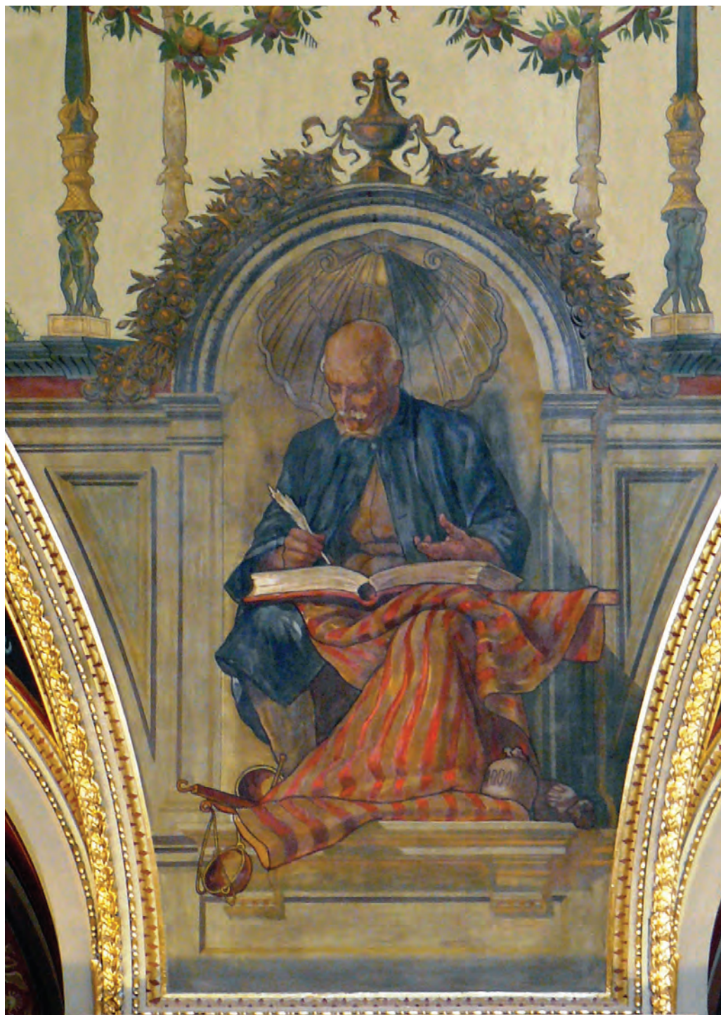
Feszty Árpád – A Kereskedelem allegóriája