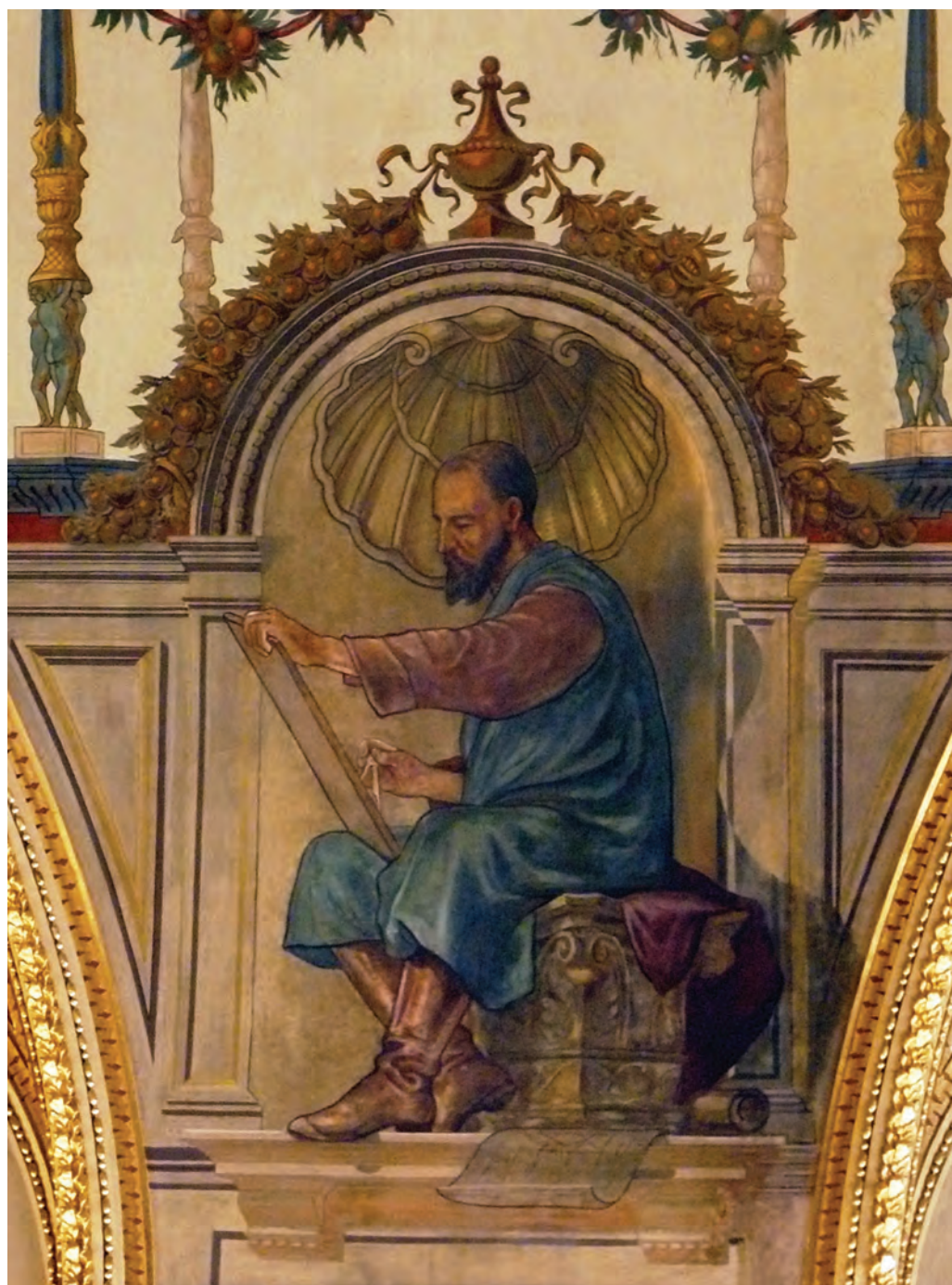
Feszty Árpád – Az Építőművészet allegóriája