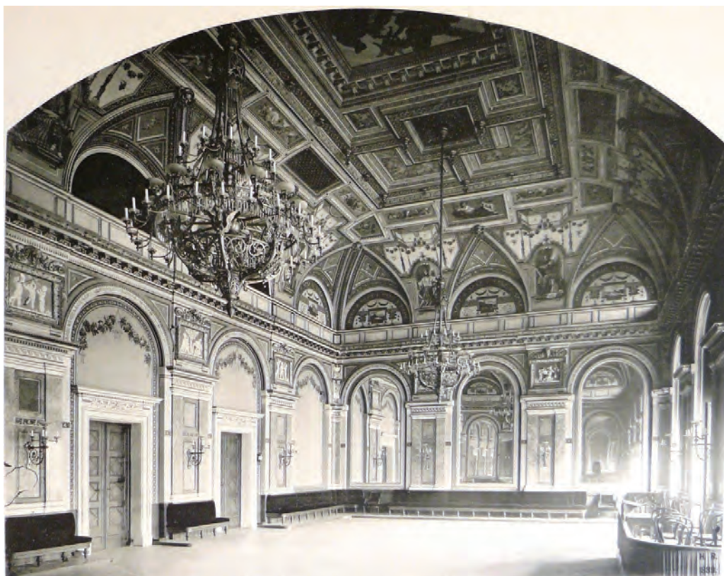
A Terézvárosi Kaszinó Lotz terme, 1890. Heinrich Rückwardt fotója, 1890

képen láthatjuk, hogyan vezetett a bejárati kaputól a hátsó traktus felé a folyosó, és miként csatlakozott a díszlépcsőházhoz. 21