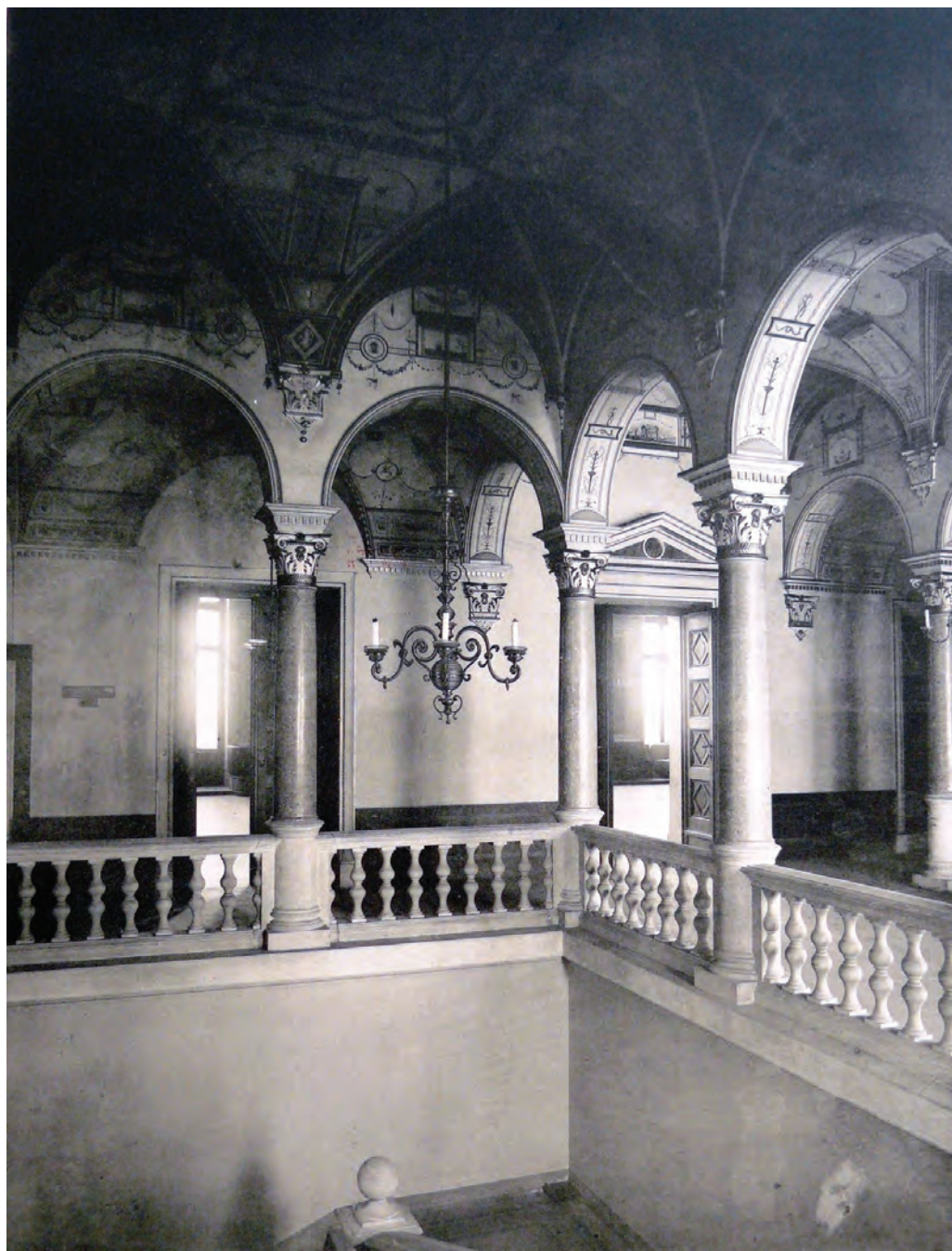
A Terézvárosi Kaszinó diszlépcsőháza. Heinrich Rückwardt fotója, 1890