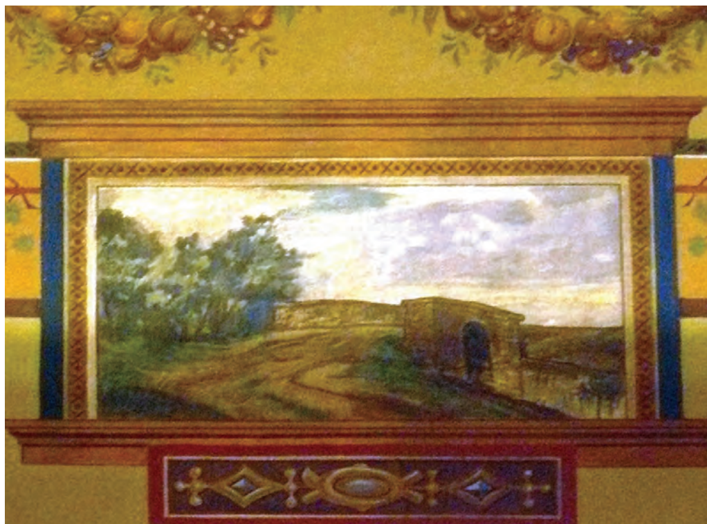
Feszty Árpád falképe – Az ógyallai híd