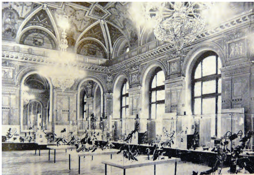
A Párizsi Nagy Áruház Lotz-terme 1953, Czeizig Lajos fotója, képeslap

Az épület Szerecsen utca felé néző hátsó traktusa, – ez ma is eredeti állapotában tekinthető meg – gipszstukkókkal van ékítve, hasonló igényességgel. Nagyvonalúan