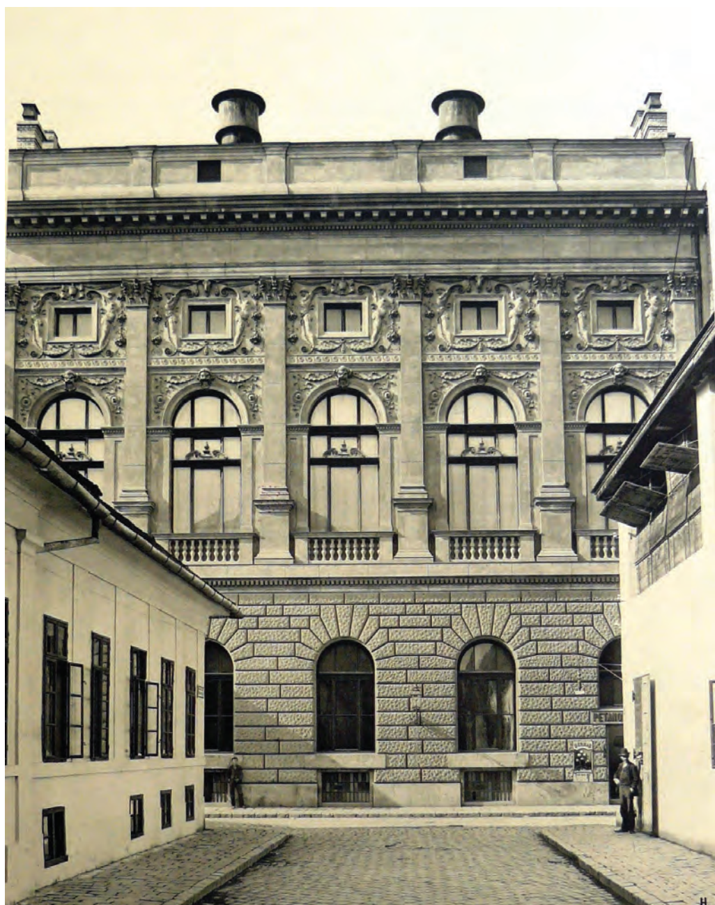
A Terézvárosi Kaszinó homlokzata, Heinrich Rückwardt fotója, 1890

az Architektonische Studien Blatter aus Budapest első sorozatának 21, 22, 23. és 48. lapjaként. Ezeken az elülső és hátsó homlokzat, a díszlépcsőház és a Lotz-terem látható.