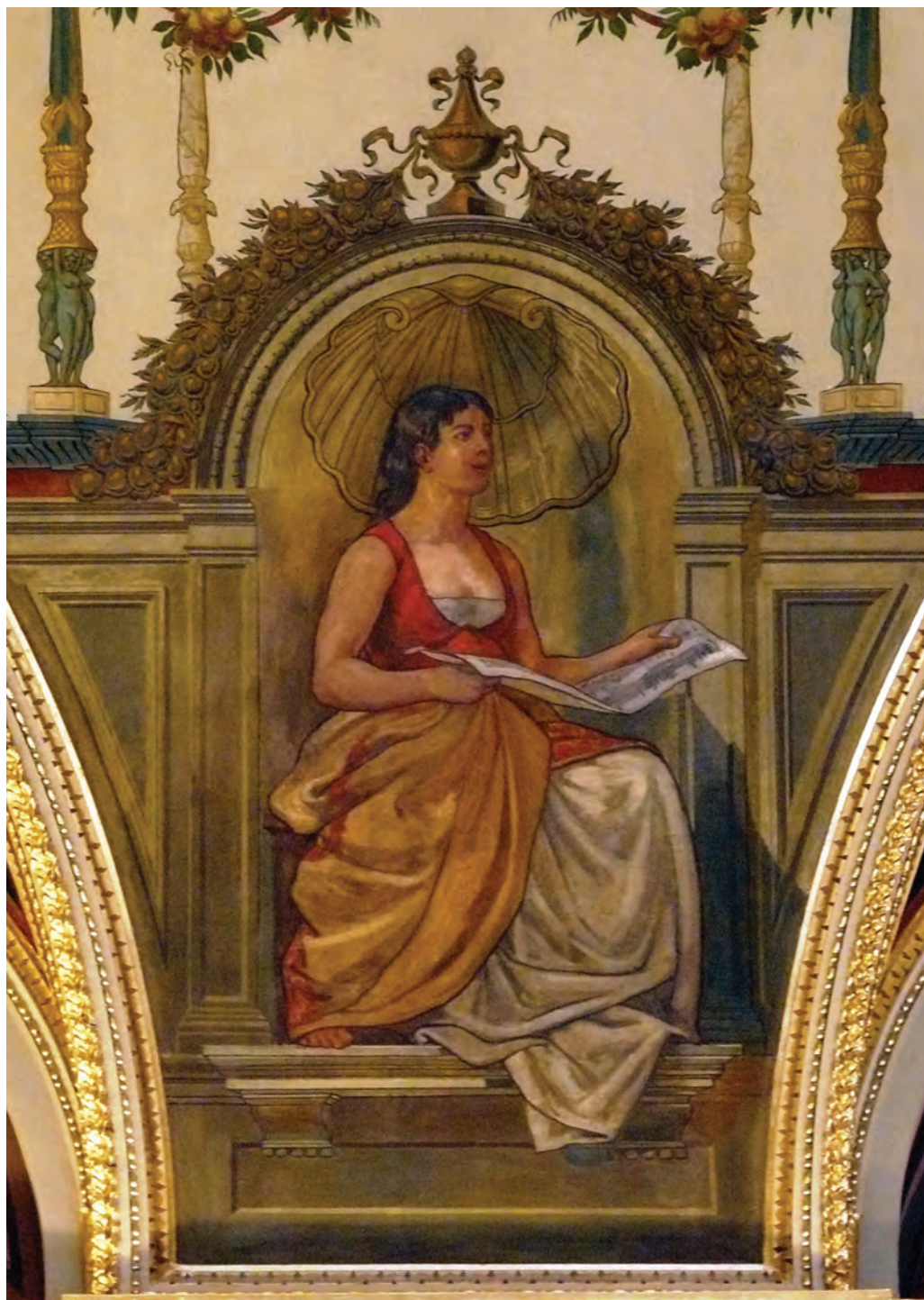
Fesztly Árpád – A Színészmesterség allegóriája