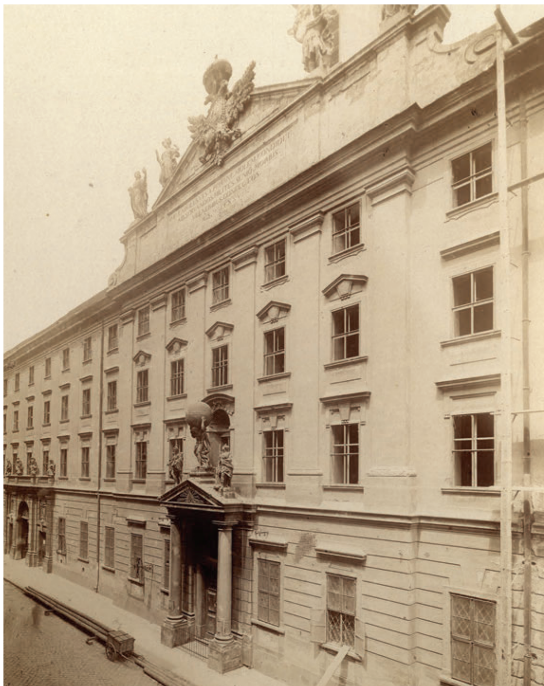
Az Invalidus-ház / Károly-kaszárnya Gránátos (ma Városház) utcai homlokzata, 1890-es évek (részlet)