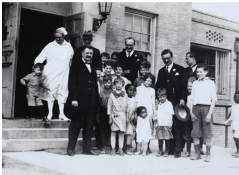
6. Gyerekcsoport a gondozóban, 1928

1925 augusztusában részt vett a Nemzetközi Gyermekvédő Unió I. nemzetközi gyermekvédelmi kongresszusán Genfben. 45 1926-ban a közjótékonyági ügyosztály vezetőjeként lehetővé tette, hogy beosztottjai külföldi (főként osztrák) kiküldetéseiben különféle népművelési mozgalmakat tanulmányozhassanak, majd az így megismert külföldi példákat itthon a gyakorlatba is átültessék (tehetségvédelmi akció, iskolai fiú- és leánymozgalmak, ismeretterjesztő előadások, egészségügyi és háziasszonyi hivatásra képző tanfolyamok, minden réteg számára elérhető árú hangversenyek). 46