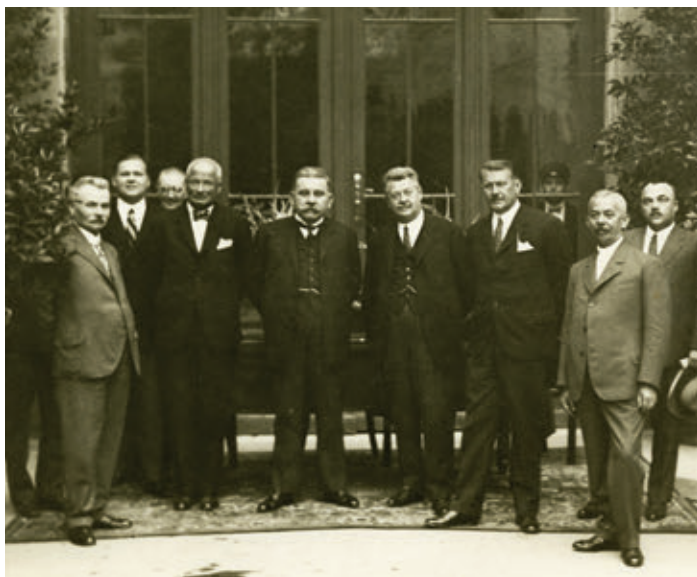
11. Gárdonyi testvérek: Városházi vezetők csoportja, 1930-as évek