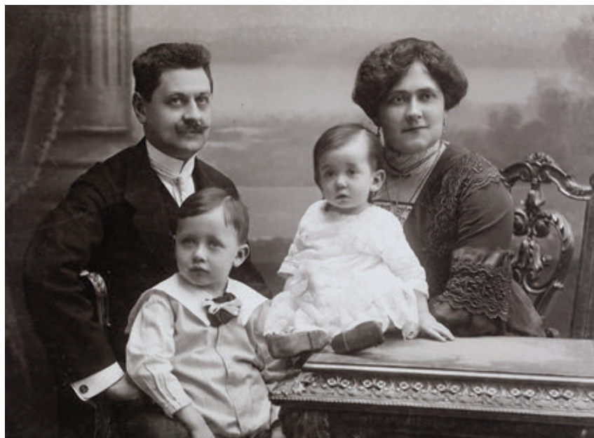
19. Album a Liber család hagyatékából