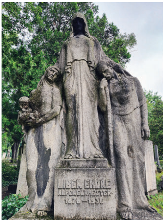
22. Liber Endre síremléke a Fiumei úti sírkertben