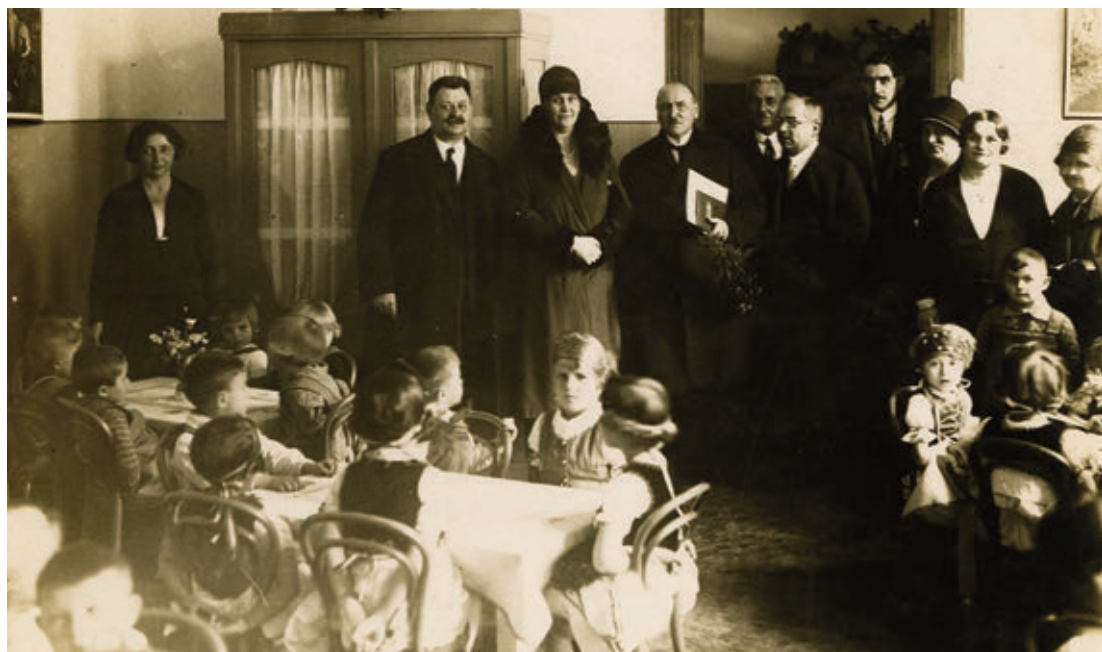
7. Horthy Miklósné és Liber Endre látogatása egy fővárosi óvodában, 1930-as évek

ismerteti. 53 1930-ban Horthy Miklósné jótékonyági akcióihoz segítséget keresett a főváros szociálpolitikával foglalkozó szerveinél, így került kapcsolatba Liber Endrével, akinek személyében céljaihoz megfelelő munkatársra talált. Liber ezután több ízben bonyolította le a kormányzóné nyomorenyhítő, illetve karácsonyi akcióit. 54 Együttműködésük a későbbiekben gyermekotthonok létesítésére és fenntartására is kiterjedt: a főváros korábban már létrehozott ilyen otthonokat az óvodák mellett, ahol a szegény szülők gyermekei kora reggeltől késő estig gondozást és táplálékot kaptak, a kormányzóné segítségével azonban innentől kezdve csak az újak alapításával kellett foglalatzkodniuk, fenntartásukat Horthy Miklósné hölgybizottsága segítségével magára vállalta. 1932-re 25 ilyen gyermekotthon nyílt a fővárosban.