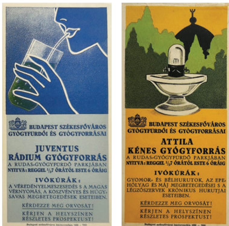
17. A Juventus- és Attila-gyógyforrásokat népszerűsítő reklámcédulák

gyógyfürdők ismertetéséhez.” 99 1934 júniusában megnyitotta a Szent Gellért Fürdő új pezsgőfürdőjét, amelyet filmhíradó is megörökített. 100