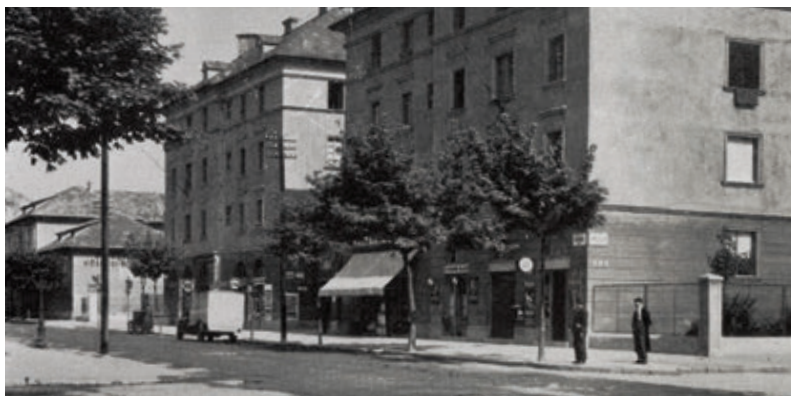
9. Lenke úti kislakások

Liber Endre kezdeményezésére indította meg a főváros 1925-ben az ún. kislakásépítési programját, amelynek során 1929-ig több mint 4000 kis- és közepes lakást, valamint szükséglakást építettek. 62 Liber fontosnak tartotta tanulmányozni más országok példáit, gyakorlati megvalósításait, ezért több külföldi tanulmányutat tett, kifejezetten ezzel a céllal. A főváros nagyszabású munkájáról később a Középítkezések Budapesten 1920–1930 című írásában számolt be részletesen, gazdag képanyagot is közölve. 63