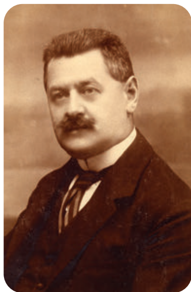
10. Liber Endre Budapest alpolgármestere, 1931 körül

A székesfőváros törvényhatósági bizottsága 1931. március 5-ei, rendkívüli közgyűlésén, első ízben Liber Endre tanácsnokot választotta meg alpolgármesternek 75 (a másik alpolgármester Liber régi kollégája, Borvendég Ferenc lett). Ripka Ferenc főpolgármester ezekkel a szavakkal köszöntötte: „Üdvözlöm Liber Endre alpolgármester urat, aki a közjótékonyági és szociálpolitikai osztály élén szerzett kiváló érdemeket. Tudása, szorgalma és nemesen érző szive biztosították ebben a körben törekvéseinek eredményeit. Büszkén mondhatjuk, hogy őt a főváros nevelte erre a munkára. A József főúrvaházból tisztán a saját erejéből emelkedett erre a magas vezető állásra és ezzel a legnemesebb demokrácia példáját mutatja nekünk.” 76 Liber Endre ekképpen köszönte meg a méltató szavakat: „A szociálpolitika biztosítja a gazdasági élet megnyugtató alapjait, amint ezt a közgyűlés is már régen belátta. Hálás köszönetet mondok azért, hogy e nagyfontosságú elhatározásokban a közgyűlés akaratának végrehajtója lehettem és ezzel a polgárságnak is használtam. Úgy érzem, hogy mai megválasztásom további intenzív szociális munkára kötelez, annak a folytatására, amit elkezdtem.” 77 Alpolgármesteri tisztségében is ugyanazon munkakörökben működött tovább, mint korábban, figyelme azonban a későbbiekben mindinkább kiterjedt a közművelődésre, az idegenforgalomra és a fürdőkultúrára.