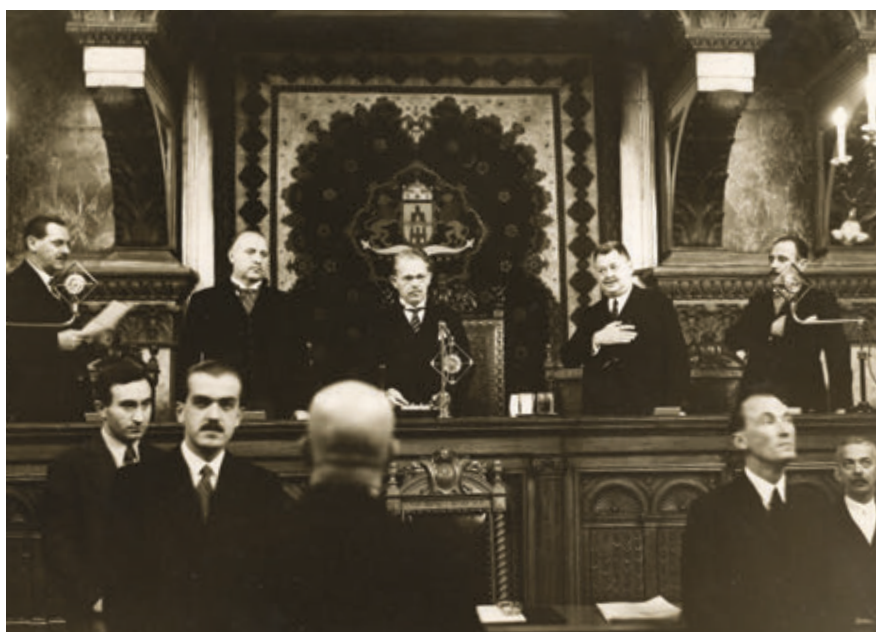
13. Alpolgármesterek beiktatása 1935. október hó 2-án

1935. június 28-án másodszer is alpolgármesterré választották, 80 esküjét október 2-án tette le.