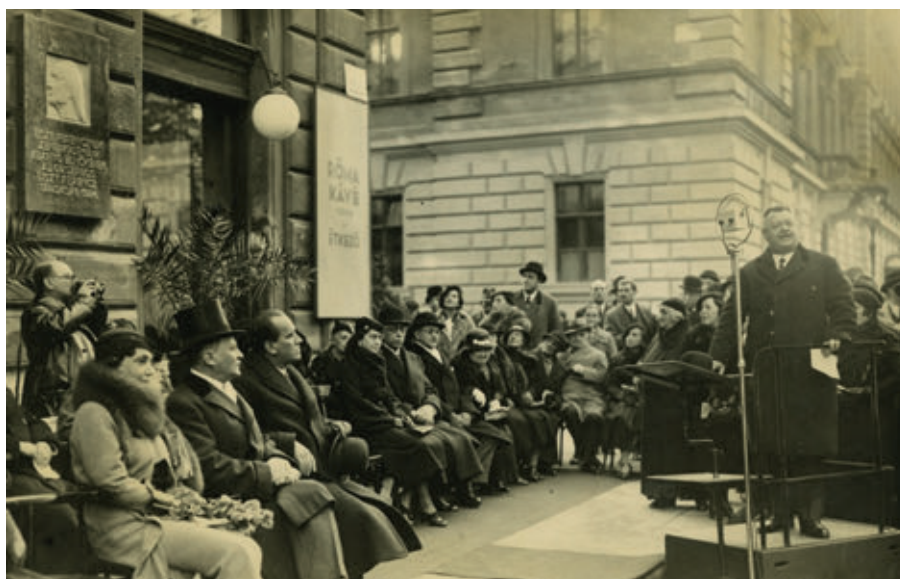
15. Liszt Ferenc emléktáblájának leleplezése, 1934. október 21.

Alpolgármestersége idején számtalan új szoborral és emléktáblával gazdagította a főváros köztereit és parkjait, 1934-ben jelent meg Budapest szobrai és emléktáblái című, nagy sikerű monográfiája, amely kötetbe rendezve tartalmazza a főváros összes ilyen jellegű, 1702 és 1933 között keletkezett emlékét. A kötet rendkívül értékes forrásként szolgálhat a téma kutatóinak – sok köztéri szobrot már csak Liber kiváló monográfiájából ismerhetünk.