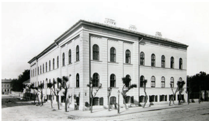
1. Klösz György: A fővárosi József Fiúárvaház, 1900