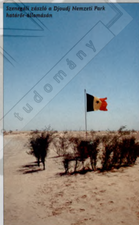
Szenegáli zászló a Djoudj Nemzeti Park határ-állomásán

Ha a határ ráadásul szélsőséges klímájú területen (sivatagok, őserdők, magas hegyek, sarkvidék) és ráadásul háborús övezetben fe-