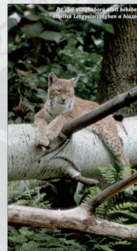
Az első világháború alatt békeben élhettek Lengyelországban a hiúzok

A háborúk fajunk nyúlfarknyi történelmének legsötétebb epizódjai, melyek a szomorúságot és halált hadak formájában hozzák el otthonainkba. A véres harcok kétes eredményeként megszülető határok pedig folyamatos frontvonalként csúfítják el a világ térképét. A történelemírás a kutatók minden törekvése ellenére szubjektív,