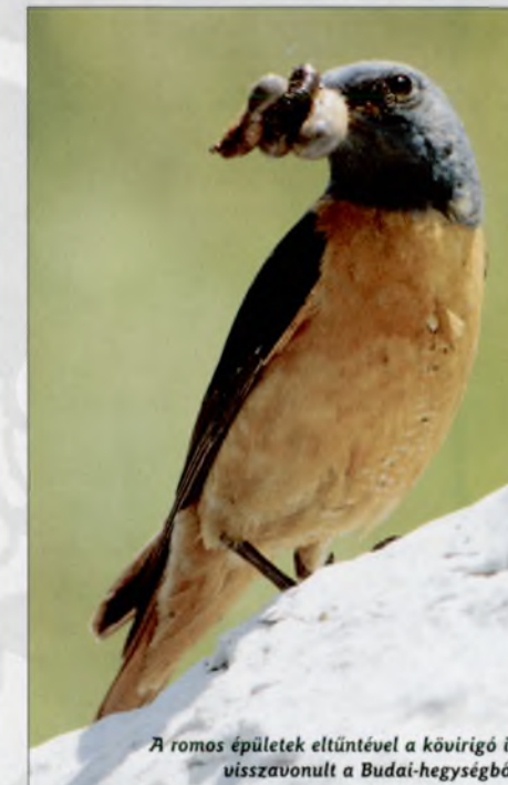
A romos épületek eltűnével a kövirigó is visszavonult a Budai-hegységből

inknek maga a Kánaán. Vannak persze olyan, értelmetlenebb állati résztvevői is konfliktusainknak, akik anélkül használják ki a háborúkat, hogy azzal nekünk, embereknek kellemetlenséget okoznának. A kövirigó ( Monticola saxatilis ) napjainkra egyik legtrikább madarunkká vált, és szinte teljesen eltűnt a Budai-hegységből. A II. világháború után azonban itteni állománya néhány évre megerősödött, mert a főváros ostroma során képződő romos épületek szinte korlátlan fészkelőhelyet jelentettek számára. Az európai hiúz ( Lynx lynx ) lengyelországi állománya a bialowiezi őserdőben az I. világháború