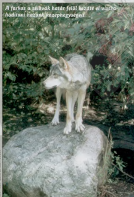
A farkas a szlovák határ felől kezdte el visszahódítani hazánk közephegyseit