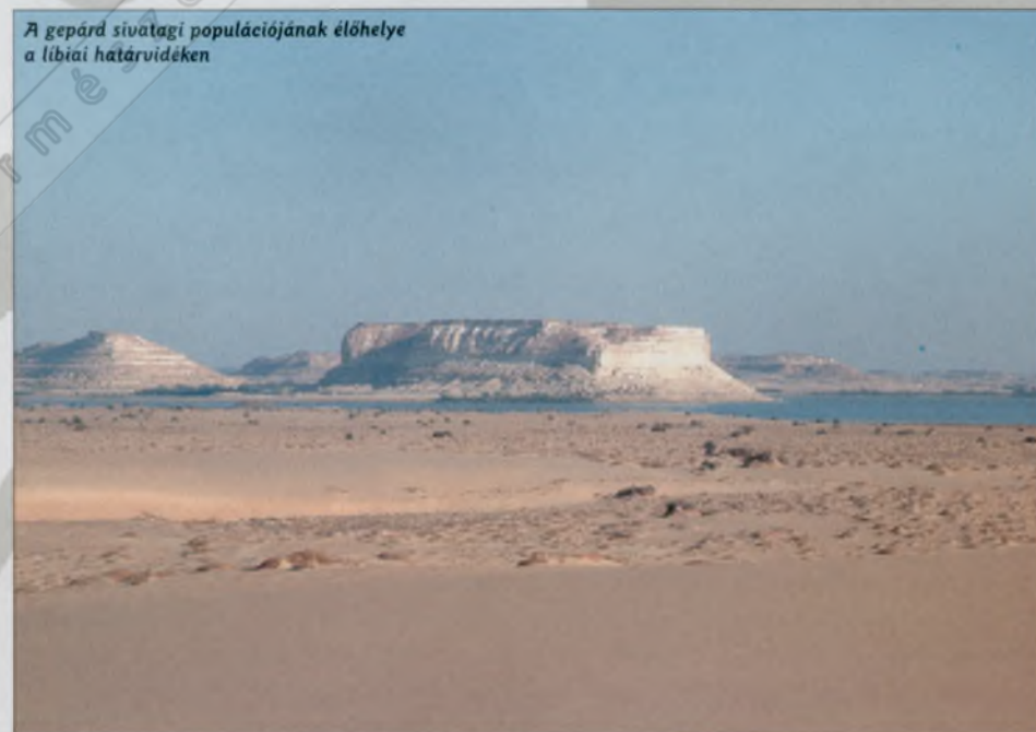
A gepárd sivatagi populációjának élőhelye a libiai határvidéken