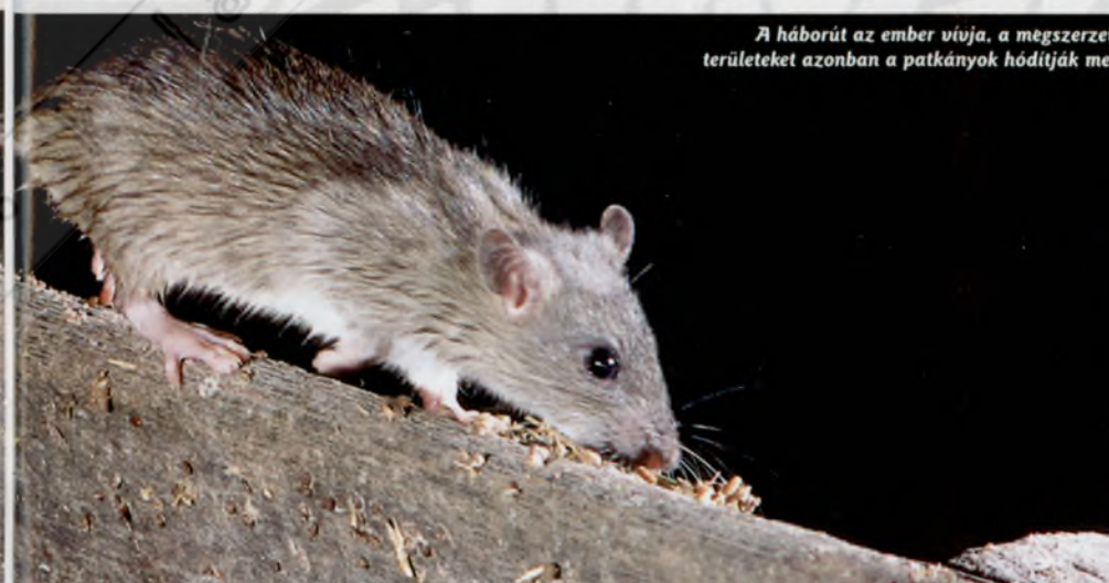
A háborút az ember vívja, a megszerzett területeket azonban a patkányok hódítják meg

zöld döglégyekkel. A háborúnak mindig két nyertese van: a legyek és a patkányok...”