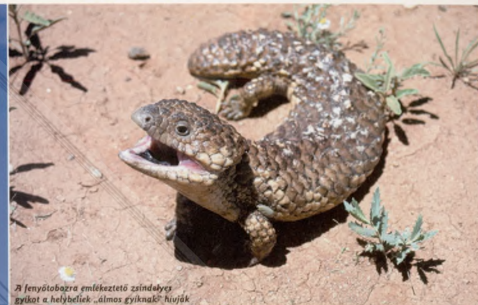
A fenyőtobozra emlékeztető zsindelyes gyíkot a helybeliek „álmos gyíknak” hívják