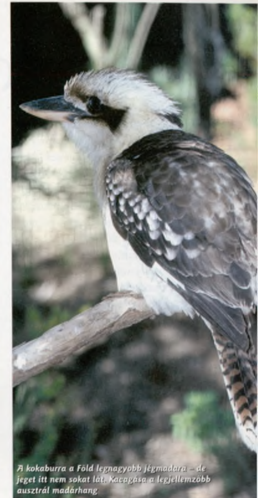
A kokaburra a Föld legnagyobb Jégmadara – de jeget itt nem sokat lát. Kacagása a legjellemzőbb ausztrál madárhang

legalább kétszer ennyi, fényképezőgéppel, videóval felfegyverkezett csodaváró. De hát nincs más megoldás: ha az ember szép képet akar készíteni az Ulururól, be kell állni a sorba! Egy alkalommal mi (négy magyar Uluru-csodáló) is odaálltunk, hogy lencsevégre kapjuk a színváltozást. Nagyon lassan tért nyugovóra a Nap az este, de azért türelemmel várakoztunk – mintegy kétszázadmagunkkal. Mellettünk két japán fiatal tette ugyanezt, s látszólag nagyon unták a dolgot. Végül is az egyik tört angolással megkérdezte: „Mondja, Uram, tulajdonképpen mire várunk itt?”