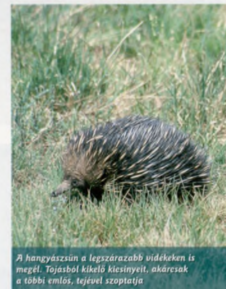
A hagyászsün a legszárazabb vidékeken is megél. Tojásból kikelő kiscsinyeit, akárcsak a többi emlős, tejével szoptatja

Az Uluru homokkővének vörös színe a Nap állásától, az eget borító (vagy nem borító) felhőzettől és a levegő páratartalmától függően állandóan változik. A Vörös Szikla nem mindig vörös, hanem néha még lila is! Ez a jelenség egyike a park fő látványosságainak. A napkelték és napnyugták különösen felejthetetlenek itt, így hát érthető, hogy ezekben az időszakokban számos látogató gyűlik össze a fényképezésre legalkalmasabb pontokon, hogy megörökítse ezt a szép látványt. Őszintén megvallva, meglehetősen illúzióromboló az egymás mellett parkoló 80-100 gépkocsi, s a