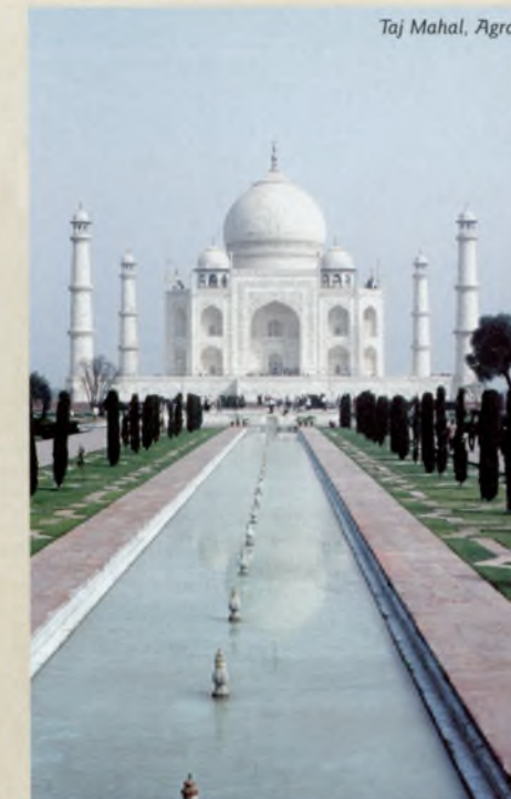
Taj Mahal, Agra