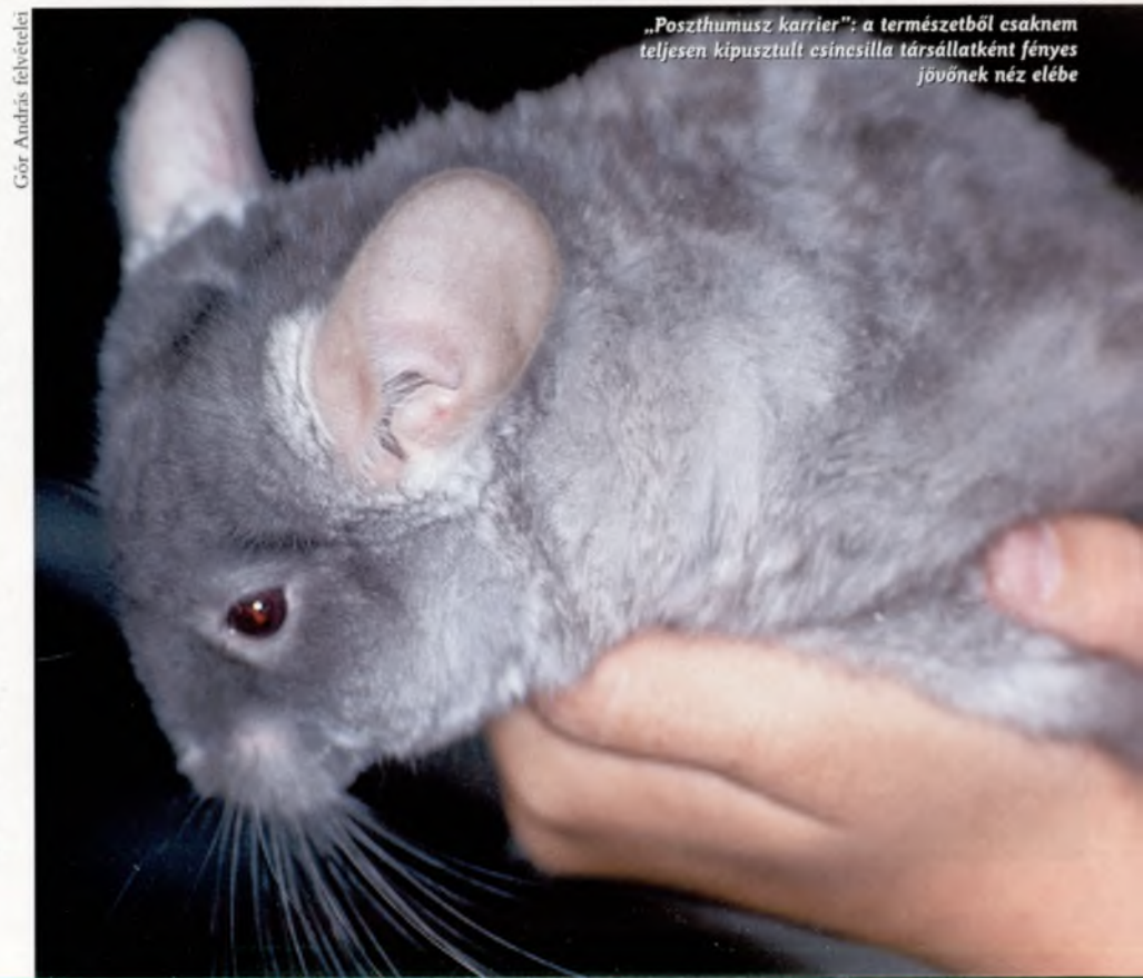
„Posztumusz karrier”: a természetből csaknem teljesen kipusztult csínosilla társállatként fényes jövőnek néz elébe