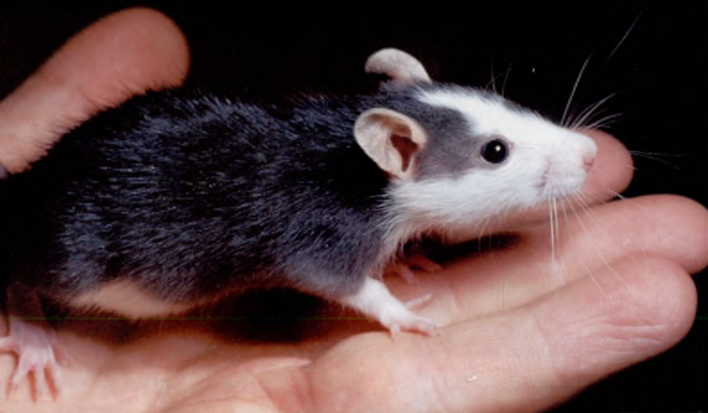
Ellenségből jóbarát: a rettegett vándorpatkány leszármazottai kezés lakótársá szelidültek

még nem tudtuk, de mára bizonyosságot nyert, hogy az állatok közelsége nyugtató hatással van az emberre. A macska simogatása közben csökken a vérnyomás, a kutya sétáltató könnyebben elkerüli az infarktust, az akváriumban sürgő-forgó halak nézése nyugtatja az idegeket, és akinek naponta gondoskodnia kell akár csak egy kis papagájról is, az soha nem érzi feleslegesnek magát az életben. A társállatot tartó embereknek jobb a kilátásai a hosszú életre, mint azoknak, akik zárva tartják otthonuk kapuit az élővilág nagykövetei előtt. Gyermkeinkben a kedvenc állat felébreszti a felelősségtudatot, rendszeresre és toleranciára neveli őket, az idős korukra magukra maradt emberek számára pedig az egyetlen lakótársat jelentheti, akihez bármikor szólhatnak, aki mellettük szuszog, lélegzik a szobában. Korunkban, amikor egyre inkább kezdünk odafigyelni a nem közvetlenül, anyagiakban mérhető értékekre is, nem mondhatjuk többé azt, hogy a társállattartás pusztán úri passzió, haszontalan kedvtelés.