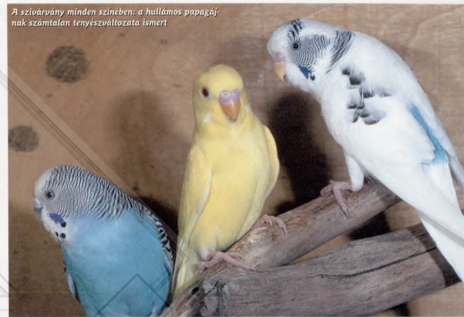
A szivárvány minden színében: a hullámos papagájnak számtalan tenyésztőváltozata ismert