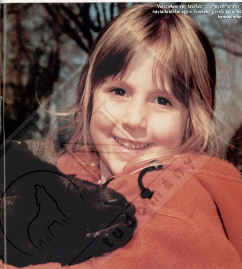
Volt nekem egy kecském: a „hagyományos” háziállattal egyre kevesebb gyerek kerülhet kapcsolatba

később az albinó forma a világ legelterjedtebb kísérleti alanyává, így valódi házonállattá is vált. A XX. század derekán aztán az egeret háttérbe szorította az akkor új felfedezettnek számító (és időközben a természetből szinte teljesen kipusztult) aranyhörcsög, majd következtek egyéb rágcsálók is, s ma se szeri, se száma a kisemlősök háziastított változatainak, melyek színük, szőrtípusuk, olykor méretük, és – bár ez első pillantásra kevésbé feltűnő – sokszor viselkedésük tekintetében is számottevően különböznek vadonélő őseiktől. Ezzel párhuzamosan megsokszorozódott a legnépszerűbb díszmadarak tenyészváltozatainak száma is, s a már évezredek óta ismert és tenyésztett aranyhal mellé is számtalan faj került fel a háziastított díszhalak listájára.