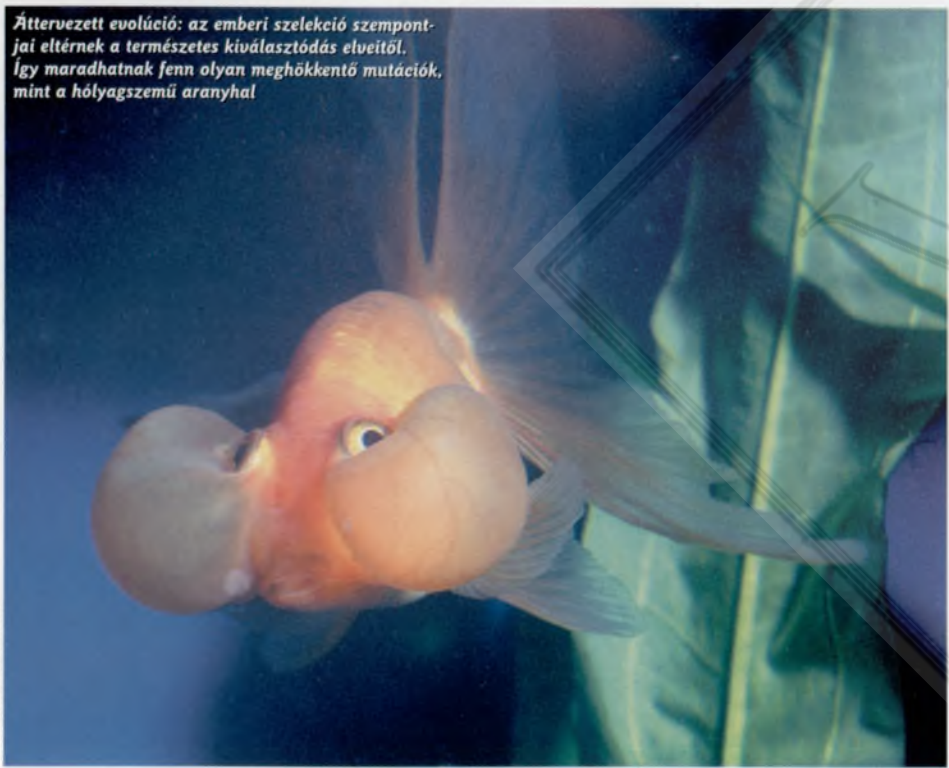
Áttermesztett evolúció: az emberi szelekció szempont- jai eltérnek a természetes kiválasztódás elveitől. Így maradhatnak fenn olyan meghökkenítő mutációk, mint a hólyagszemű aranyhal