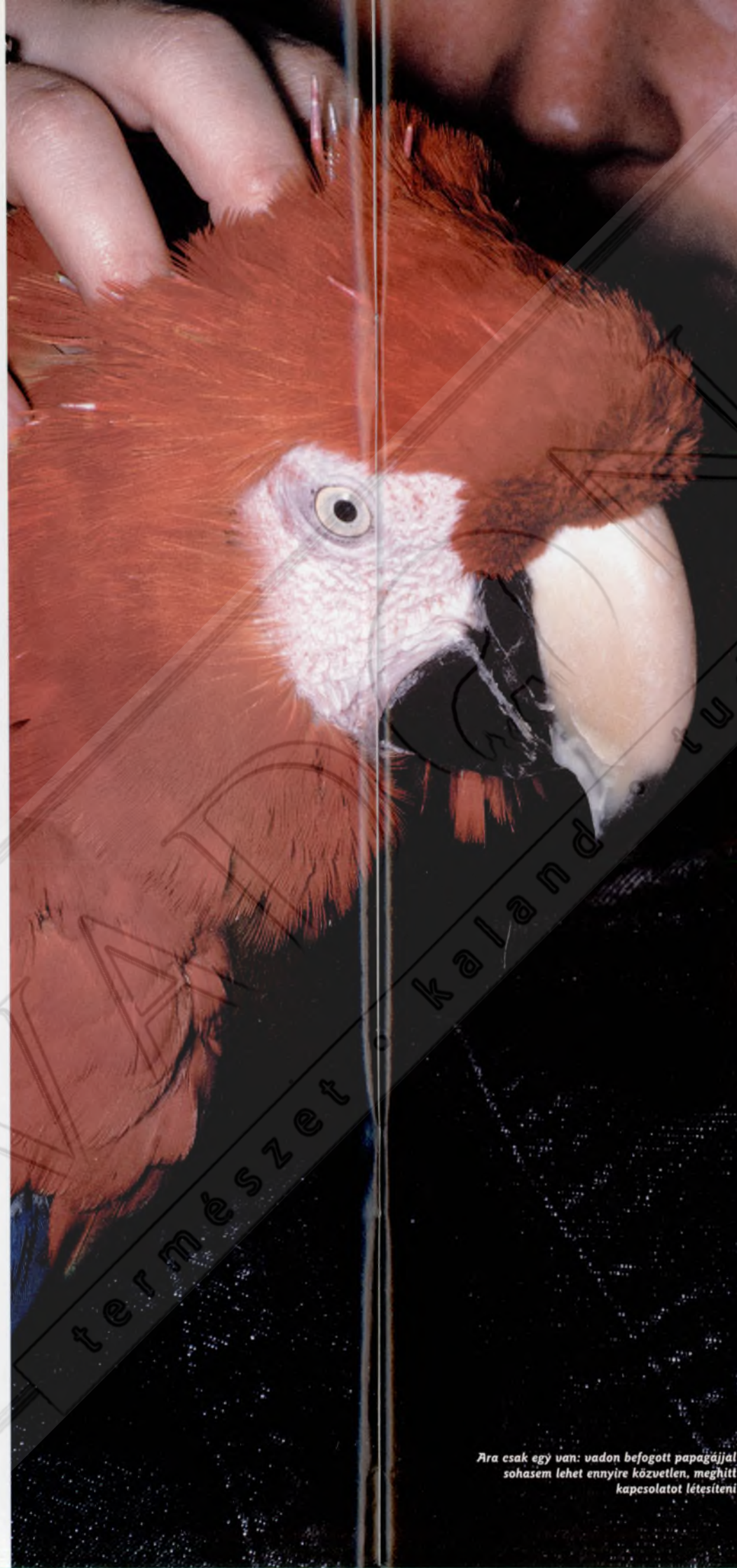
Ara csak egy van: vadon befogott papagájjal sohasem lehet ennyire közvetlen, meghitt kapcsolatot létesíteni