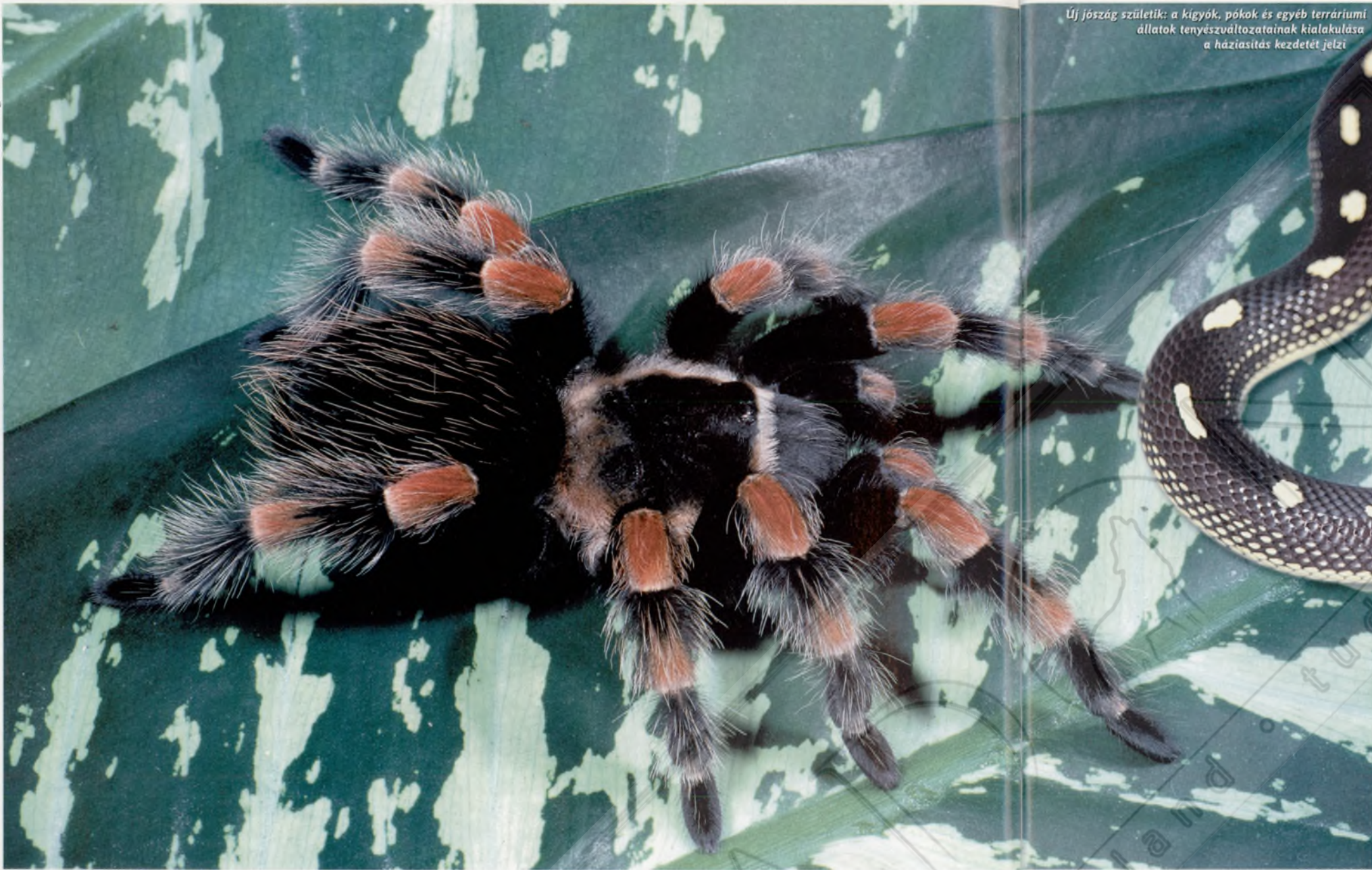
Új jöszög születik: a kígyók, pókok és egyéb terráriumi állatok tenyésztőitől származó állatok kialakulása a háziállat-tenyésztés kezdetét jelzi