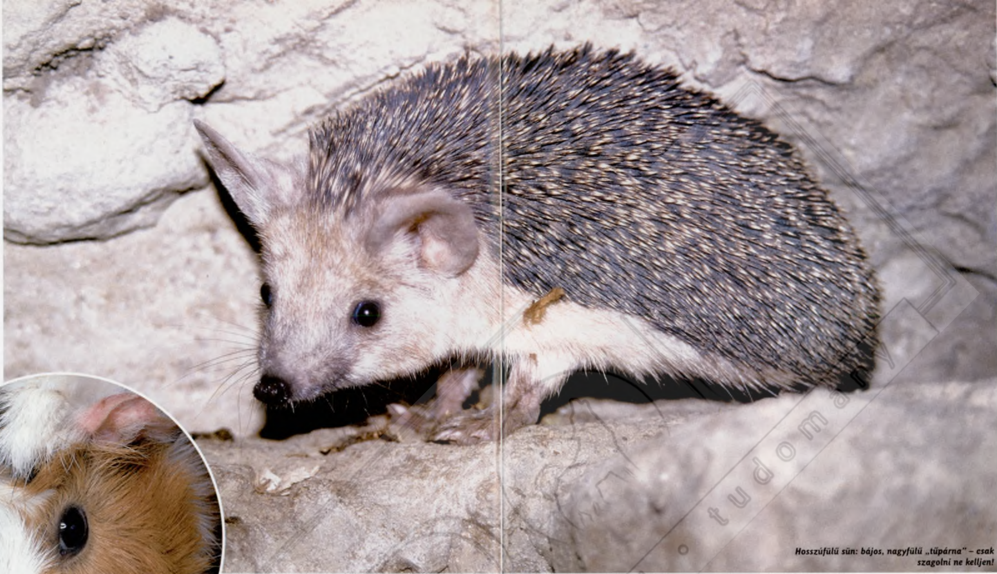
Hosszúfülű sün: bájos, nagyfülű „tűpárna” – csak szagolni ne kelljen!

terráriumban tartani, hiszen igazán jól csak a kertben vagy a verandán érzik jól magukat. A leggyakrabban tartott siklók, a királysiklók és gabonasiklók is hamar elérik az egy métert, nem beszélve a bébiként árusított óriáskigyókról. Nekik – a veszélyes állatok tartását szabályozó rendelet értelmében is – jókora, felszobányi méretű terráriumot kell a későbbiekben biztosítani. Hasonló a helyzet az arasznyi gyíkokkaként árusított, ám később akár másfél méteres, olykor harapós „sárkánnyá” váló zöld leguánnal is.