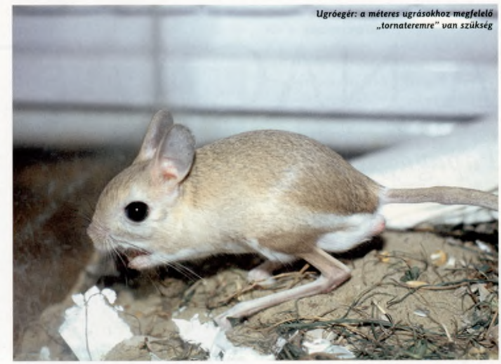
Ugrógér: a méteres ugrásokhoz megfelelő „tornateremre” van szükség

kal van gond; ilyenek például a cukormókusok, ecsetfarkú pelék, selyemmajmók, sünök. Az eredetileg sivatagokban, fél-sivatagokban élő fajok esetében erre a kellemetlenségre általában nem kell számítanunk.