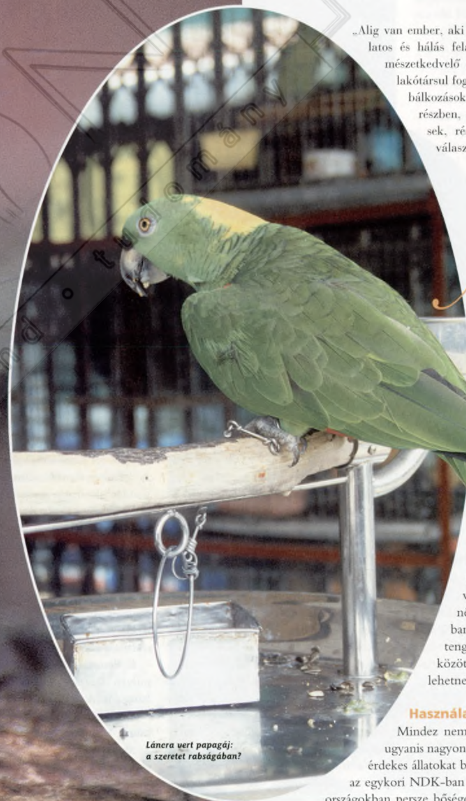
Lánéra vert papagáj: a szeretet rabságában?

A társállattartás terén hazánkban ma meglehetősen kaotikus állapotok uralkodnak. Noha szinte minden nem különösebben védett állatfaj beszerezhető, ám hogy a megvásárolt állatoknak mi lesz később a sorsa, arra gyakran már jobb nem gondolni. Sok nagytestű papagáj tengeti magányosan életét egy tágas nappaliban elhelyezett aprócska kalitkában, a parányi ékszerteknősök, ha nem pusztultak el néhány hét, hónap alatt, megnöve egy tóban találják magukat (konkurenciát jelentve a hazai mocsári teknősnek), alapvetően kertbe való görög teknősök vegetálnak néhány évig szobai terráriumokban, kényes kígyók és kameleonok tengődnek hozzá nem értő kezek között. A felsorolást sajnos még sokáig lehetne folytatni.