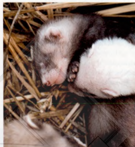
A szerző fékvédeli

tenyésztik őket (a vadászgörény méltó ellenfele a patkánynak, pézsmapocoknak és sok más rágcsálóknak, amelyek nagy károkat tudnak okozni a kiszgazdaságokban), és manapság egyre többen csatlakoznak a hobbi-görénytartók táborához is.