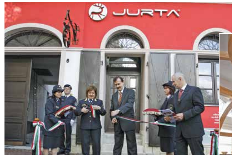
üzemeltetője a ruha- és textiliparban működő, 2013. október 1-jén megalakult Adorján-Text Kft.

közölte: nemcsak gazdasági sikerről van szó, hanem egy olyan új szemlélet egyik állomásáról, amely azt határozta meg célként, hogy a börtönökben elhelyezett, mintegy 18 ezer fogvatartott ellátását önfenn tartó módon biztosítsa. Az Állampusztai Országos Bv. Intézetben elhelyezett ezer fogvatartott közül hatszáz elítélt dolgozik a gazdasági társaságnál. A Kft., amely növénytermesztéssel és állattenyésztéssel egyaránt foglalkozik, a baromfitartás során évente 80–90 ezer pulykát és 700–800 ezer csirkét nevelhet.