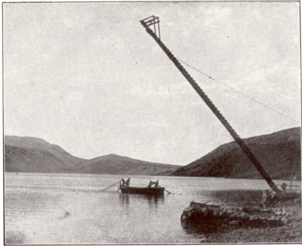
A háló kivetése és a figyelő létra.

MOREAU «Poisson de la France» című munkájában említést tesz egy nagy tinhalról, a melyet Cetteben fogtak 1878. évi április havában. Ennek a halnak a súlya 152.5 kilogramm volt, hossza pedig 1.96 méter. CETTI olasz természetbuvár szerint azonban az 500 kilogrammos tinhalak nem ritkák, szerinte néha 900 kilogramm súlyú tinhalat is fognak Szárdiniában. A nagy rajok többnyire kisebb halakból állanak. Minél nagyobbra nőnek, annál jobban gyérül a számuk s a rajok ennél fogva kisebbek. A mi a mellett tanuskodik, hogy minden évben ugyanazok a rajok jelennek meg vizeinkben, a melyek évek múltán erősen megtizedelve kerülnek vissza ívási helyükre. CETTI állítása is a mellett bizonyít, hogy a tinhalak rajai erősen megtizedelve kerülnek tengerünkbe s ennél fogva a legnagyobb példányokat már útközben, az olasz vizekben fogják el.