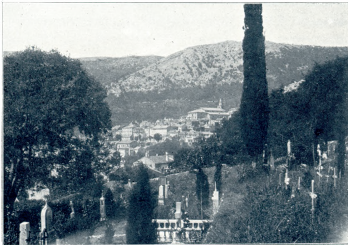
Buccari látképe a temető felől.

véresnek kell lennie a hálónak. Ez persze azt jelenti, hogy ekkor a háló bizonyosan megtelik tinhallal. A tapasztalás azt mutatja, hogy a késedelem a tenger hőmérsékleti viszonyaitól függ. Mert hát a vonulás mindig a tenger legfelsőbb rétegeiben történik. Enyhe tél után, korábban mutatkoznak a rajok, míg ellenben kemény tél után, a rajok vonulása rendesen