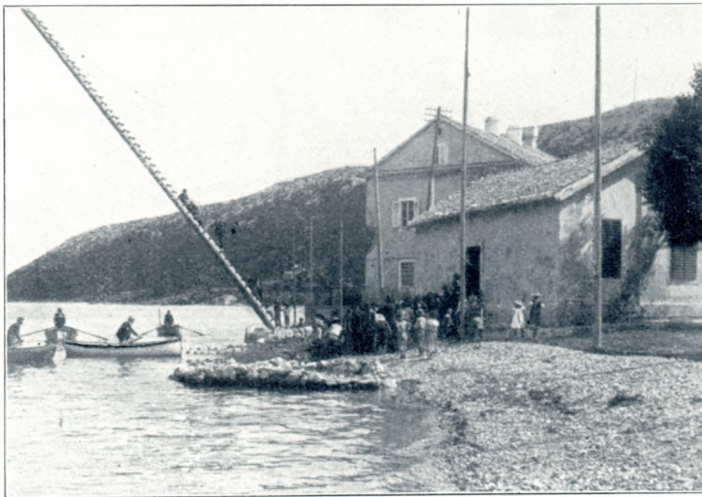
Kiváncsiak a hálóvontatásnál.

A legutóbbi időben az ichtiologusok mindinkább nagyobb érdeklődéssel tanulmányozzák a tinhal életviszonyait. Legértékesebb vizsgálódásokat különösen a nemrég