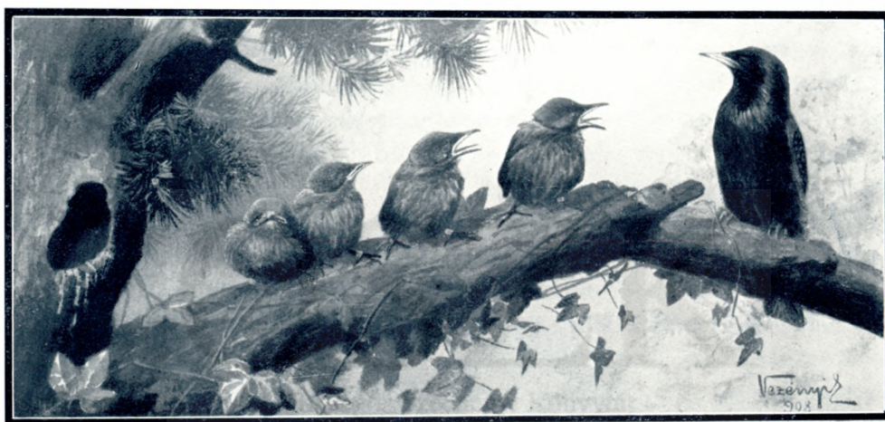
Megjelölt seregély-fiókák a fészek előtt.

A kísérlet céljaira könnyen, érthető okokból, lehetőleg olyan madárfajokat kell