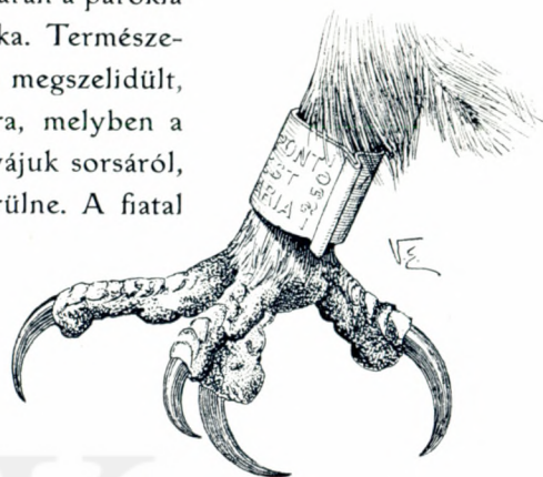
Gatyás ölyv lába.

Még az a kérdés merülhet föl, hogy milyen módon lehet a kísérlethez szükséges nagyszámú madarat, pl. gólyát, összefogdosni? A dolog nagyon egyszerű, mert javarészt