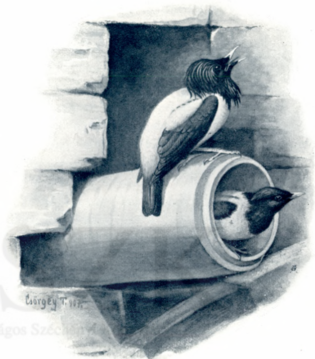
A pásztormadár fészke a hortobágyi híd szárító csövében.

A legérdekesebb dolog az volna, ha az idén is megjelenének a Hortobágyon, melyen nagyjában ugyanazokat az életföltételeket találják, mint rendes hazájukban s ha ily módon hazánk rendes lakóivá válnának. Megtelepedésükkel nemcsak gyönyörű ékességre és újabb nevezetességre tenne szert a méltán híressé vált Hortobágy, hanem egyúttal rendkívül hasznos madárlakosságra is, a mely állandó sáskairtásával megakadályozhatná hasonló csapások kifejlődését, mint a milyen az 1907. évi sáskajárás volt.