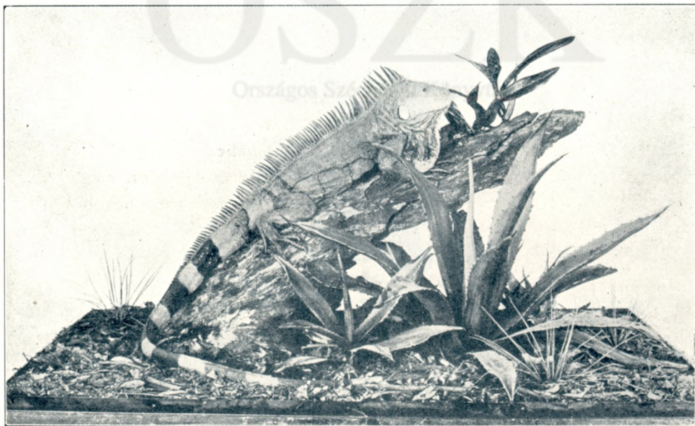
Képek a new-yorki természetráji múzeumból: Mexikói Iguana .

Különös hely ez itt, a hol delelünk. Nagy, terebélyes fás sziget. Magasan fönt a fakorona, alább lombtalanok, töredezetek az ágak. Alant a fák közt nincs élet, nincs fű. Csak száraz galy, zörgős levéllel kitöltött avar. Mégis nagy rajokban lepkeseregek kergetőznek. Ők élénkítik az egyhangú környezetet. Rózsáslila szárnyaikkal, mintha libegő nagy virágok lennének. Az árvíz járt itt, letarolta az alsó zöld életet és otthagyta a hervadást. Most már visszaszorult rendes medrébe.