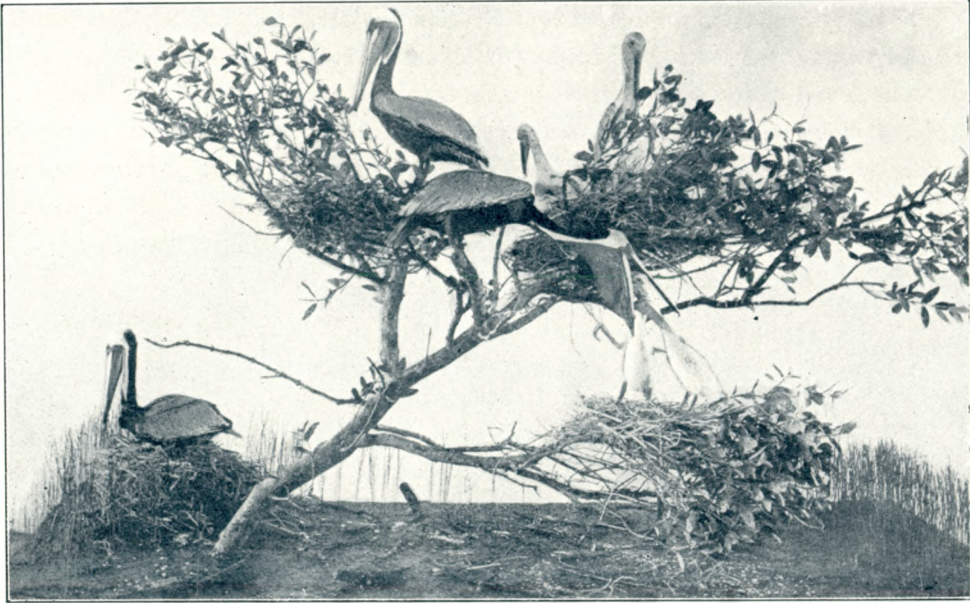
Képek a new-yorki természetráji múzeumból: Barna pelikánok csoportja.

készültem, gyönyörű fiatal pár jaguárt akart a nyakamba varrni. Még pedig erős ketreczestől 100 K-ért. Nem régen került fogságba a két vizslanagyságú állat. Remek egy