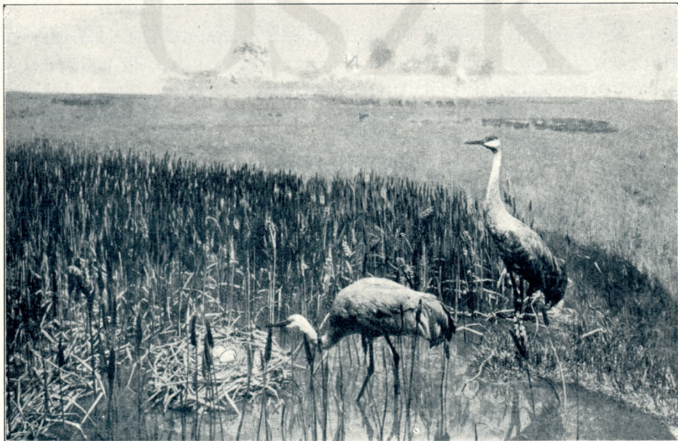
Képek a new-yorki természetrajzi múzeumból: Darucsoport.

Ettől vettem kétféle kitömött fejlett alligátort. Két-kétméteresek lehettek, az én emberem 70—80 esztendőre becsülte őket. Nem ritkák a 3 1 / 2 méteresek sem. Tessék következtetni. Eszembe jut most ugyanennek a kereskedőnek kis állatsereglete. Mikor vissza-