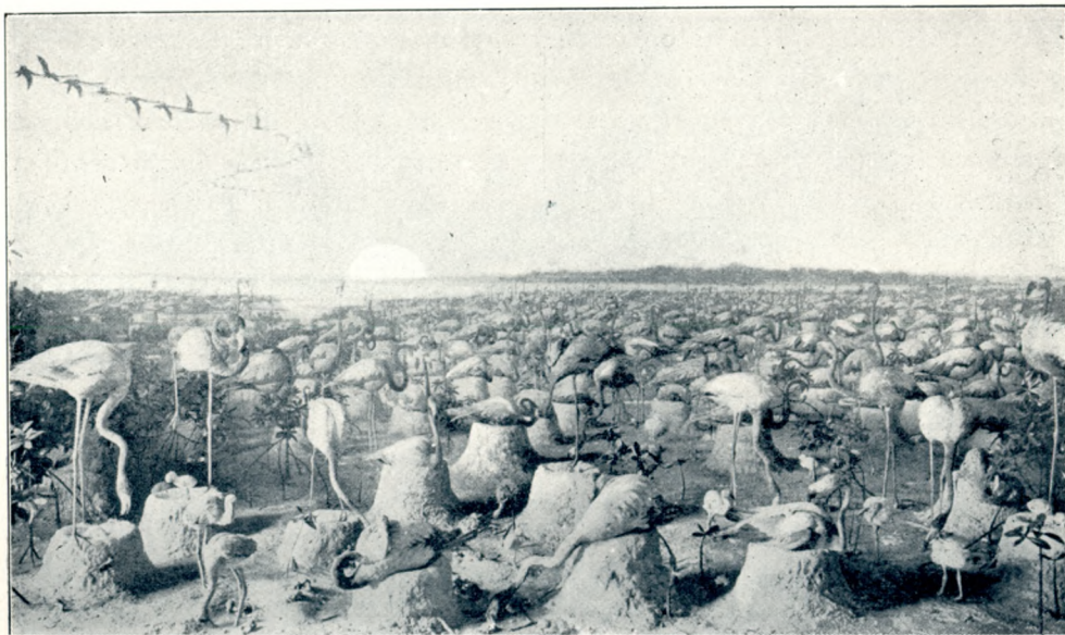
Képek a new-yorki természetrajzi múzeumból: Flamingó-csoport.

tartani háziállatnak. Milyen pietással simogathatnák az űkanya kedvencét a késő utódok. Volt Paraguayban egy üzletember, a kinek révén hozzájutottam egynéhány raritáshoz.