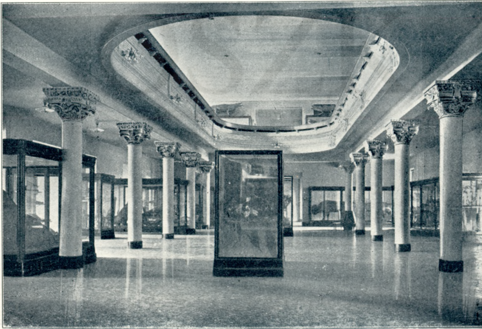
Képek a new-yorki természetrajzi múzeumból: Az emlősök és madarak nagyterme.

Még itt a subtropikus Délamerikában is túlragyogós ez a nyáreleji reggel. Az