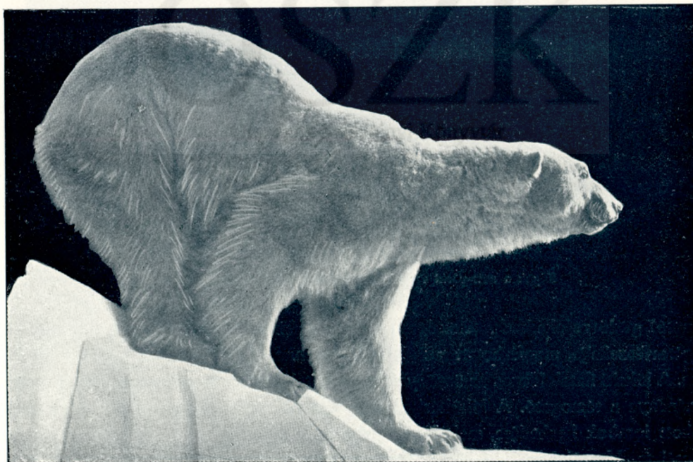
Képek a new-yorki természetrajzi múzeumból: Jegesmedve.

Ezt a dsakaré gnazút veszedelmesebbnek mondják. Ez igazán támad, a többi támadása csak önvédelem. A nász idején a szőke kaiman erős mosusz-szagot áraszt. Az illatszert imádó délamerikai nők szagos vízzel keverve használják a mosuszmirigyek váladékát. Békés, emberkerülő állatok. Nem ismerik 2–4 méteres testüknek, hegyes fogazatuknak erejét. A közvetlen közelből kapott golyók elől is csak akkor futnak, ha szemük ügyébe kerül az ember, a ki küldte. Ilyenkor tehetetlen farkcsapkodással igyekszik