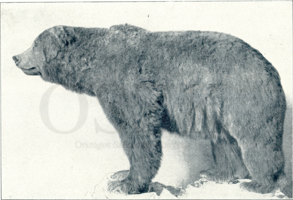
Képek a new-yorki természetrajzi múzeumból: Alaszakai medve.

Ösvényféle vezet be a partról. Alligátorkészítette út a vízhez. Vagy tíz méternyire