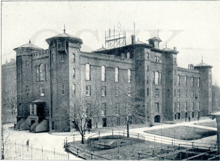
A new-yorki természettajzi múzeum első otthona (1870—77). (A városi arzenál épülete.)

A közölt képekből is láthatjuk, hogy a new-yorki természettajzi múzeum egyike a világ legszebb és legnagyobb múzeumainak, mely mintául szolgálhat minden nagyobb múzeumnak. Bár tervbe vett új természettajzi múzeumunk legalább annyira közelítené meg a new-yorki múzeumot, a mint a szerencsétlen végű II. Lajos bajor király chiemsee-i kastélya közelíti meg XIV. Lajos páratlan versaillesi kastélyát.