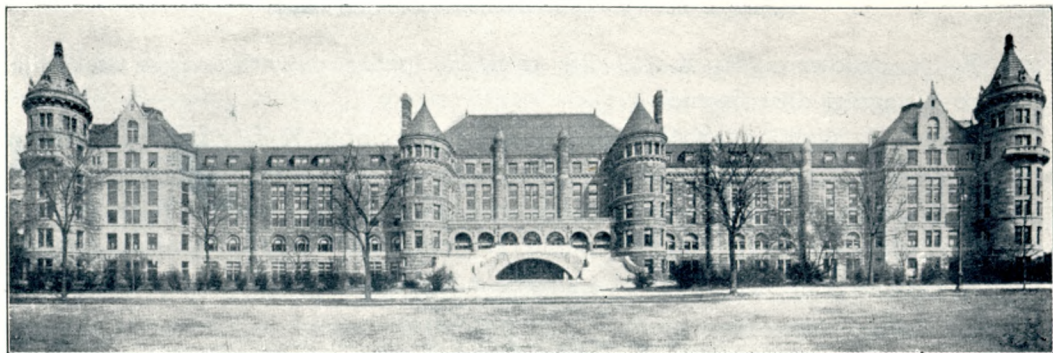
A new-yorki természetrajzi múzeum.