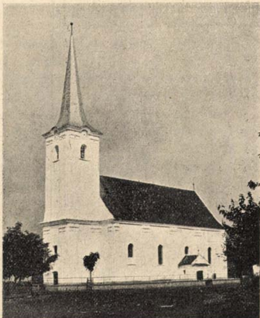
A vargyasi unitárius templom.