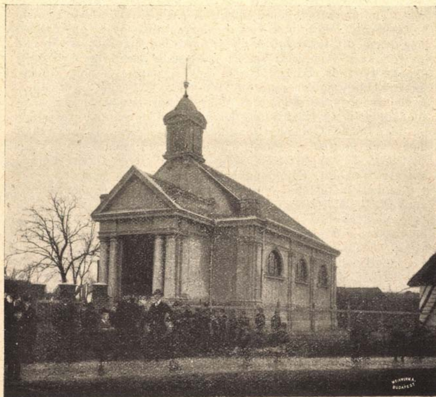
A FÜZESGYARMATI UNITÁRIUS TEMPLOM, ÉPÜLT 1903-BAN.