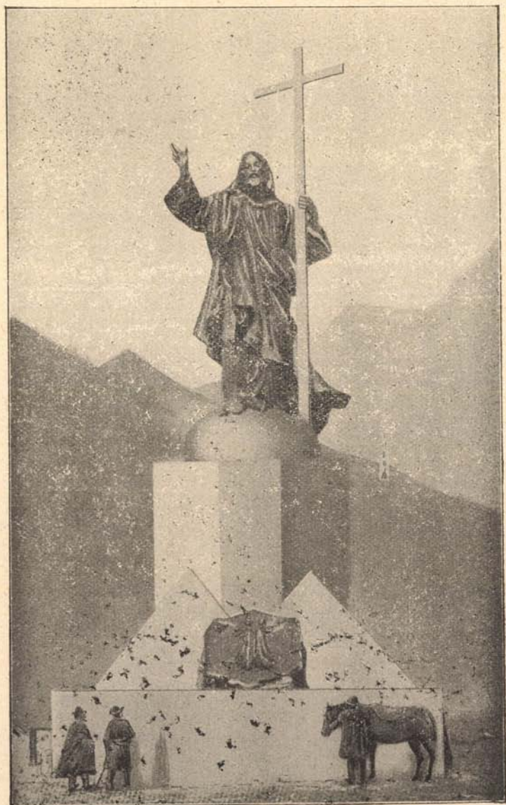
Az Andesek Krisztusa.