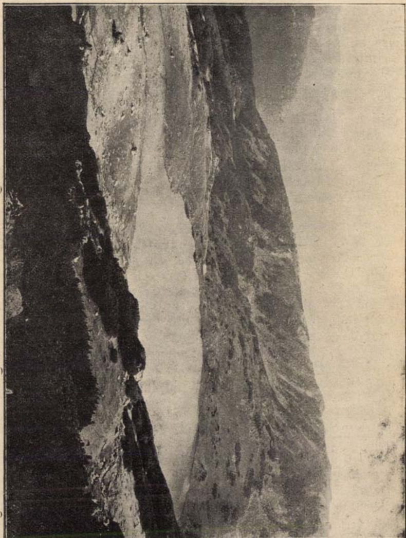
A leendő retyezati nemzeti park egyik legszebb tengerszemé.

magasban kóválygó saskeselyük ma csak a Retyezátban található meg. Jellegzetes retyezati növények, régi gleccser maradványok, felejthetetlen szépségű tájak a túristák és természetbarátok százait vonják magukhoz. Ha ezt úgy rendezik be, mint az amerikaiak a Yellowstonit, akkor az emberek ezrei nem fogják külföldre hordani azt a pénzt, ami idehaza is olyan jól fog.