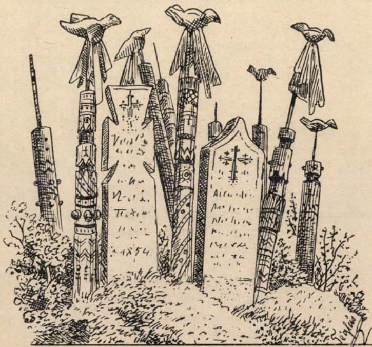
Kopjafák a székelyföldi temetőben.