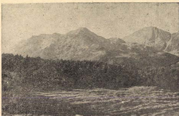
Részlet a Retyezátból.

Nemzeti parkot létesítenek a Retyezátban. Az emberi kultúra terjedésében mind inkább pusztuló természetet ma emberi beavatkozással lehet csak megakadályozni. Legelőször Amerikában észlelték, hogy a százezernyi példányban legelésző bölények pár-évtized leforgása alatt a kipusztulás szélére jutottak, ezért felállí-