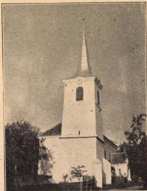
Chenus-i unitárius templom.

Jelenlegi templomunk s papilakásunk építéséről jegyezte fel egyházközségünk történetírója, hogy amikor már minden anyagi erő kifogyott 40—50 gazda indult el ekéjével