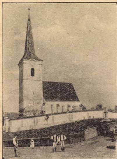
Crăciuneli unitárius templom.

Azonban a szerelem, mint mentő angyal meghiusította ezt, amint a régi történet mondja. Egy unitárius legény ugyanis a kath. megyebíró leányához járt, ez — a templom foglalásra kitűzött nap előtti estvén — elárulta a titkot, megsugta udvarlójá-