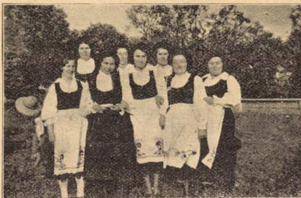
Az odorhei köri unitárius lelkészek nejei a Crăciuneli köri nőegylet gyűlésén