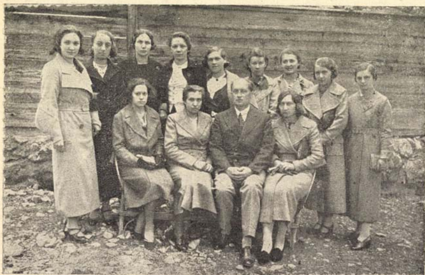
A csecsemővédő tanfolyam előadói és hallgatói.