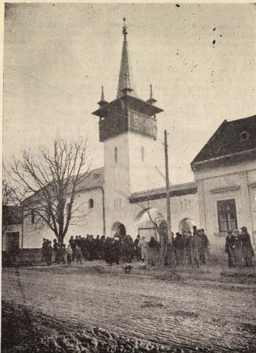
A dunapataji unitárius templom.