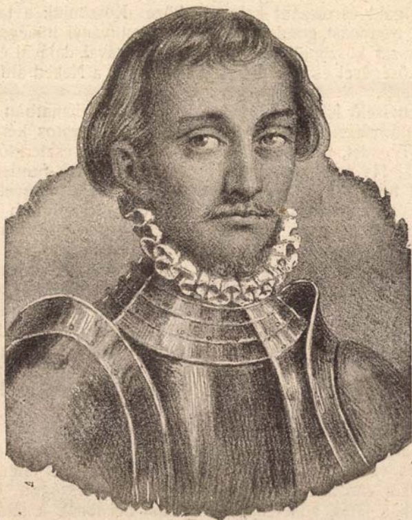
Janos Zsigmond, erdélyi unitárius fejedelem, 1540—1571.

Cluj, Cal. M. Foch 12. II. emelet 22. ajtó.