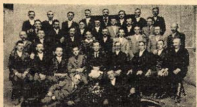
A bányoni menekültek egy csoportja.