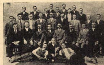
A kövendi menekültek egy csoportja.

KERESZTES SÁNDOR MAV. felügyelőt január 2-án temették. Néhai atyánkfia egyházi főtanácsunknak buzgó tagja, a magyar közeletnek fáradhatatlan munkása volt.