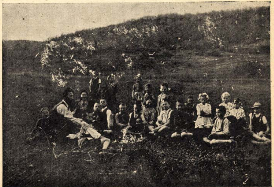
A légiveszedelem elől falura telepített kolozsvári elemistáink kedves és jóhangulatú kirándulást rendeztek.

Nagybányai lelkészi hivatalunk címe megváltozott. Új címe: Kossuth-utca 27.