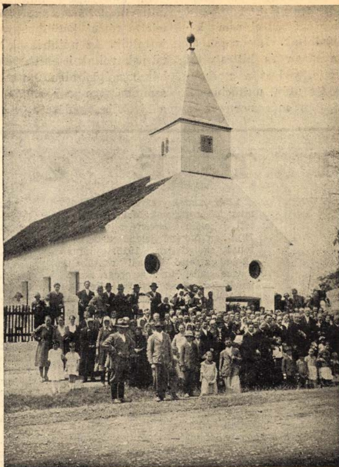
Ünnepi gyülekezet a templomszentelésen.