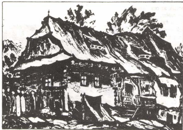
Vernes András: Torockói régi ház.

Az Észak-Amerikai Unitárius-Unitarizálista Egyház rendezésében került sor erre a világtalálkozóra, amelynek színhelyéül Budapestet választották, időpontja 1992. március 19-22. volt.