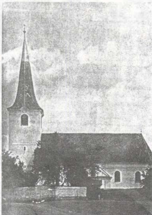
A kissolyosi unitárius templom

Sajnos, az is az igazsághoz tartozik, hogy - tisztelet a kivételt képezőknek -lelkészek jórésze meglehetősen közömbösen viszonyult, viszonyul a mindannyiunk, az unitáriusok lapjához! (Számomra például ez a közömbösség mindmáig