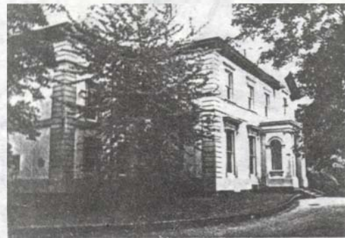
A manchesteri unitárius főiskola régi épülete

Az iskolaépítés után csendesebb idők következtek a gyülekezet életében. Gr. Bethlen Ferenc, majd pedig ifj. Demeter János alapítványa is sokat könnyített a kisközség helyzetén, melynek lélekszáma, egy 1851-es bejegyzés szerint, 254-re emelkedett. Ugyanebből az évből maradt ránk egy feljegyzés a szabadságharc kapcsán is: az egyházközség „a közelebbi üdőknek annyi zivatarjai között semmi változást nem szenvedett, sőt tagjaival egyetemben épségben maradt”.