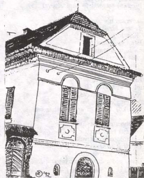
Torockói ház - Paskucz László grafikái