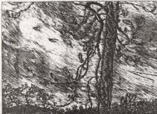
Gy. Szabó Béla: Április

Nézne is jó téged, - megbocsásd. Kívánok szerencsés utazást!