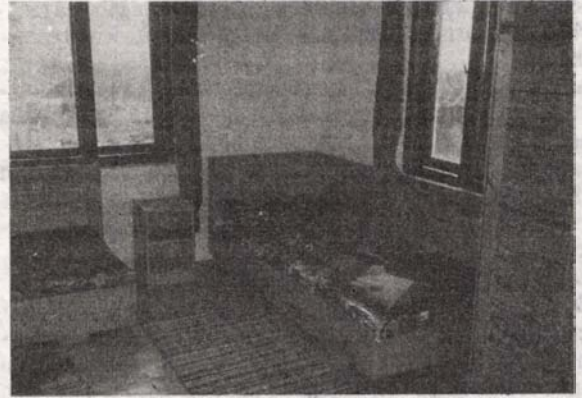
Az Ifjúsági Ház egyik hálószobája

- Lépcsőház, bejárat: "Unitarian Christian Fellowship" (Egyesült Államok)