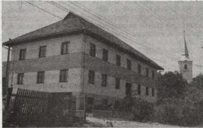
A homoródszentmártoni Ifjúsági Ház