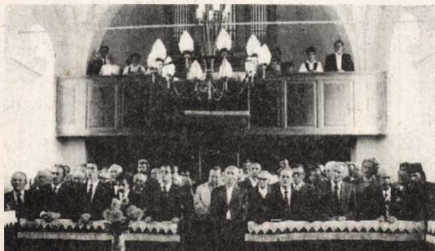
Lelkészbekiktató, Olthévíz 1994. október 2.