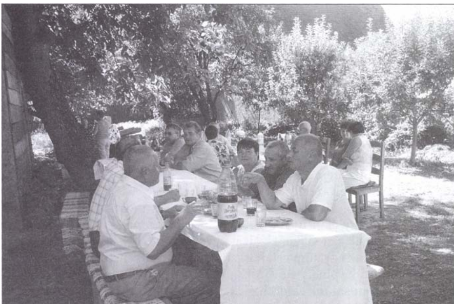
A Segesvári Unitárius Egyházközség ebben az évben is megszervezte az Unitárius Napot. Ez volt sorrendben a 4. ilyen rendezvény. A gyülekezet tagjai és a vendégek az augusztus 20-ához legközelebb eső vasárnapon bográcsfőző versennyel, élő zenével töltöttek el közösen egy délutánt a papilak udvarán.