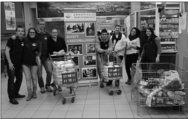
Az adománygyűjtők egyik csoportja

A húsvétot megelőző hétvégén, 2014. április. 11–12-én, a Gondviselés Segélyszervezet adománygyűjtést szervezett a székelyföldi Merkúr üzletlánc két székelyudvarhelyi áruházában. Az ötlet segélyszervezetünk anyaországi tagozatának hasonló gyűjtései nyomán született. A székelyudvarhelyi üzletvezetőkkel egyeztetett forgatókönyv alapján önkéntes munkatársaink tartós élelmiszereket, tisztálkodási szere-