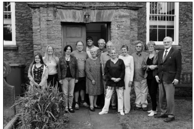
A Frenchay Chapel előtt a vasárnapi gyülekezet tagjaival

Vasárnap a plymouth-i gyülekezetben szolgáltam, majd elsétáltunk a rakpartra, ahonnan a híres Mayflower hajó elindult Amerikába az első telepeseikkel. Cornwalli tartózkodásuk kiemelkedő élményeit