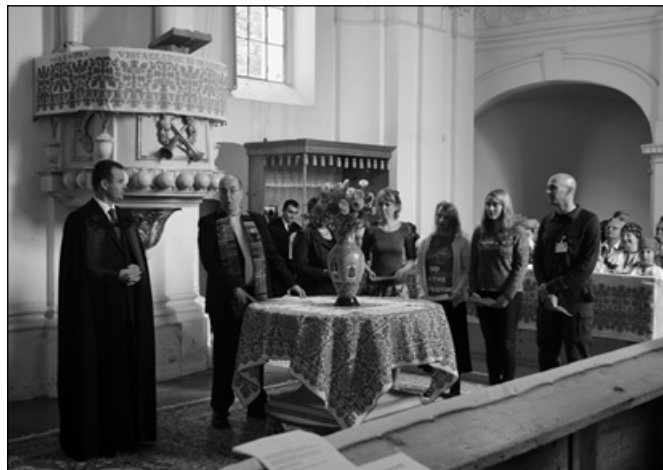
Az európai nemzetek egy-egy képviselője anyanyelven emlékezett az első világháború áldozataira