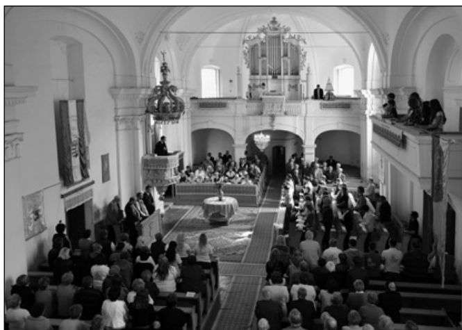
A torockói templom újra megtelt helybeliekkel és vendégekkel