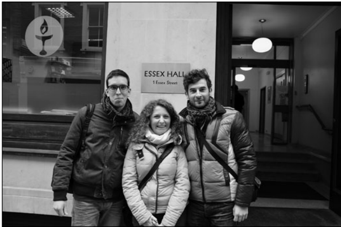
Az Essex Hall előtt

nyire adminisztratív funkciót tölt be, ugyanis a gyülekezetek teljes autonomiával rendelkeznek, ami azt jelenti, hogy minden felmerülő kérdésben a gyülekezet hivatott dönteni, és problémáikat is önállóan oldják meg. Az általános, szervezeti, teológiai kérdésekről a GA (General Assembly), azaz a közgyűlés dönt. Ez évente ül össze, és többnyire külképviseleti kérdéseket tárgyal.