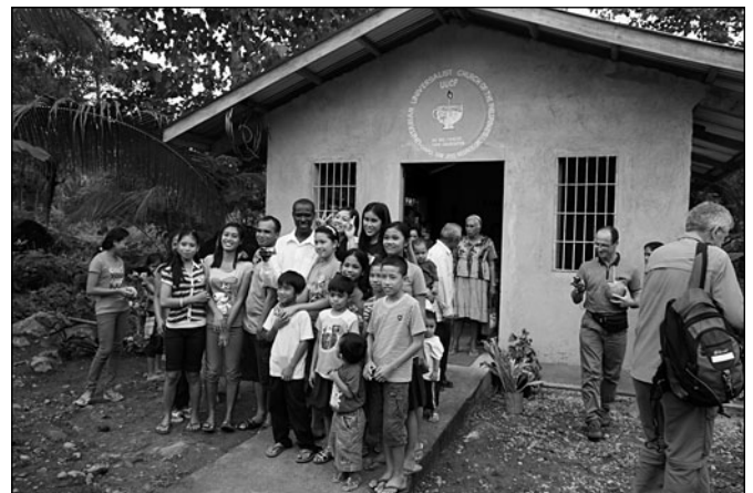
Új unitárius templom a Fülöp-szigeteken. Nem segélyből, hanem biztatással épült

Az ICUU és a nemzetközi unitárius közösség nem varázsolja tele a Földet unitáriusokkal, de arra igenis törekszik, hogy a már meglévőket erősítse és egységbe fogja, az érdeklődőknek pedig biztosítsa az unitárius erőforrások közelségét. Akkor válunk igazán mi is a nemzetközi unitárius közösség tagjaivá, ha e törekvésből és biztosításból minden magyar unitárius személy és egyházközség kiveszi a részét – ha nem is egyforma eredménnyel, de egyenlő akarattal és szeretettel. Erre való lehetőség a mindenkorai nemzetközi unitárius vasárnap megünneplése is – éljünk vele minden évben!