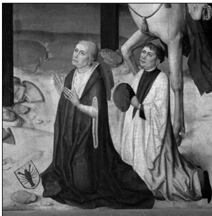
Nicolaus Cusanus a Bernkastel-Kues-i Szent Miklós-kórház kápolnájának festményén, kb. 1480

ben találja meg. Minden ok és minden okozat az elérhetetlen Istenben lelhető meg. Karl Jaspers, a neves filozófus írja Cusanusszal kapcsolatban a következőket: „Tehát: a falon innen van a gondolkodás, amelyik meg akarja érteni a teremtést és a Teremtőt; a falnál van a teremtés és a teremtett világ ellentétének egybeesése; a falon túl pedig a kötetlen Végtelenség, akihez semmilyen név nem méltó, Aki ott a (róla való) gondolkodás és beszéd leple nélkül szemlélhető. Semmiképpen sem olyasvalami, amit ki lehetne mondani, vagy meg lehetne érteni, hanem végtelen magasságban fennkölt mindeknek felett.” (Karl Jaspers: A cusanusi spekuláció alapgondolata )