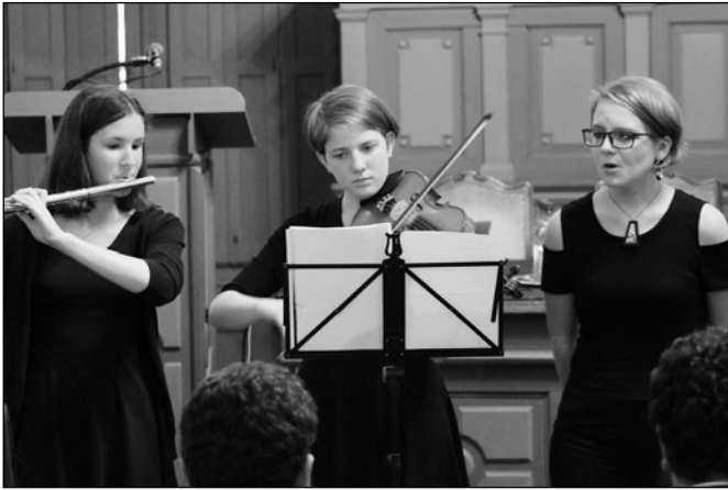
Balázs Ferenc dalai is elhangzottak

nyesen működött egy darabig. A szövetkezetszervezésről tanulmányokat is írt, amelyek éleslátásról tanúskodnak, s amelyek következtetései ma is alkalmazhatóak. A Kis társadalmak önellátása c. tanulmánya szerint a szövetkezetesítés csakis önkéntes alapon tud jól működni (gondoljunk csak a kommunizmus erőszakos tévesztésére mint negatív példára!), fontos, hogy a gazda, a földbirtokos biztonságban érezze földjét, magát a szövetkezetben. A szövetkezet csak kistérségekben működhet jól, amelyek földrajzilag, néprajzilag egységesek. Kora – de úgy néz ki, jelenünk – gondjaira Balázs megoldása így hangzott: „Magyarul kell moderneknek lennünk.”