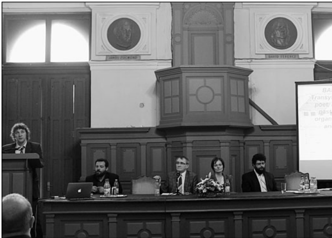
A konferencia előadóinak egy része