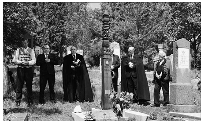
Balázs Ferenc kopjafája

A rendezvényt támogatta a Bethlen Gábor Alap és a Communitas Alapítvány.